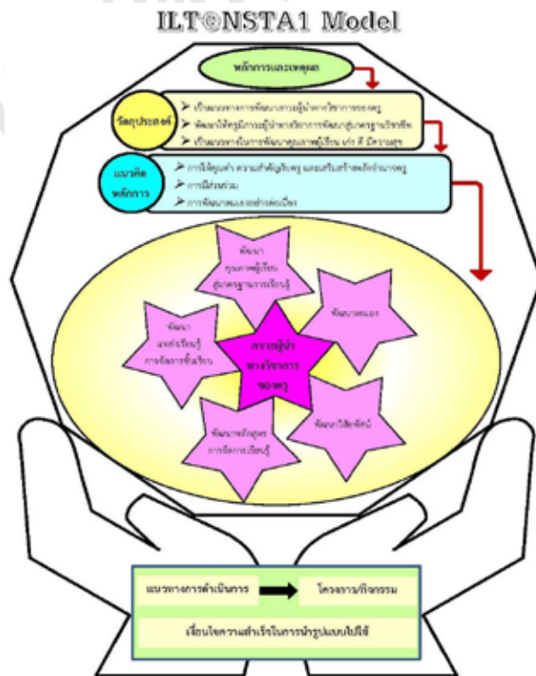
ภาพที่ 2 รูปแบบการพัฒนาภาวะผู้นำทางวิชาการของครูในสถานศึกษาขั้นพื้นฐาน สังกัดสำนักงานเขตพื้นที่การศึกษาประถมศึกษา นครศรีธรรมราช เขต 1

3. การตรวจสอบรูปแบบการพัฒนาภาวะผู้นำทางวิชาการของครูในสถานศึกษาขั้นพื้นฐาน สังกัดสำนักงานเขตพื้นที่การศึกษาประถมศึกษา นครศรีธรรมราช เขต 1 พบว่า มีความถูกต้องเหมาะสมเป็นไปได้ และนำไปใช้ประโยชน์ในการพัฒนาคุณภาพ การศึกษาได้ทุกส่วน