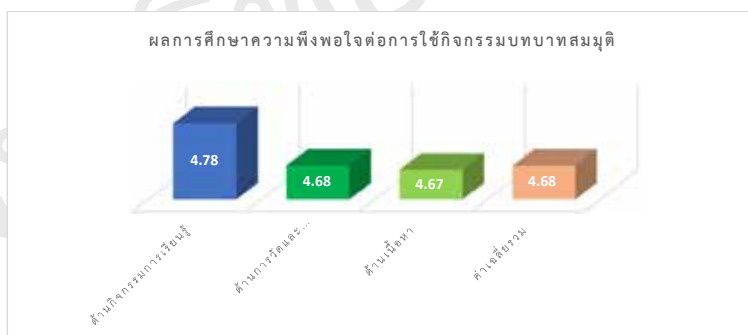
ภาพที่ 3 ผลการศึกษาความพึงพอใจต่อการใช้กิจกรรมบทบาทสมมติ

จากตารางที่ 2 พบว่า ทักษะการพูดภาษาจีนหลังการใช้กิจกรรมบทบาทสมมติของนักศึกษาสูงกว่าก่อนเรียนอย่างมีนัยสำคัญทางสถิติที่ระดับ .05 เมื่อวิเคราะห์ค่าเฉลี่ยด้วย t-test ปรากฏค่า t\text{-test} = 12.98 ผลการศึกษาความพึงพอใจต่อการใช้กิจกรรมบทบาทสมมติเพื่อพัฒนาทักษะการพูดภาษาจีนของนักศึกษาโปรแกรมวิชาการสอนภาษาจีน คณะครุศาสตร์ มหาวิทยาลัยราชภัฏเชียงราย