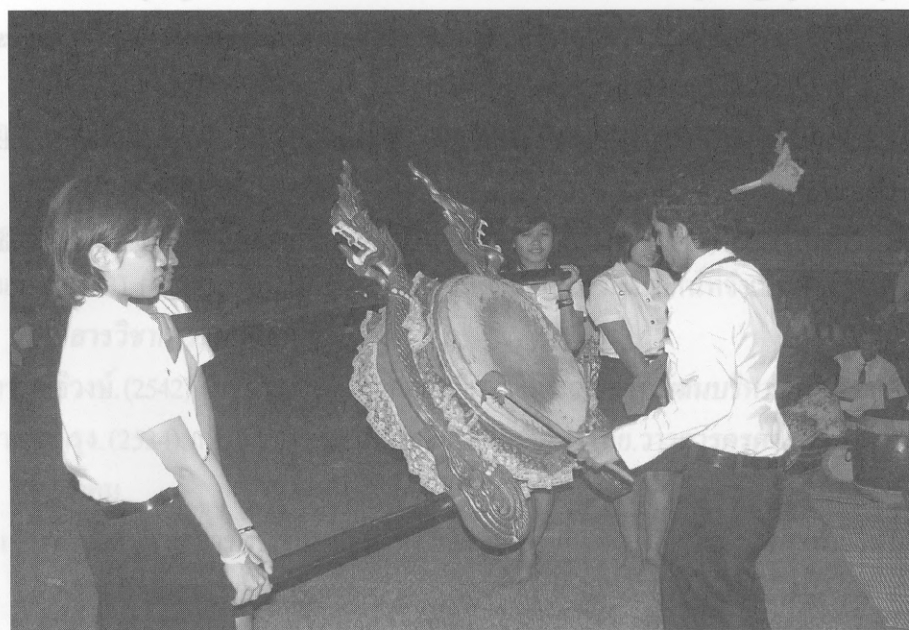
โรงเรียนอาชีวศึกษาเอกชนแห่งประเทศไทย, กรุงเทพฯ: ศิลปการนิพนธ์