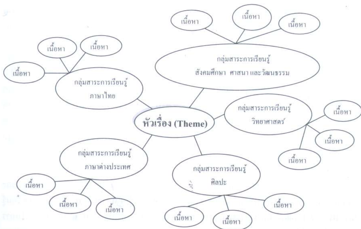
ภาพที่ 1 แผนผังความคิดการบูรณาการความรู้ในสาขาวิชาต่าง ๆ

การจัดทศศึกษาในรูปแบบของการบูรณาการนั้น ผู้สอนสามารถกำหนดรูปแบบการเรียนการสอนและพิจารณาคัดเลือกเนื้อหาสาระของแต่ละสาขาวิชาได้ตามความเหมาะสมดังตัวอย่าง เช่น