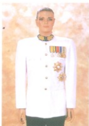
ชุดขอเฝ้า

ผู้ที่ไม่มีกฎหมายหรือข้อบังคับของทางราชการกำหนดให้มีเครื่องแบบเฉพาะ