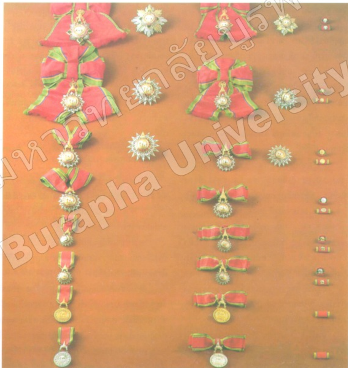
ภาพ 2.1.1 ประกอบ เครื่องราชอิสริยาภรณ์อันเป็นที่เชิดชูยิ่งช้างเผือก

เครื่องราชอิสริยาภรณ์ช้างเผือก มี 8 ชั้น แยกเป็นตรา 6 ชั้น เหรียญ 2 ชั้น ดังนี้