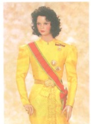
ชุดไทยบรมพิมาน