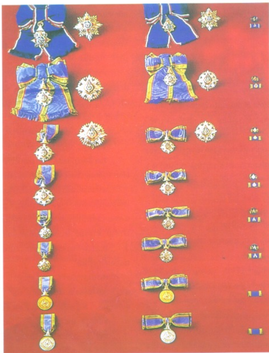
ภาพ 2.2.1 เครื่องราชอิสริยาภรณ์อันมีเกียรติยศยิ่งมงกุฎไทย