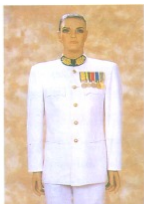
ชุดขอเฝ้า

ผู้ไม่มีกฎหมายหรือข้อบังคับของทางราชการกำหนด ให้มีเครื่องแบบเฉพาะ