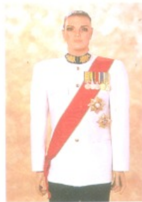
ชุดขอเฝ้า

ผู้ที่ไม่มีกฎหมายหรือข้อบังคับของทางราชการกำหนดให้มีเครื่องแบบเฉพาะ