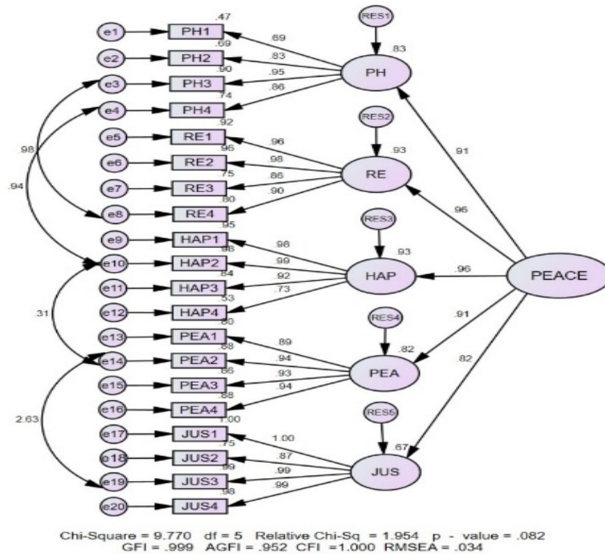
รูปที่ 3 แสดงโมเดลการวิเคราะห์องค์ประกอบเชิงยืนยันของตัวบ่งชี้ภาวะผู้นำสันติสุขของผู้บริหาร สถานศึกษาในเขตพื้นที่พัฒนาพิเศษเฉพาะกิจจังหวัดชายแดนใต้

2.3 การตรวจสอบความสอดคล้องกลมกลืนของโมเดลมาคัดเลือกตัวบ่งชี้ที่แสดงว่า มีค่าความเที่ยงตรงเชิงโครงสร้างหรือค่าน้ำหนักองค์ประกอบ (Factor Loading) ที่มากกว่า 0.50 สำหรับองค์ประกอบหลัก และ เท่ากับหรือมากกว่า 0.30 สำหรับองค์ประกอบย่อยและตัวบ่งชี้ (ยุทธ ไกยวรรณ, 2557, น. 77-78) ผลการวิจัยสามารถสรุปได้ว่าค่าน้ำหนักองค์ประกอบ (Factor Loading) ขององค์ประกอบหลักทั้ง 5 องค์ประกอบหลัก มีค่าเป็นบวก มีค่าตั้งแต่ 0.91 - 0.96 และมีนัยสำคัญทางสถิติที่ระดับ .01 ทุกค่า