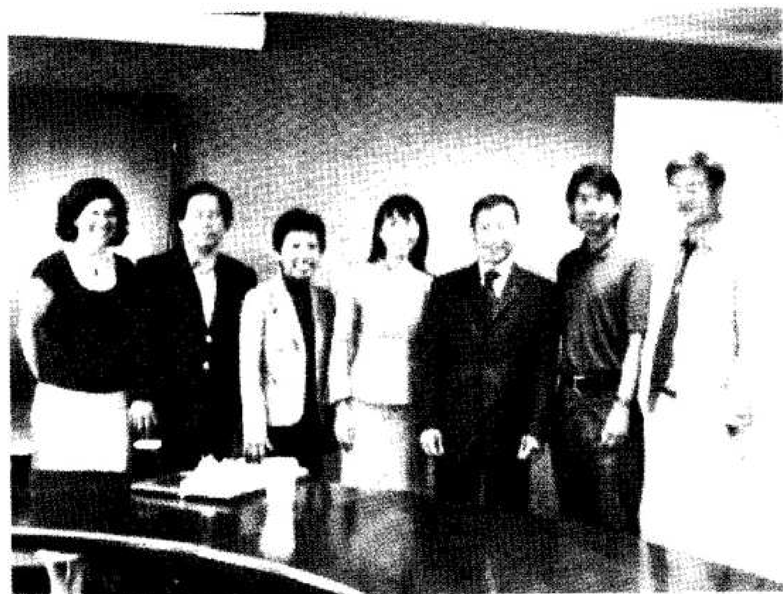
รูปที่ ๓ กงสุลไทยประจำนครชิคาโกให้เกียรติร่วมถ่ายภาพกับคณะกรรมการโครงการฯ