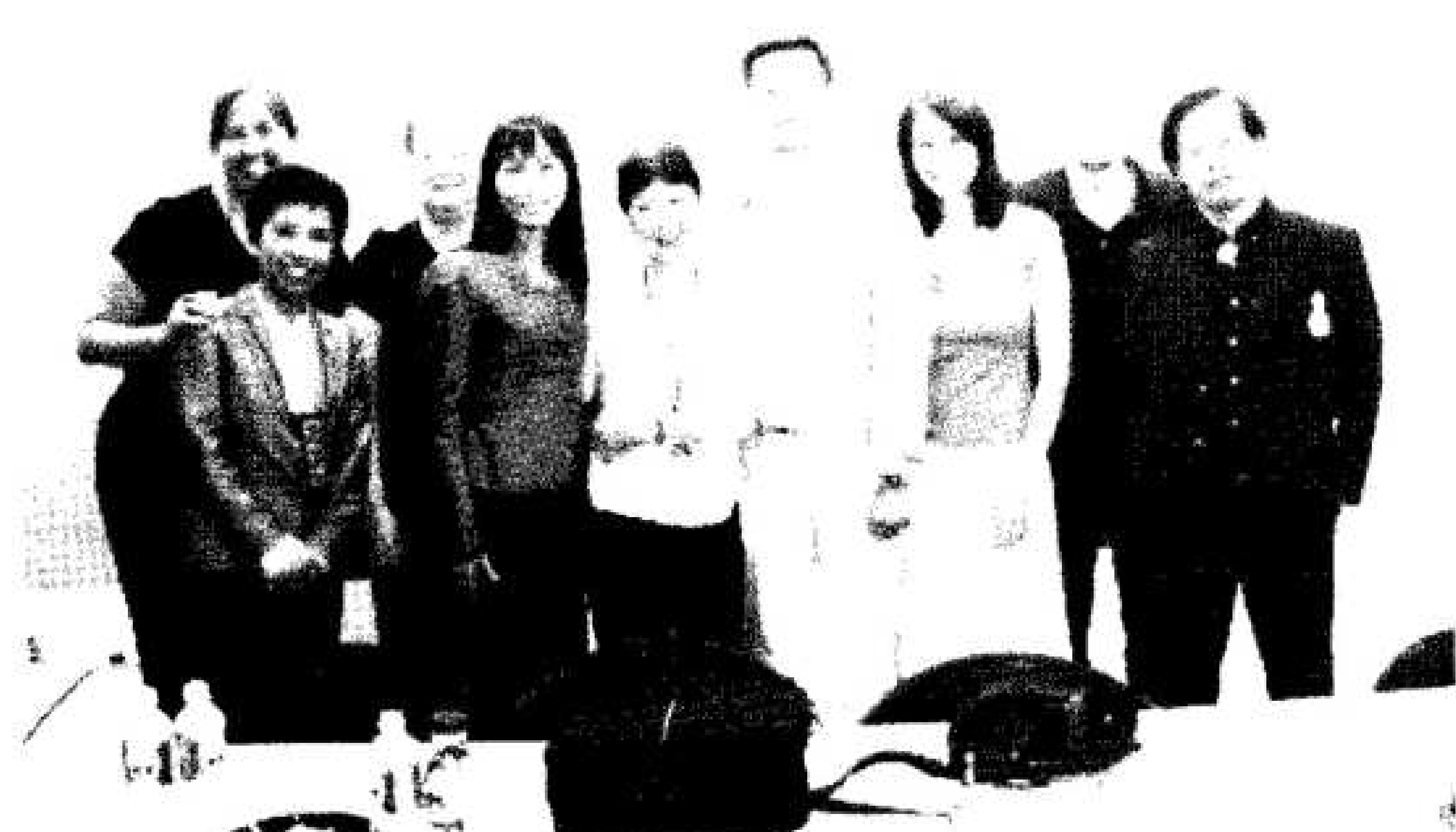
รูปที่ ๑ ศ. ดร.สุชาติ อุปถัมภ์ อธิการบดีมหาวิทยาลัยบูรพา กับคณะทำงานบางส่วน