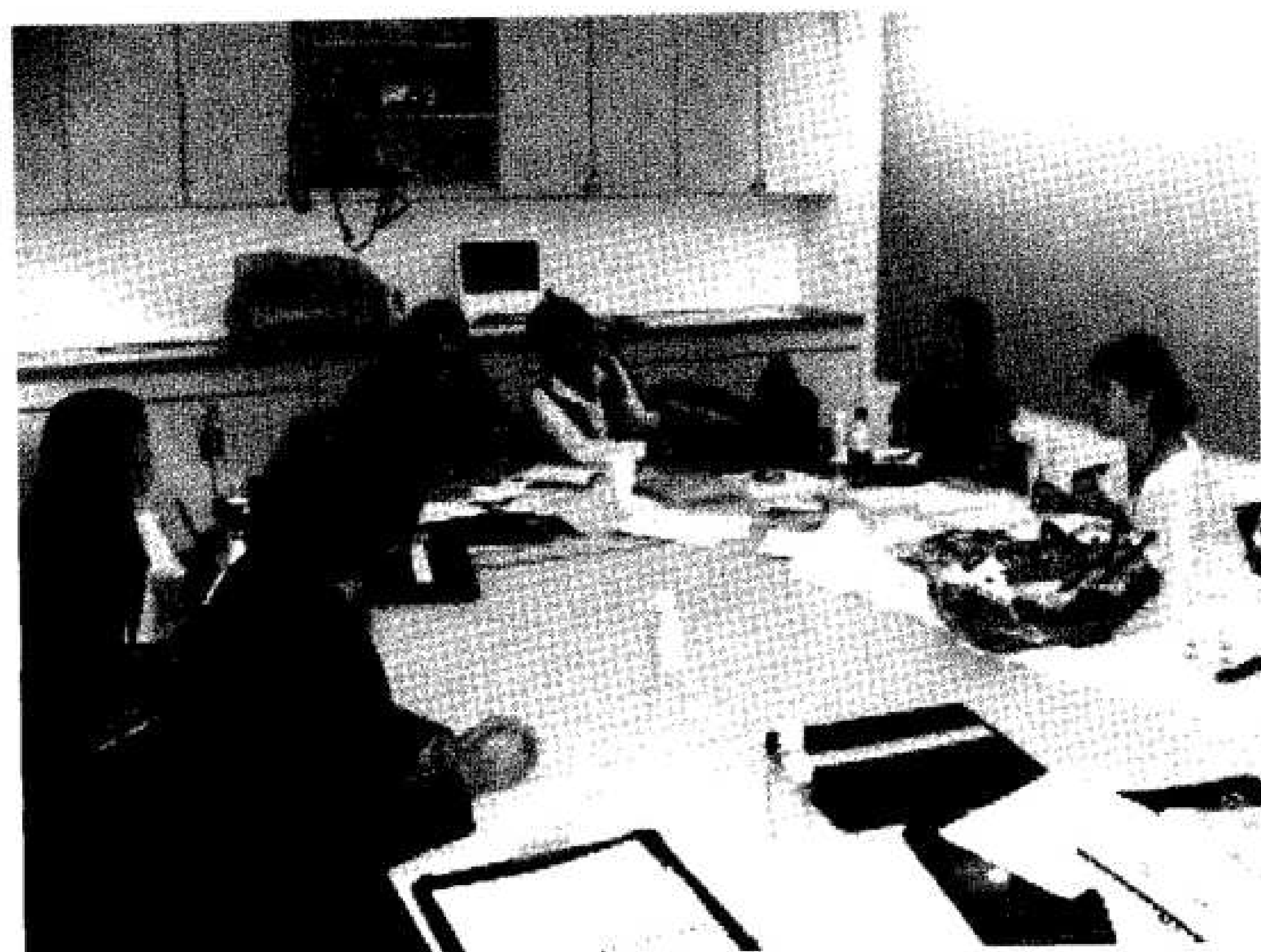
รูปที่ ๙ อธิการบดีมหาวิทยาลัยบูรพา และคณะฯ ประชุมเจรจากับผู้บริหารของมหาวิทยาลัยนิวยอร์ก.