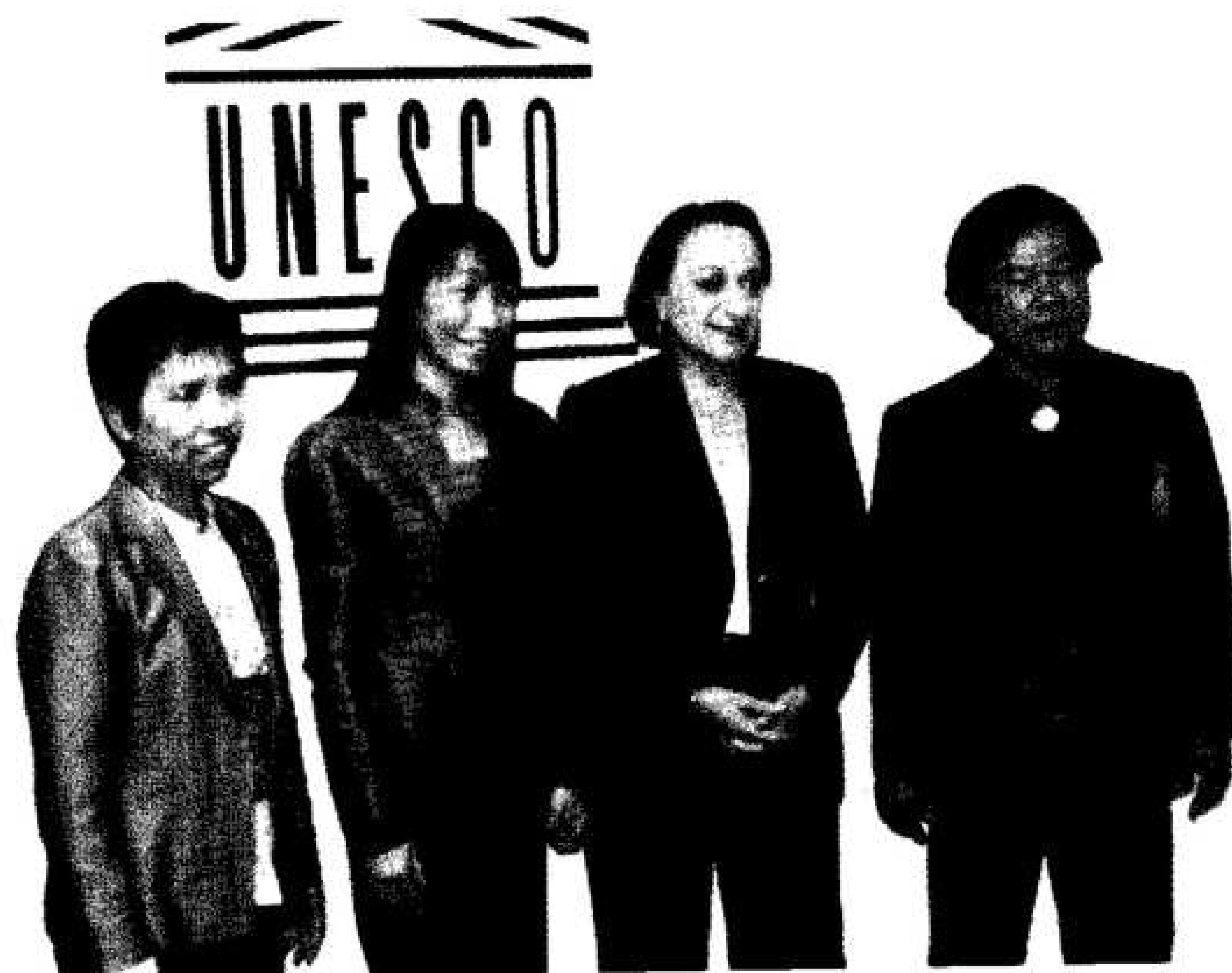
รูปที่ ๑๑ คณะศึกษาดูงานกับเลขาธิการ UNESCO, New York.