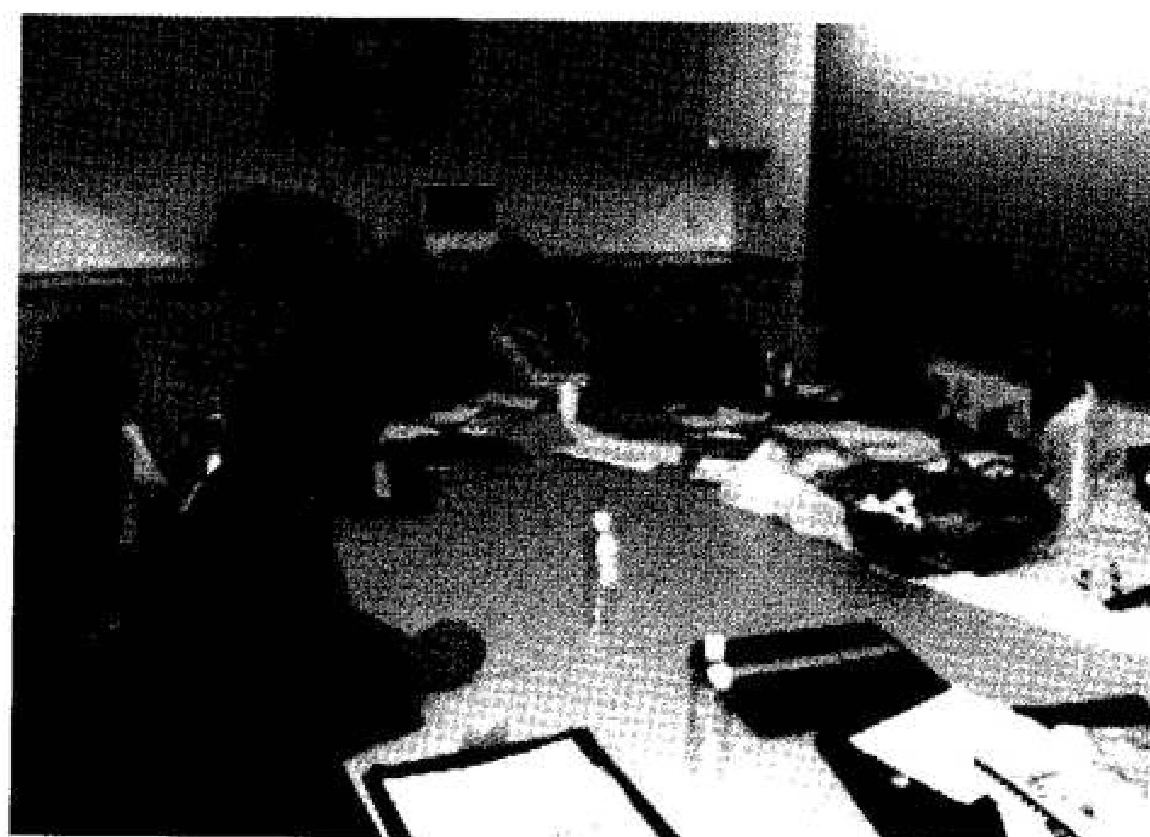
รูปที่ ๗ การประชุมวิชาการศิลปกรรมบำบัดที่ มหาวิทยาลัยนิวยอร์ก

ประเด็น และเนื้อหาสำคัญของการประชุมคือ การจัดทำหลักสูตรศิลปกรรมบำบัดและการประชุมวิชาการนานาชาติ. ระหว่างการประชุม ท่านอธิการบดี ศ. ดร. สุชาติ อุปถัมภ์ ได้ให้คำแนะนำและข้อคิดเห็นที่เป็นประโยชน์ (รูปที่ ๗).