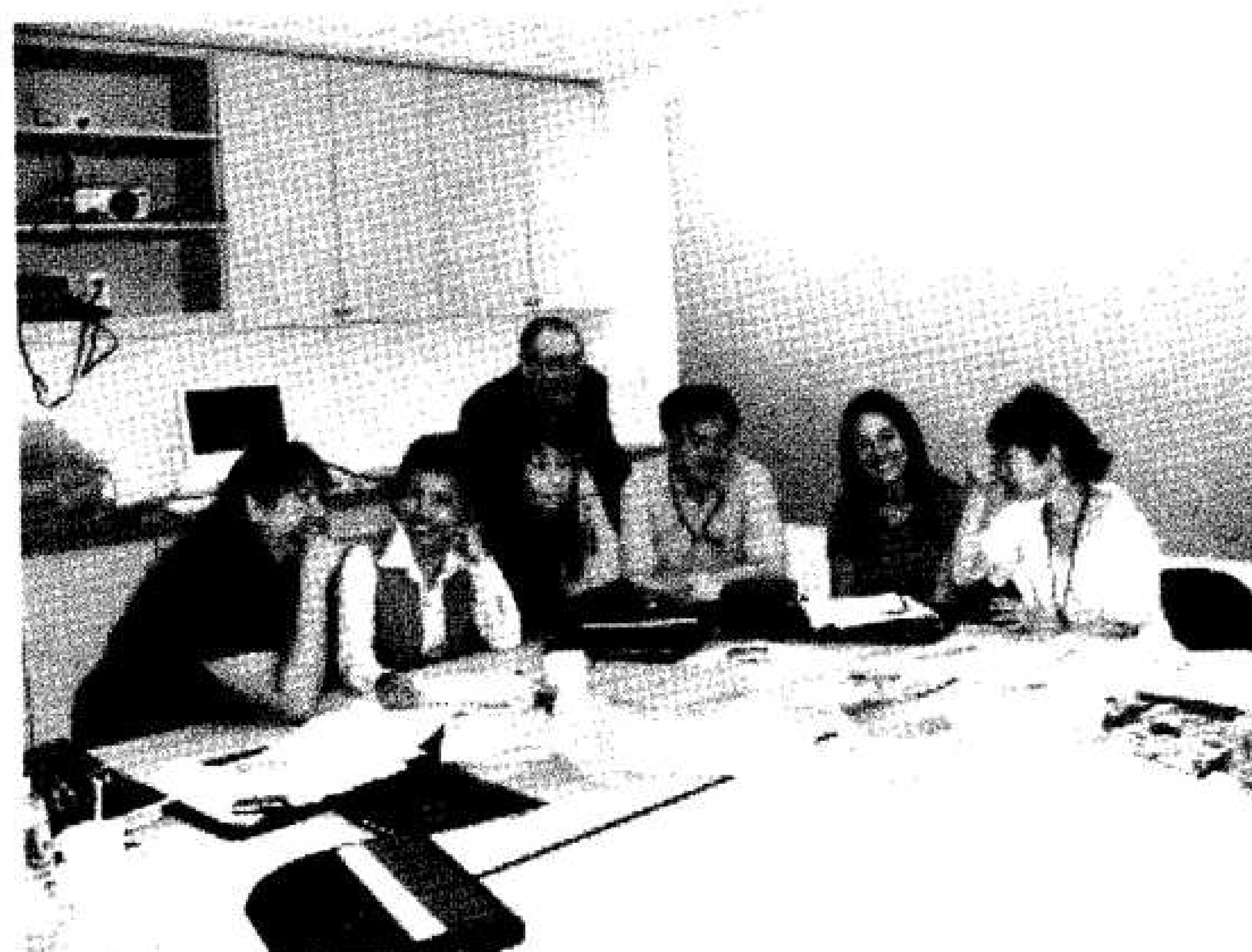
รูปที่ ๑๒ บรรยาภาศการประชุมวางแผนดำเนินงานศิลปกรรมบำบัดและร่างหลักสูตรนานาชาติ.