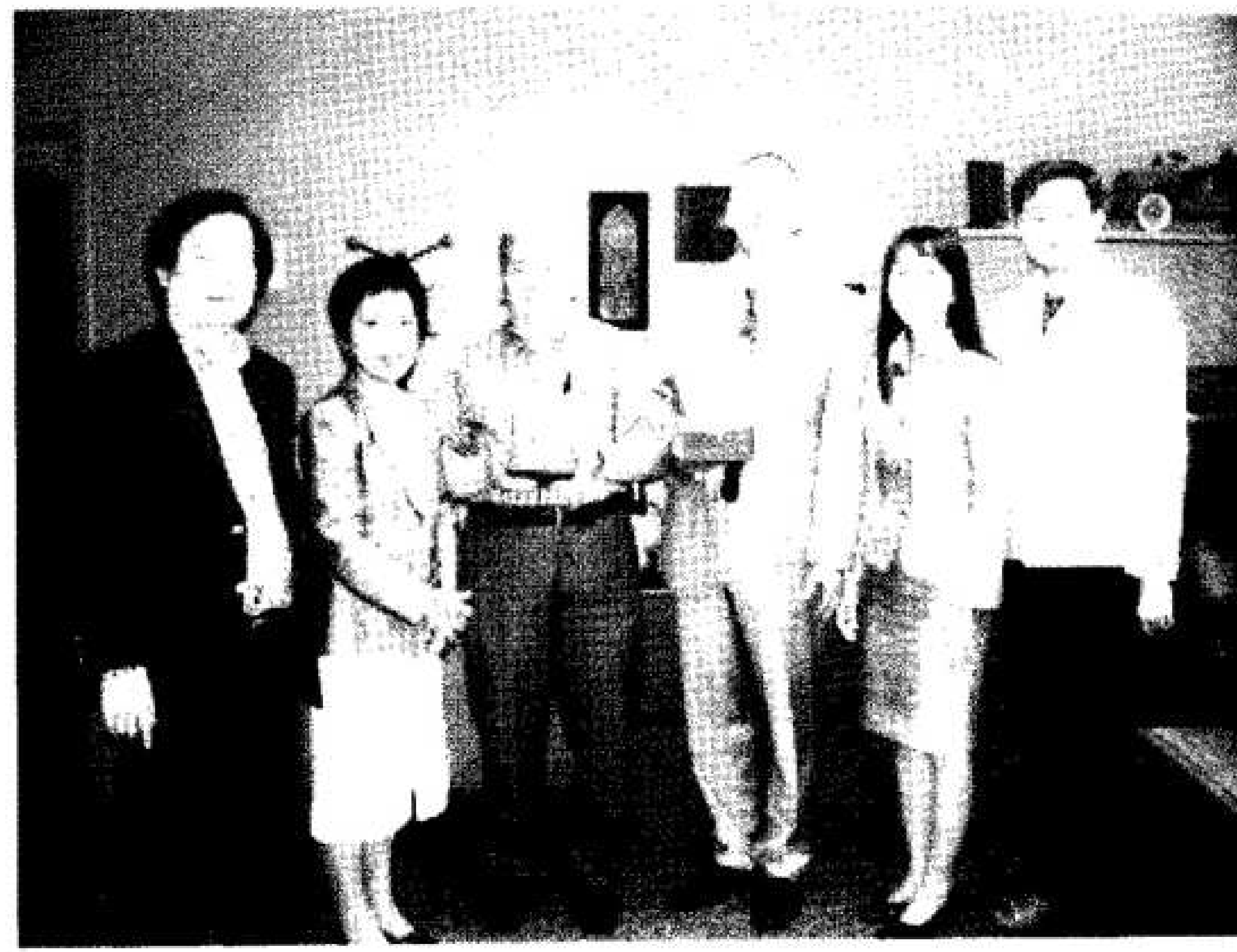
รูปที่ ๔ คณะกรรมการโครงการฯ กับอธิการบดีและรองอธิการบดีฝ่ายวิชาการของ Adler School of Professional Psychology