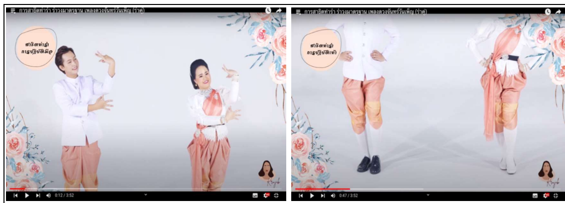
ภาพที่ 1 ตัวอย่างสื่อวีดิทัศน์ ชุดที่ 1 การสาธิตทำรำวงมาตรฐาน เพลง ดวงจันทร์วันเพ็ญ (รำคู่)

ผลการพัฒนาการจัดการเรียนรู้แบบร่วมมือ STAD โดยใช้วีดิทัศน์เป็นสื่อหลัก เพื่อพัฒนาทักษะการร่วมนำมาตรฐาน สำหรับนักเรียนชั้นมัธยมศึกษาปีที่ 2 เป็นลักษณะการเรียนรู้ในชั้นเรียนแบบปกติ ด้วยการใช้สื่อวีดิทัศน์ โดยนำไปใช้ประกอบการเรียนการสอนรายวิชานาฏศิลป์ เรื่อง รำวงมาตรฐาน รูปแบบสาธิต มีการนำเสนอในรูปแบบวีดิทัศน์ด้วยการบันทึกภาพเคลื่อนไหว เสียงบรรยาย และเสียงดนตรีผสมผสานเข้าด้วยกันเป็นเรื่องราวบันทึกและเผยแพร่ในช่องออนไลน์ต่าง ๆ สามารถเข้าเรียนใน YouTube ช่อง JubJib Channel ผู้วิจัยดำเนินและได้ผลการวิจัย ดังนี้ 1) ผลการวิเคราะห์หลักสูตรแกนกลางการศึกษาขั้นพื้นฐาน พุทธศักราช 2551 และหลักสูตรสถานศึกษาโรงเรียนโยธินบูรณะ กลุ่มสาระการเรียนรู้ศิลปะ วิชานาฏศิลป์ พบว่า เนื้อหาในหน่วยการเรียนรู้สามารถจัดทำสื่อวีดิทัศน์ได้ 4 ชุด ประกอบด้วย ชุดที่ 1 การสาธิตทำรำวงมาตรฐาน (รำคู่) มีทั้งหมด 10 เพลง ชุดที่ 2 การสาธิตทำรำวงมาตรฐาน (รำรวม) มีทั้งหมด 10 เพลง (แบบต่อเนื่อง) ชุดที่ 3 เครื่องแต่งกายของรำวงมาตรฐาน ประกอบด้วย 4 แบบ และชุดที่ 4 ดนตรีและเพลงที่ใช้ประกอบการแสดงรำวงมาตรฐาน มีทั้งหมด 10 เพลง โดยแต่ละชุดประกอบด้วย ภาพเคลื่อนไหวและเนื้อร้องทำนองเพลงรำวงมาตรฐาน 2) ผลการประเมินคุณภาพโดยผู้เชี่ยวชาญ 5 ท่าน พบว่า สื่อวีดิทัศน์ทั้ง 4 ชุด มีระดับคะแนนคุณภาพอยู่ในระดับคุณภาพดีมาก ( \bar{X} = 4.51 , S.D. = 0.90) แปลว่า สามารถใช้งานได้จริง จากนั้นทำการแก้ไข ปรับปรุงตามข้อเสนอแนะ