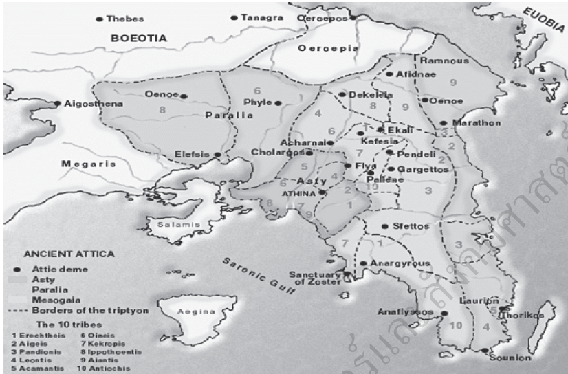
ภาพที่ 1 การจัดแบ่งหน่วยติมตามเขตภูมิภาคใหญ่ทั้งสามในเอเธนส์

เมื่อสร้างหน่วยการเมืองแรกเริ่มหรือติมเป็นผลสำเร็จพร้อมทั้งปฏิรูปการศาลแล้ว ในลำดับต่อมาไคสธีเนสได้รวมติมทั้งหมดจัดตั้งขึ้นเป็นกลุ่มหรือทริตไทส์ [Trittyes] ซึ่งในภาษกรีก หมายถึง จำนวนสามสิบ โดยแบ่งออกทั้งสิ้นเป็นจำนวน 30 กลุ่ม จากติมทั้งสามภูมิภาคใหญ่ คือ ภูเขา ที่ราบ และชายฝั่ง การที่เขาขยายโครงสร้างใหญ่เป็นสามสิบกลุ่มก็เพื่อให้ง่ายต่อการปกครองในแต่ละแห่งและยังเป็นการคานอำนาจระหว่างกลุ่มภูมิภาคทั้งสามด้วย ต่อมาไคสธีเนสนำทริตไทส์ทั้งสามสิบกลุ่มเข้าสู่หน่วยการปกครองที่ใหญ่ขึ้นอีกซึ่งเรียกว่า เผ่า (Tribe) หรือ phyle ในภาษกรีกซึ่งมีทั้งสิ้นสิบเผ่า โดยแต่ละเผ่าจะประกอบด้วย 3 ทริตไทส์ซึ่งเป็นการผสมผสานระหว่างทั้งสามภูมิภาคอันประกอบไปด้วยทริตไทส์ของชายฝั่ง ที่ราบ และภูเขา (Bury, 1922, p. 53-55) ทั้งนี้เพื่อเป็นการสร้างความสามัคคีและไม่เป็นการสร้างสมอำนาจให้กับตระกูลใดตระกูลหนึ่ง