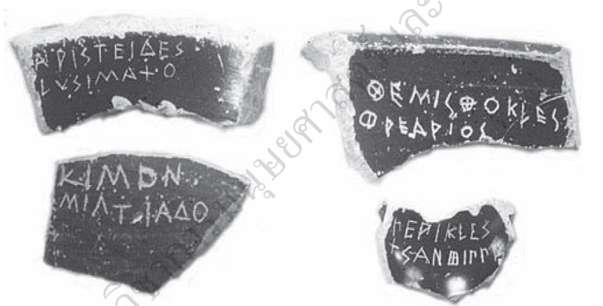
ภาพที่ 4 เศษชิ้นส่วนกระเบื้องที่จารึกรายชื่อผู้ที่ถูกขับออกจากเอเธนส์

อย่างไรก็ตาม บ่อยครั้งที่ผู้ถูกเนรเทศจากระบบมาตราชระเบียงแตกนั้นก็มีโอกาสกลับเข้ามารับใช้ยังเอเธนส์ได้ก่อนกำหนดหากเกิดกรณีฉุกเฉินเกี่ยวกับความมั่นคงทางการเมืองของรัฐ สภาเอ็คคลีเซียอาจมีมติเรียกให้ผู้ที่ถูกเนรเทศคนนั้นกลับก่อนกำหนดเวลาได้ ดังเช่น สมัยวิกฤตการณ์สงครามระหว่างกรีกกับเปอร์เซีย ที่ประชุมสภามีมตินิรโทษกรรมให้กับอริสโตเดสรวมทั้งซิมอน (Ehrenberg, 1968, p. 181) ให้กลับมาเพื่อกู่วิกฤตการณ์ในช่วงเวลาดังกล่าว