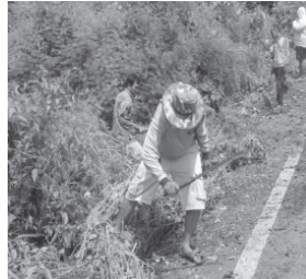
(ข) การปลูกต้นไม้ตามไหล่เขา รอบแนวป่าบ้านห้วยเรียน