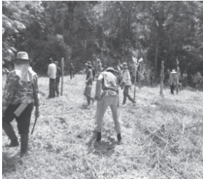
(ก) การปลูกต้นกล้วย บ้านปางปงปางทราย

ภายใต้ศักยภาพและบริบทของแต่ละชุมชนคือ ชุมชนบ้านปางปงปางทราย เลือกลงใช้แนวทางจัดการโดยการปลูกกล้วยในพื้นที่ป่าที่ถูกทำลายและรกร้าง ชุมชนบ้านห้วยเรียนเลือกลงใช้แนวทางจัดการโดยการปลูกต้นไม้บริเวณไหล่ทาง เพื่อป้องกันการพังทลายของหน้าดินบริเวณเส้นทางรอบป่า และชุมชนบ้านแม่ตาลน้อยเลือกลงใช้แนวทางจัดการโดยให้ความรู้แก่ประชาชนเกี่ยวกับการจัดการป่าที่ถูกต้อง รวมถึงการจัดแบ่งพื้นที่ป่าชุมชนบางส่วนเพื่อทำการทดลองให้เกิดเหาะเกิดเองตามธรรมชาติโดยไม่ต้องมีการเผาป่า ซึ่งเป็นการศึกษาเปรียบเทียบกับพื้นที่ที่มีการเผาป่าเพื่อให้เหาะเจริญเติบโตตามวิถีความเชื่อแบบดั้งเดิม โดยอาศัยทุนต่าง ๆ ที่มีอยู่ในชุมชน ถึงกระนั้นภายหลังจากการดำเนินกิจกรรมในการจัดการป่า ผู้นำชุมชนจึงได้ร่วมกับคนในชุมชนดำเนินการถอดบทเรียนจากการดำเนินงานต่าง ๆ รวมถึงการร่วมกันสร้างกฎระเบียบในการควบคุมดูแล และการใช้ประโยชน์จากทรัพยากรป่าที่ตนเองได้ร่วมกันคิดและลงมือปฏิบัติ