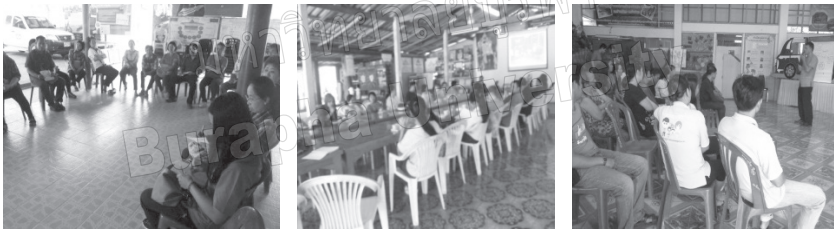
(ก) การศึกษาดูงานชุมชนต้นแบบ

การดำเนินงานดังนี้ 1) มีการจัดกิจกรรมเสริมสร้างองค์ความรู้ในการจัดการป่าต้นน้ำ แก่กลุ่มแกนนำชุมชน โดยการนำชาวบ้านศึกษาดูงานชุมชนต้นแบบที่มีการจัดการ ป่าต้นน้ำอย่างมีประสิทธิภาพและเป็นต้นแบบด้านศักยภาพของผู้นำด้วย 2) แกนนำ ชุมชนมีการประสานงานกับหน่วยงานองค์กรปกครองส่วนท้องถิ่นเพื่อระดมทรัพยากร ต่าง ๆ มาช่วย 3) มีการจัดอบรมให้ความรู้ และแนวทางในการจัดการป่าต้นน้ำที่ หลากหลาย จากบุคคลที่มีความเชี่ยวชาญ และมีตัวแบบที่สามารถมองเห็นได้อย่าง ชัดเจน และ 4) ผู้นำชุมชนมีการปรับปรุงพฤติกรรม พัฒนาศักยภาพของตนเอง อย่างต่อเนื่องและสอดคล้องกับปัญหาของชุมชนได้