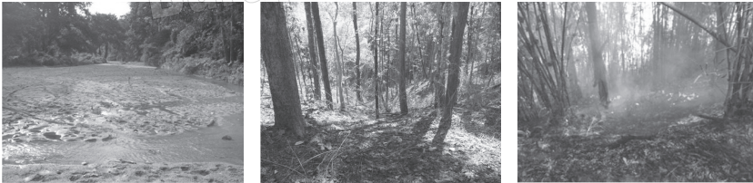
ภาพที่ 1 สภาพปัญหาเกี่ยวกับป่า

ป่าต้นน้ำแม่ตาล เป็นต้นกำเนิดของลำน้ำแม่ตาลที่ไหลผ่านชุมชนกลุ่มตัวอย่าง ได้แก่ ชุมชนบ้านปางปงทราย ชุมชนบ้านแม่ตาลน้อย และชุมชนบ้านห้วยเรียน ประชาชนเก็บหาของป่าเพื่อการยังชีพและการค้า เช่น หมูป่า ตะกวด สมุนไพรต่าง ๆ เป็นต้น อีกทั้งยังประกอบอาชีพเกษตรกรรม และการรับจ้างทั่วไป ด้านลักษณะความสัมพันธ์ของประชาชนในชุมชนเป็นไปในลักษณะของเครือญาติ มีความสัมพันธ์ที่ดีต่อกัน เกื้อกูลช่วยเหลือกันและกันผ่านระบบวัฒนธรรมประเพณีที่เกี่ยวข้องกับศาสนา รวมถึงประเพณีท้องถิ่นที่สืบทอดกันมาอย่างยาวนานระหว่าง 3 ชุมชน เช่น ประเพณีการเลี้ยงผีขุนน้ำ ซึ่งมีการทำพิธีในช่วงเดือนกรกฎาคมของทุกปี เรียกว่า เลี้ยงผีห้วยผีฮ้อง เป็นต้น