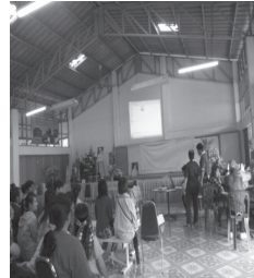
(ค) การอบรมให้ความรู้ บ้านแม่ตาลน้อย