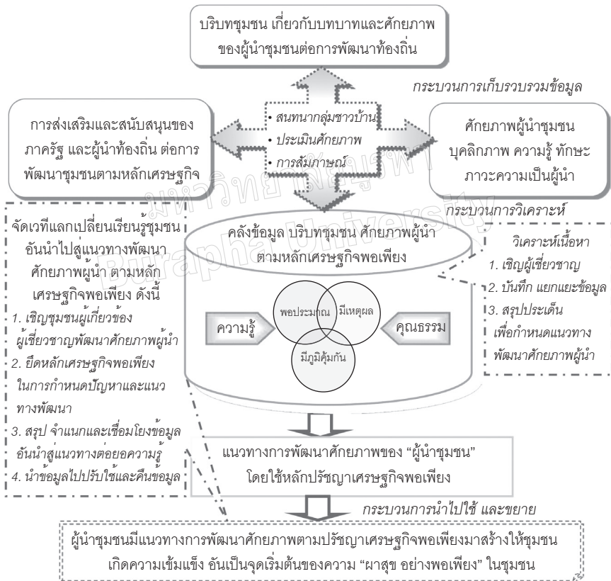
ภาพที่ 1 กระบวนการวิจัยตามกรอบและระเบียบวิธีวิจัย

ผู้วิจัยดำเนินการกำหนดระเบียบวิธีวิจัย โดยแยกตามวัตถุประสงค์การวิจัย ดังแผนภาพ 1