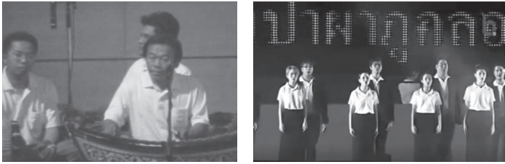
ภาพที่ 2 แสดงการแต่งกายของวงปี่พาทย์ใน ลิเกการกุศลพระมหาชนก และผู้แสดงบนเวที ใน พระมหาชนกเดอะพีโนเนอลไลฟ์โชว์

จากภาพที่ 2 จะเห็นได้ว่าผู้แสดงบนเวทีแต่งกายด้วยเสื้อผ้าเหลือง ซึ่งเป็นสีประจำวันพระราชสมภพ และประชาชนชาวไทยก็พร้อมใจกันใส่เสื้อผ้าเหลือง ในวันที่มีพระราชพิธีเกี่ยวกับพระบาทสมเด็จพระเจ้าอยู่หัวภูมิพลอดุลยเดช อาทิวรรณดลสงสิริราชสมบัติ 60 ปี วันเฉลิมพระชนมพรรษา แสดงให้เห็นความพิถีพิถันของผู้จัดการแสดงที่ต้องการให้องค์ประกอบของการแสดงสื่อการเฉลิมพระเกียรติให้มากที่สุด จากการอภิปราย จะพบว่าเรื่องเล่าจากบทพระราชนิพนธ์พระมหาชนก ปรับโครงสร้างของเรื่องเล่าให้มีลักษณะเหมือนวรรณกรรมเฉลิมพระเกียรติ กล่าวคือ มีบทประณามพจน์ การแสดงจุดมุ่งหมายว่าแต่งเพื่อเฉลิมพระเกียรติ การบรรยายพระราชกรณียกิจและบทสรุป รวมทั้งการปรับเนื้อเรื่องพระมหาชนกให้มีองค์ประกอบที่แสดงการเฉลิมพระเกียรติ ดังจะแสดงการสังเคราะห์ลักษณะความเป็นวรรณกรรมเฉลิมพระเกียรติของเรื่องเล่าจากบทพระราชนิพนธ์พระมหาชนกในรูปแบบภาพได้ดังนี้