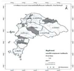
ภาพที่ 5 สาเหตุด้านค่านิยม

2. กระบวนการจัดการความขัดแย้ง โดยส่วนใหญ่พบว่า เมื่อเกิดปัญหาความขัดแย้งขึ้นแล้วผู้ที่เกี่ยวข้องจะดำเนินการแจ้งเรื่องต่อผู้ที่รับผิดชอบด้วยวาจา จากนั้นจะมีการพูดคุยกันเพื่อหาทางแก้ไขปัญหา จากผลการศึกษาพบว่า โดยส่วนใหญ่วิธีการจัดการความขัดแย้งที่ใช้มากที่สุด คือ การเจรจาต่อรอง หรือการเจรจาไกล่เกลี่ยโดยคนกลาง ซึ่งคนกลางมีทั้งที่เป็นท้องถิ่น คือ กำนัน ผู้ใหญ่บ้าน พระ/เจ้าอาวาส ผู้ใหญ่ในชุมชนที่ชาวบ้านหรือคู่ขัดแย้งให้ความเคารพหรือ เป็นเจ้าหน้าที่ของท้องถิ่น คือ ปลัดอำเภอหรือปลัดองค์กรบริหารส่วนท้องถิ่น วิธีการรองลงมา คือ การยื่นหนังสือต่อหน่วยงาน เช่น สำนักงานเขตไฟฟ้า สำนักชลประทานที่ 8 และที่ 9 กรมเจ้าท่า ที่ว่าการอำเภอ องค์การปกครองส่วนท้องถิ่น องค์การบริหารส่วนจังหวัด ชลบุรี เป็นต้น และสุดท้ายคือ การใช้สื่อสาธารณะตั้งแต่ระดับท้องถิ่น