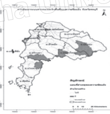
ภาพที่ 4 สาเหตุด้านโครงสร้าง