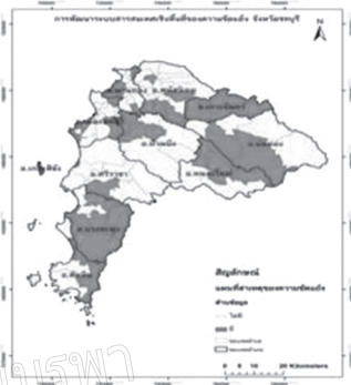
ภาพที่ 2 สาเหตุด้านข้อมูล