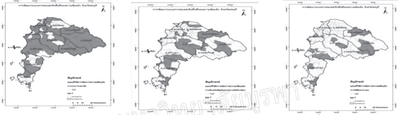
ภาพที่ 6 การกระจายไกลเกลี่ย ภาพที่ 7 การยื่นหนังสือต่อหน่วยงาน ภาพที่ 8 การใช้สื่อสาธารณะ

จากข้อมูลที่ได้ สามารถสรุปผลเป็นแผนที่สารสนเทศเชิงพื้นที่ ดังภาพที่ 6-8