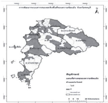
ภาพที่ 1 สาเหตุด้านผลประโยชน์

จากข้อมูลที่ได้ สามารถสรุปผลเป็นแผนที่สารสนเทศเชิงพื้นที่ ดังภาพที่ 1- 5