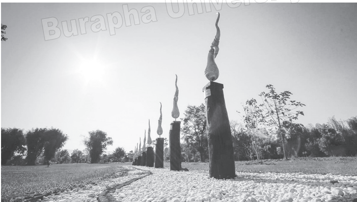
ภาพที่ 2 สัญลักษณ์ที่แสดงถึงองค์มรรคแต่ละข้อใช้ข้อฟ้าเป็นสัญลักษณ์ เพราะมรรคมืดงศ์ ๘ จัดเป็นโลกุตระธรรมอันเป็นธรรมขั้นสูงในพระพุทธศาสนา ซึ่งเป็นหนึ่งในหัวใจของการสื่อสารแนววิถีพุทธของมหาวิทยาลัยพุทธเศรษฐศาสตร์

บริเวณพื้นที่ส่วนต่าง ๆ ของมหาวิทยาลัยพุทธเศรษฐศาสตร์ยังมีการสื่อสารผ่านสัญลักษณ์ที่แสดงถึงปรีตินาธรรมที่สะท้อนถึงหลักการของมหาวิทยาลัยพุทธเศรษฐศาสตร์ โดยมุ่งไปที่เนื้อหาของหลักธรรมที่นำมาใช้เป็นแนวทางหลักการทำงานของมหาวิทยาลัยพุทธเศรษฐศาสตร์ คือ อริยสัจ 4 ประกอบด้วยทุกข์ สมุทัย นิโรธ มรรค (การค้นหา