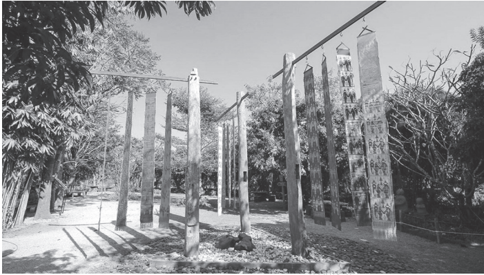
ภาพที่ 1 ศิลปกรรม 4x3=12