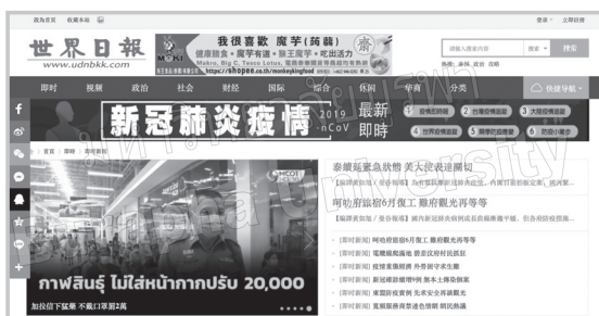
ภาพที่ 6 เว็บไซต์หนังสือพิมพ์จีน 世界日报 (Shijie Ribao)