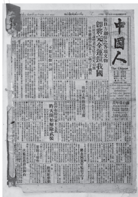
ภาพที่ 5 หนังสือพิมพ์จีน 中国人报 (Zhongguoren Bao)

หลังจากที่หนังสือพิมพ์จีน Zhenhua Bao (真话报) เกิดขึ้น ก็มีหนังสือพิมพ์จีนใต้ดินอีกหลายฉบับทยอยตามมาอย่างลับ ๆ ได้แก่ หนังสือพิมพ์จีน Fangong Bao (反攻报) หนังสือพิมพ์จีน Tongsheng Bao (同声报) หนังสือพิมพ์จีน Jing Bao (警报) หนังสือพิมพ์จีน Qingnian Bao (青年报) หนังสือพิมพ์จีน Jianguo Bao (建国报) หนังสือพิมพ์จีน Zhongguoren Bao (中国人报) และหนังสือพิมพ์จีน Chongqing Bao (重庆报) ประกอบกับช่วงเวลาดังกล่าวเป็นช่วงที่หนังสือพิมพ์จีนรายวันอยู่ในภาวะวิกฤต ถูกควบคุมจากทางรัฐบาลไทยอย่างเข้มงวด หนังสือพิมพ์จีนใต้ดินจึงเป็นสื่อสิ่งพิมพ์ที่มีบทบาทสำคัญในการเผยแพร่ข่าวสารต่อต้านกองทัพญี่ปุ่น จนกระทั่งญี่ปุ่นประกาศยอมแพ้สงครามในปี ค.ศ. 1945 ประเด็นในการนำเสนอข่าวสารของหนังสือพิมพ์จีนใต้ดินจึงได้เปลี่ยนเป็นมุ่งวิจารณ์ปัญหาของประเทศจีนเพียงอย่างเดียว และภายหลังที่หนังสือพิมพ์จีนรายวันกลับมาตีพิมพ์อีกครั้ง หนังสือพิมพ์จีนใต้ดินจึงทยอยยุติการตีพิมพ์ไป (Lin & Daogang, 2006, p. 676)