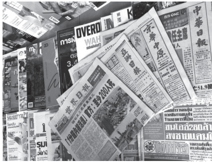
ภาพที่ 1 หนังสือพิมพ์จีน

คำว่า “หนังสือพิมพ์” ในพจนานุกรมฉบับราชบัณฑิตยสถานได้ให้ความหมายไว้ว่า หมายถึง สิ่งพิมพ์ข่าว และความเห็น เป็นต้น เสนอประชาชน ตามปกติออกเป็นรายวัน