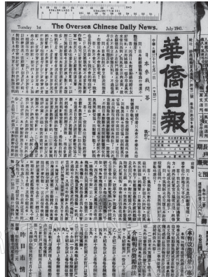
ภาพที่ 3 หนังสือพิมพ์จีน 華僑日報 (Huaqiao Ribao)

รายงานข่าวการต่อต้านกองทัพญี่ปุ่นเป็นภาษาไทยเพื่อส่งให้หนังสือพิมพ์ไทยลงตีพิมพ์ (Lin & Daogang, 2006, pp. 674-675; Lin, 2003, pp. 158-160)