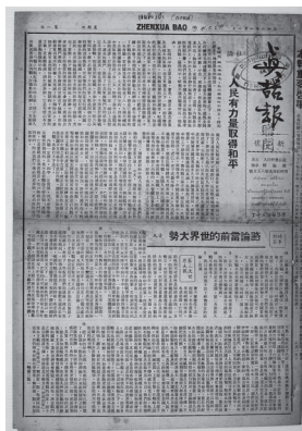
ภาพที่ 4 หนังสือพิมพ์จีน 真话报 (Zhenhua Bao)

ในปี ค.ศ. 1939 หนังสือพิมพ์จีนในประเทศไทยถูกสั่งปิดจนเกือบหมด คงเหลือเพียงหนังสือพิมพ์จีน Zhongyuan Bao (中原报) อยู่เพียงฉบับเดียว ทำให้กลุ่มยูวชนต่อต้านการรุกรานของกองทัพญี่ปุ่นในประเทศไทยจึงตีพิมพ์หนังสือพิมพ์ขนาดเล็กออกมาอย่างลับ ๆ เรียกว่า “หนังสือพิมพ์ใต้ดิน” (地下报) โดยตีพิมพ์จำหน่ายในช่วงที่ทหารญี่ปุ่นเริ่มเข้ามาในประเทศไทย ซึ่งหนังสือพิมพ์จีนใต้ดินฉบับแรกเกิดขึ้นในปี ค.ศ. 1942 มีชื่อว่า Zhenhua Bao (真话报) มุ่งนำเสนอข่าวการต่อต้านกองทัพญี่ปุ่น โดยอาศัยแหล่งข้อมูลข่าวจากผู้สื่อข่าวของกลุ่มต่อต้านกองทัพญี่ปุ่นจากทั่วทุกแห่ง และบ้างก็มาจากกลุ่มผู้อ่านที่ส่งมาให้ นอกจากนี้ ยังได้แสดงบทบาทเรียกร้องเชิญชวนให้กลุ่มชาวจีนโพ้นทะเลออกมารวมกันต่อต้านกองทัพญี่ปุ่น