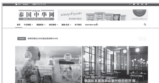
ภาพที่ 7 เว็บไซต์หนังสือพิมพ์จีน 中华日报 (Zhong Hua Ribao)

นอกจากนี้ การปรับตัวให้ทันกับเทคโนโลยีในยุคดิจิทัลที่สื่อออนไลน์กลายเป็นช่องทางหลักในการเสพข่าวสารของผู้คนในยุคปัจจุบัน แม้ว่าทุกวันนี้ยังมีหนังสือพิมพ์จีนบางฉบับที่ยังสามารถตีพิมพ์วางขายได้อยู่ ซึ่งโดยมากแล้วเป็นเพราะมีรายได้จาก