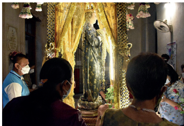
รูปสลักแม่พระไถ่ทาสของวัดคอนเซ็ปชัญ

หมายเหตุ. โดย อติวิทย์ เชียงคิ้ว, ถ่ายภาพเมื่อวันที่ 24 กันยายน พ.ศ. 2565