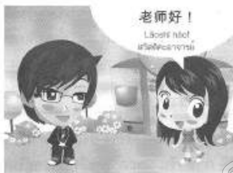
บทเรียนออนไลน์ภาษาจีน