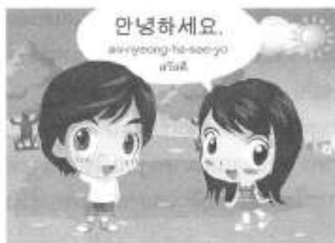
บทเรียนออนไลน์ภาษาเกาหลี

๑. ผลการสำรวจความพึงพอใจของนิสิตที่มีต่อการเรียนบทเรียนออนไลน์ภาษาเกาหลี ภาษาจีน และภาษาญี่ปุ่น พบว่า นิสิตมีความพึงพอใจบทเรียนออนไลน์ในระดับมาก ในส่วนแพลตฟอร์มนั้น นิสิตพอใจในรูปแบบสีสันสวยงาม และรู้สึกที่น่าสนใจมากที่สุด เนื่องจากในส่วนนี้เป็นการสื่อเนื้อหาของบทเรียนด้วยการใช้ภาพเคลื่อนไหว จำลองสถานการณ์เป็นฉาก ๆ ผ่านภาพการ์ตูนในลักษณะของการสนทนา ผู้เรียนได้เห็นภาพ ได้ยินเสียงภาษาเกาหลี ภาษาจีน ภาษาญี่ปุ่น และยังมีคำอธิบายภาษา เกาหลี จีน ญี่ปุ่น พร้อมคำอ่าน และคำแปลประกอบ การที่แพลตฟอร์มนี้มีรูปแบบสีสันสวยงาม น่าสนใจ คุณภาพเสียงประกอบบทเรียนชัดเจน ขนาดตัวอักษรเหมาะสม รูปแบบการใช้งานง่าย ไม่ซับซ้อน ช่วยให้ผู้เรียนเข้าใจในเนื้อหาบทเรียนมากยิ่งขึ้น ดังตัวอย่าง