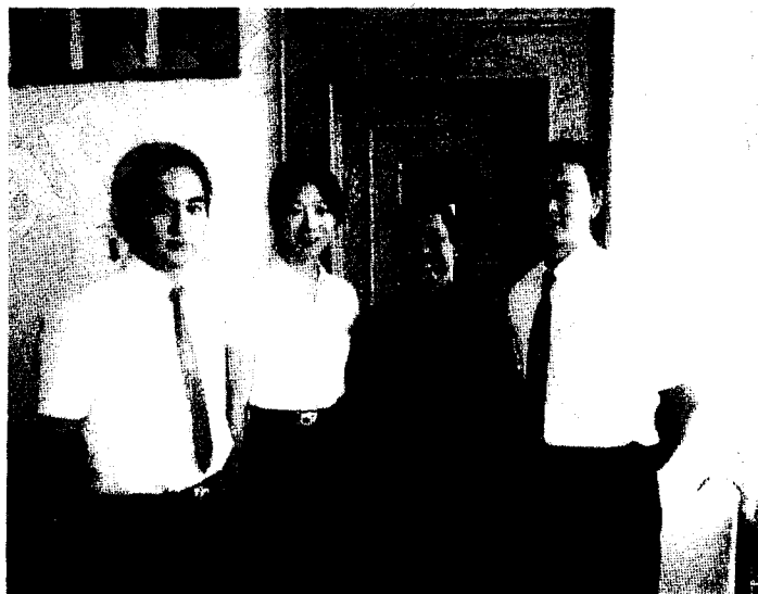
ภาพที่ ๑ การสัมภาษณ์ เรื่องการจัดประชุมทางวิชาการ เวทีวิจัยมนุษยศาสตร์และสังคมศาสตร์ ณ คณะมนุษยศาสตร์ และสังคมศาสตร์ ม.บูรพา

“ในเรื่องหลักของงานวิจัย ต้องอาศัยคน ต้องอาศัยเวลา ต้องอาศัยความอดทน ต้องอาศัย ทรัพยากรเป็นอย่างมาก”