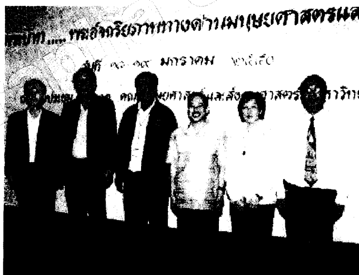
ภาพที่ ๒ คณะวิทยากรและผู้จัดงาน การเสวนาทางวิชาการ ในหัวข้อ การขับเคลื่อนเศรษฐกิจพอเพียงในภาคตะวันออก

เพื่อได้มีความหลากหลาย ในด้านของวิธีการนำเสนอ และหลากหลายในด้านของเนื้อหา ไม่ต่ำกว่า ๓๐-๔๐ สาขา ทั้งนี้ก็ได้เป็นอีกทางหนึ่งให้ผู้เชี่ยวชาญ และนักวิจัยได้เข้ามารับฟัง และผู้นำเสนอเป็นผู้ตอบ และเป็นผู้แลกเปลี่ยนข้อคิดเห็น และแรงจูงใจในการจัดงานนี้ก็ถือ การมีส่วนร่วมในการเฉลิมฉลองครองสิริราชสมบัติ ๖๐ ปี ของพระบาทสมเด็จพระเจ้าอยู่หัว และปี ๒๕๕๐ ก็เป็นปีสิริมงคลอีกปีหนึ่งที่พระองค์จะมีพระชนมายุครบ ๘๐ พรรษา เรื่องของวิสัยทัศน์ความรู้ของมหาวิทยาลัยที่ต้องการมุ่งสู่ความเป็นระดับนานาชาติ ฉะนั้นเวทีนี้จึงเป็นเวทีเบื้องต้น เพื่อจะทำให้เกิดแรงจูงใจ ที่จะจุดประกายในการสร้างนักวิจัย สร้างองค์ความรู้