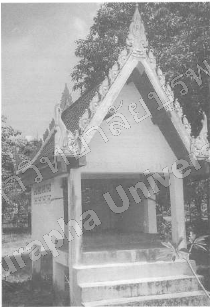
ภาพที่ ๔๔ ศาลปู่ตา บ้านเมืองกาย อ. พนมสารคาม จ. ฉะเชิงเทรา