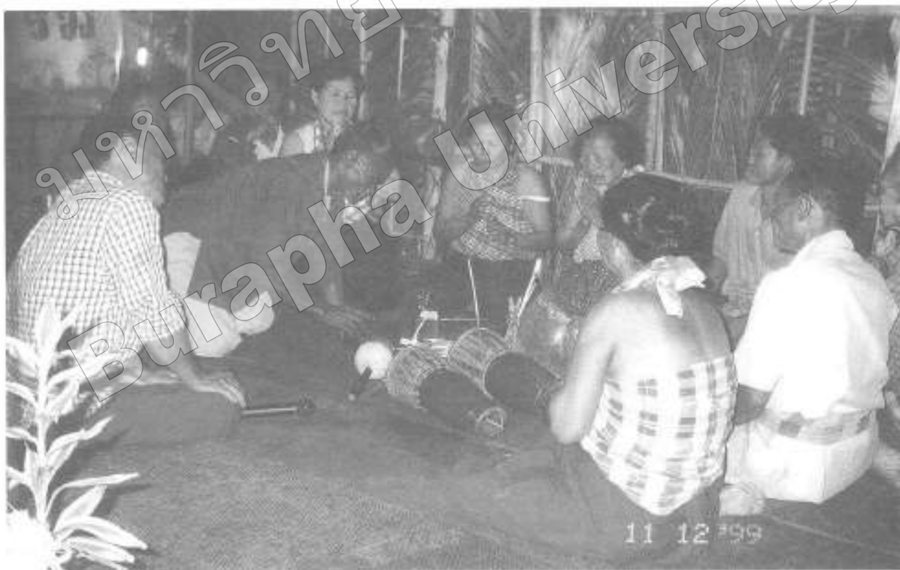
ภาพที่ ๑๖ ชาวซองไท่กรุดมตรี

แม้ว่าในปัจจุบันชาวซองจะตั้งหลักแหล่ง เป็นที่ และทำการเกษตรกรรมแทนการหาของป่าและ ล่าสัตว์แล้วก็ตาม แต่ชาวซองก็ยังนิยมเพาะปลูก เลี้ยง สัตว์ พืชอยู่พอใช้ในครัวเรือน ไม่นิยมทำให้อำนาจ ฉะนั้น ชาวไทยในที่ราบลุ่มภาคใต้จึงมักจะกล่าวว่า “ซองมีใจเอื้อเฟื้อต่อเพื่อนบ้าน ไม่รักนาความสะอาด บ้าน” ชาวซองจึงไม่นิยมที่จะติดต่อกับคนแปลกหน้า ต่างกลุ่มวัฒนธรรม