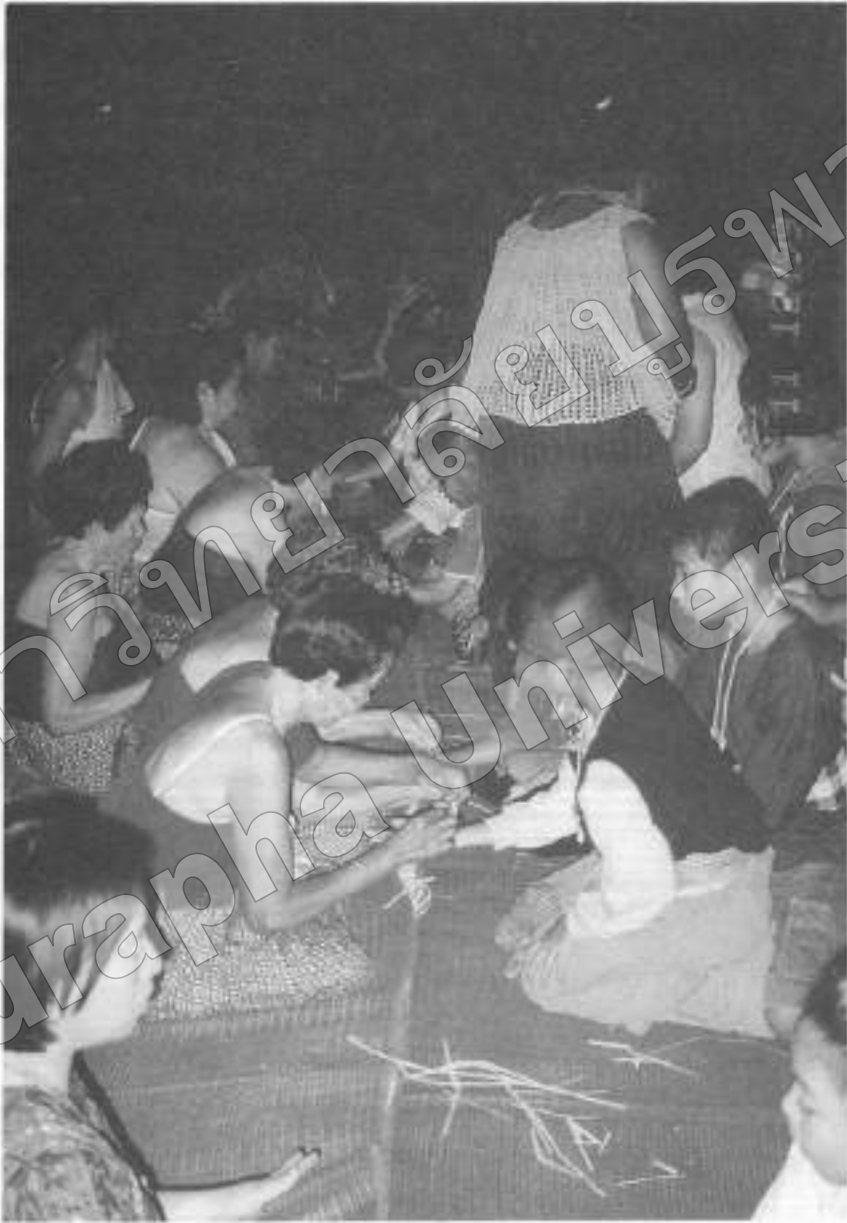
ภาพที่ ๔๗ ชาวองและพิธีกรรม