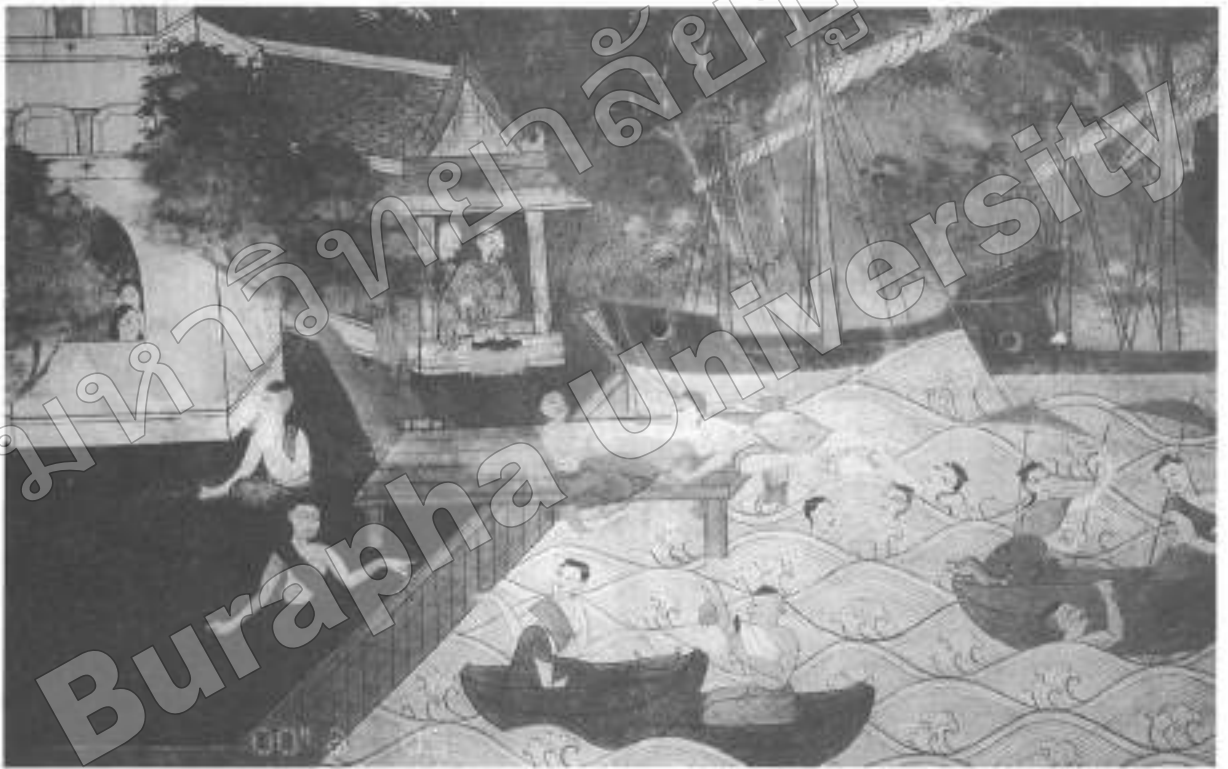
ภาพที่ ๑ ภาพชีวิตชาวตะวันออก เห็นวิถีชีวิตชาวไทยและพ่อค้าชาวจีน (จิตรกรรมฝาผนัง พระอุโบสถ วัดโฆณอินทาราม อ. เมืองฯ จ. ชลบุรี)

๒. อากรค่าน้ำ คือ ภาพเครื่องมือจับปลาที่ เรียกเก็บจากชาวประมง โดยให้นายอากรเป็นผู้จัด เก็บส่งพระคลังมหาสมบัติ ดังสารตรา ประกาศ ณ วันเสาร์ เดือน ๑๑ (แรม) ๑๑ ปีชวด จัตวา จุลศักราช ๑๒๑๔ (พ.ศ. ๒๓๕๕) (กรมพระยา