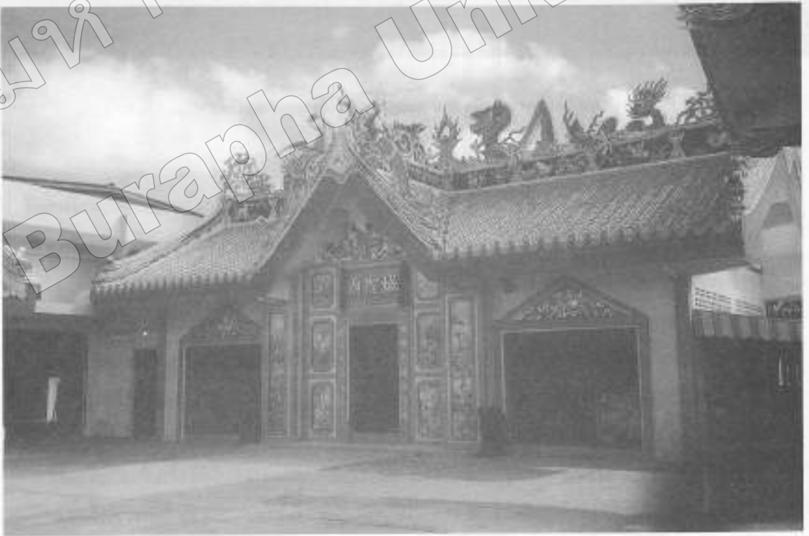
ภาพที่ ๓ ศาลหอกลเมืองขลุง อ. ขลุง จ. จันทบุรี