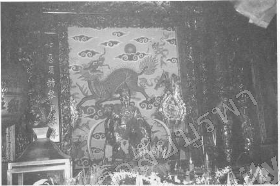
ภาพที่ ๒ ศาลหอกลเมืองจันทบุรี แสดงให้เห็นอิทธิพลวัฒนธรรมจีน