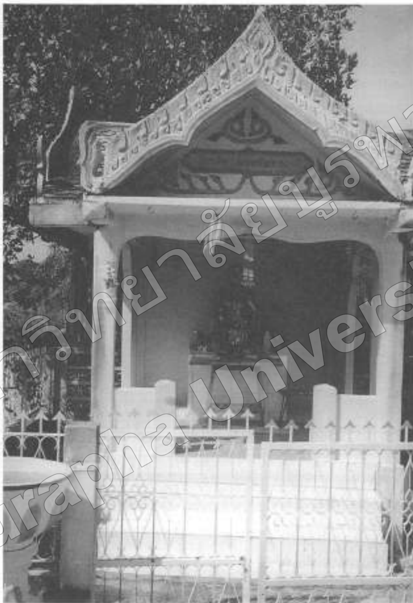
ภาพที่ ๑๕ ศาลปู่ตา บ้านห้วยขา ต. ศรีมหาโพธิ์ จ. ปราจีนบุรี