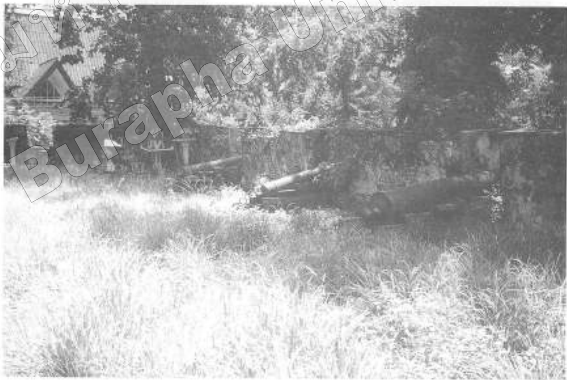
ภาพที่ ๔ ปืนใหญ่โบราณบนเชิงเขินกำแพงเมืองฉะเชิงเทรา