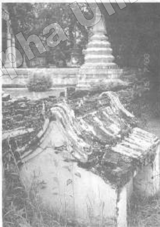
ภาพที่ ๖ วัดพื้ง บ้านบางกะจะ ชาวจีนสร้างที่เก็บอัฐิบรรพบุรุษตามสถาปัตยกรรมจีน