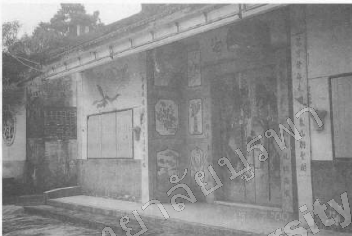
ภาพที่ ๕ ทางเข้าจีนบ้านบางกะจะ เป็นชุมชนจีนโบราณ