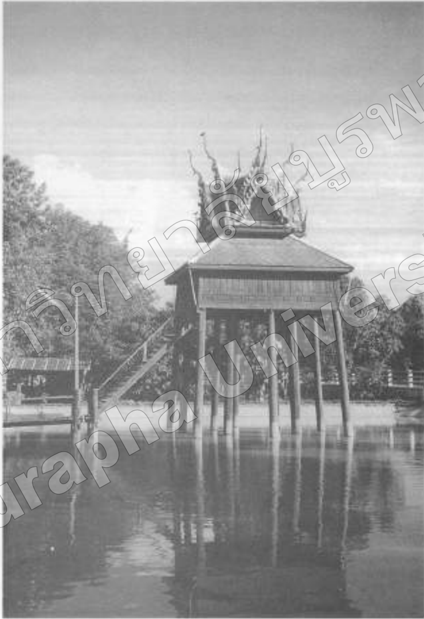
ภาพที่ ๑๒ หอไตร คือประเพณีภาคอีสาน วัดใต้ทันต อ.พนัสนิคม จ.ชลบุรี