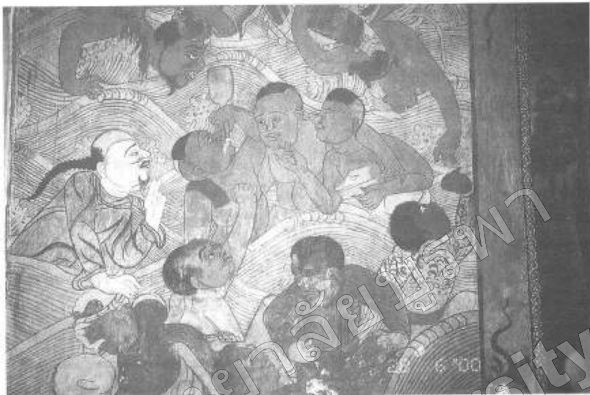
ภาพที่ ๙ จม วัฒนเปื้อน (จิตรกรรมฝาผนังพระอุโบสถ วัดใหญ่อินทาราม อ. เมืองฯ จ. ชลบุรี)