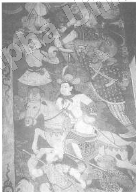
ภาพที่ ๑๐ นายทหารจีนและทหารจีน (จิตรกรรมฝาผนังพระอุโบสถ วัดใหญ่อินทาราม อ. เมืองฯ จ. ชลบุรี)