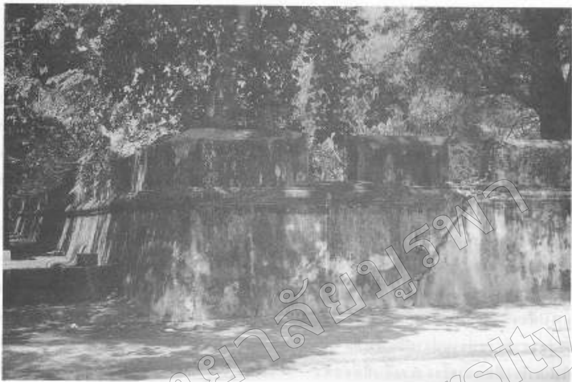
ภาพที่ ๓ กำแพงเมืองฉะเชิงเทรา กบฏหัวเมืองมอญ พ.ศ. ๒๓๐๘