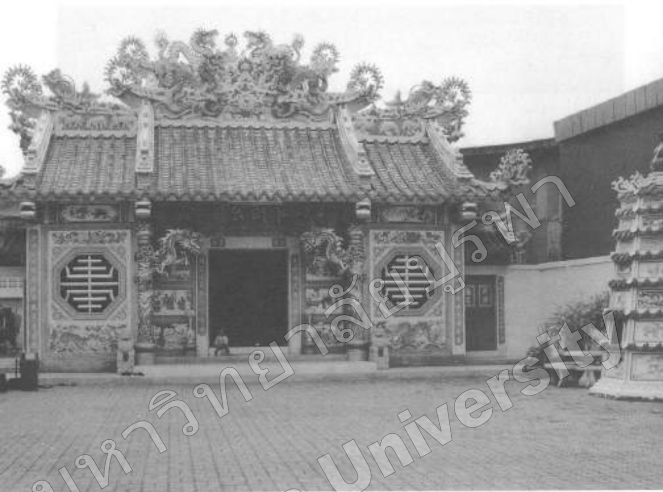
ภาพที่ ๕ ศาลเจ้าเมืองระยอง ก่อนที่จะสร้างศาลเจ้าทรงไทย

ที่หัวระกำริมบ้าน บางกะจะคบคิด กับจีนเกา อ้ายจีนช่วงเป็นตั้มเหีย จีนเกาเป็นอี่เหีย มีพวกเพื่อนเป็น มดจิ๋วประมาณ ๗๐๐ - ๘๐๐ คน ไม่ ชอบกับจีนฮกเกี้ยน ด้วยจีนฮกเกี้ยน เป็นพวกพระยาสุนทรเทรมฐี จีนช่วง จีนเกาก็ ยกเข้าตีเอาบ้านบางกะจะ ได้แล้ว ไปตีบ้านพระยาสุนทรเทรมฐี พระยาสุนทรเทรมฐีก็เกณฑ์พวกจีน