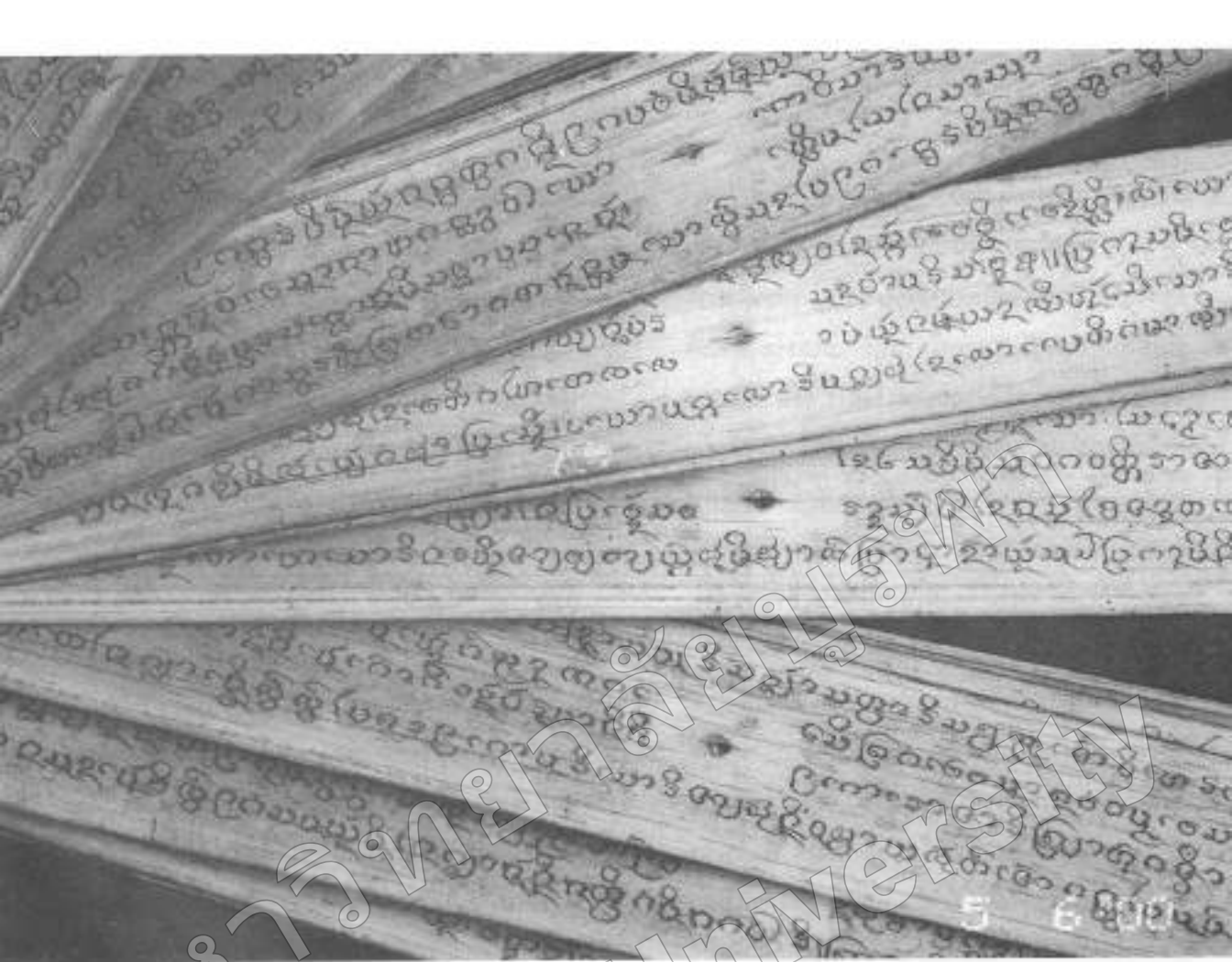
ภาพที่ ๑๓ ใบลานตัวอักษรธรรม วัดใต้ทันตาน ต.พนัสนิคม จ.ชลบุรี

พนัสนิคม จึงเข้ากราบบังคมทูลขอครอบครองเมือง นครพนมที่ได้คามกวางคัตถ์มาได้หันไปอยู่ร่วมกันที่ เมืองพนัสนิคม ก่อนถวายนครพนมพากันไปตั้งหลัก แห่งความดีกลางท้องฟ้าแดด และมักจะตั้งชื่อบ้านคาม