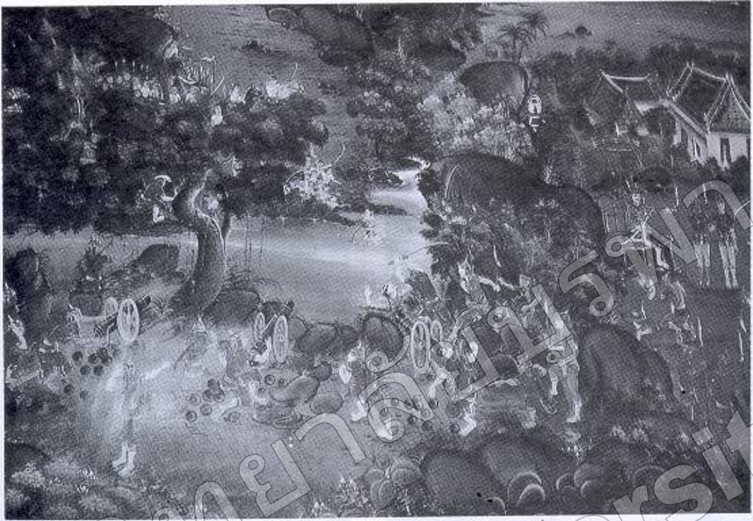
ภาพที่ ๔ ต่อกู้กับกองทัพพม่าที่ปากน้ำเจ้าโล้ (จิตรกรรมฝาผนังวิหารพระพุทธบาท วัดใหญ่อินทาราม อ.เมืองฯ จ. ชลบุรี)