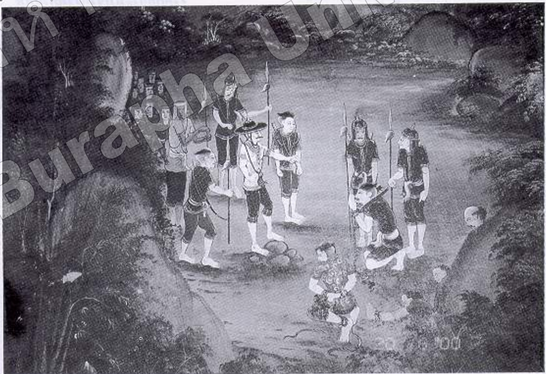
ภาพที่ ๑๗ ตั้งประหารเจ้าเมืองชลบุรี และหลวงพล กับขุนอินเชียง (จิตรกรรมฝาผนังวิหารพระพุทธบาท วัดใหญ่อินทาราม อ. เมืองฯ จ. ชลบุรี)