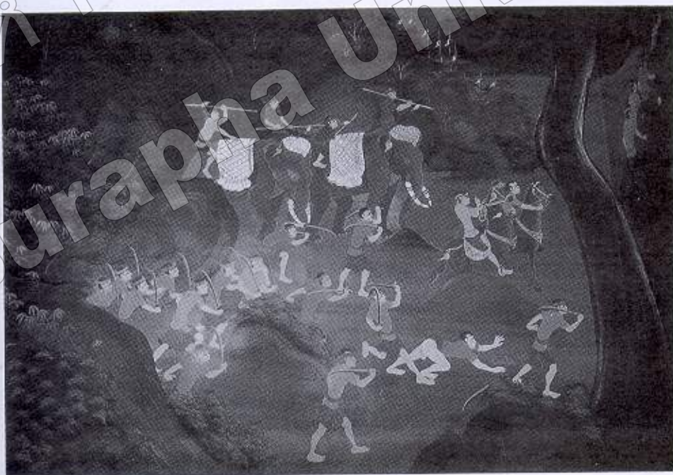
ภาพที่ ๑๑ ยกกำลังปราบปรามขุนรามหมื่นช่อง (จิตรกรรมฝาผนังวิหารพระพุทธบาท วัดใหญ่อินทาราม อ. เมืองฯ จ. ชลบุรี)