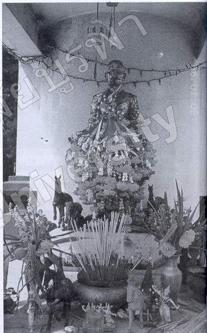
ภาพที่ ๖ ศาลสมเด็จพระเจ้าตากสินมหาราช บริเวณ ตลาดอำเภอบางกั้ว