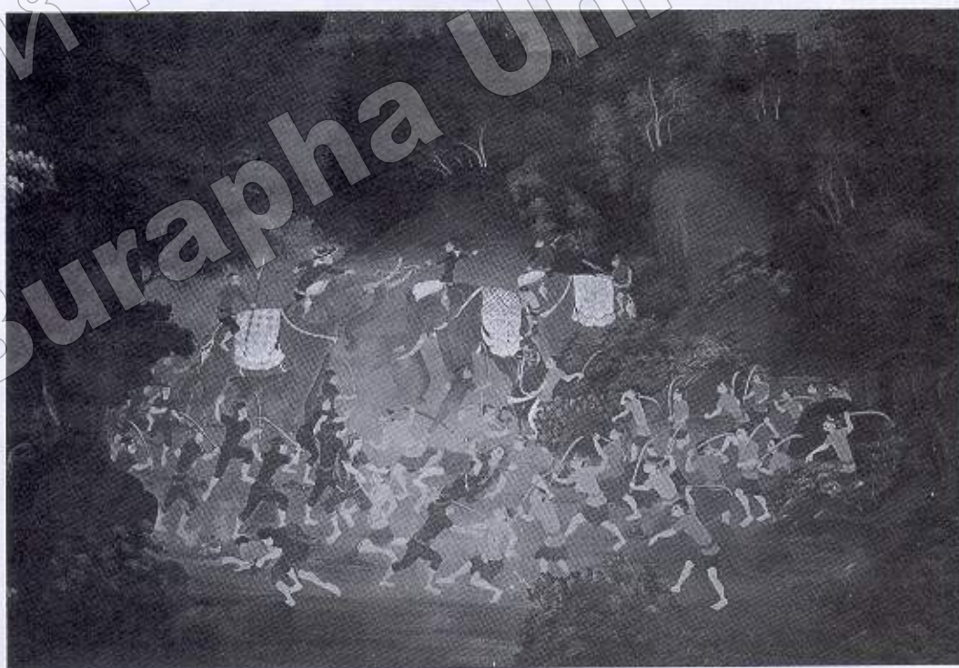
ภาพที่ ๓ กองกำลังพระยากำแพงเพชรเข้ายึดบ้านกง (จิตรกรรมฝาผนัง วิหารพระพุทธรบาท วัดใหญ่อินทาราม อ.เมืองฯ จ.ชลบุรี)