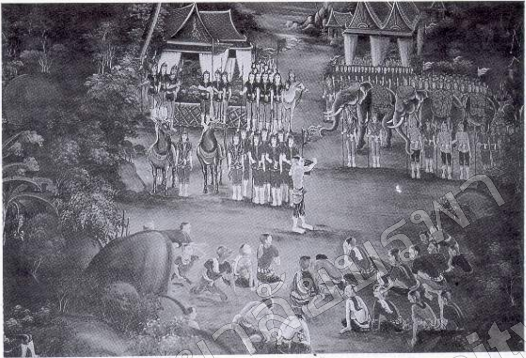
ภาพที่ ๑๖ ประกาศแจ้งความผิดเจ้าเมืองชลบุรี (จิตรกรรมฝาผนังวิหารพระพุทธบาท วัดใหญ่อินทาราม อ. เมืองฯ จ. ชลบุรี)