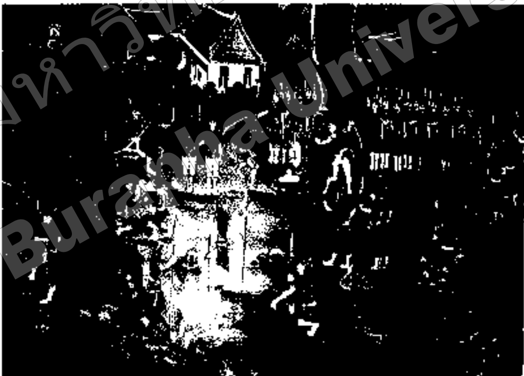
ภาพที่ ๑๒ ประหารนกเอี้ยงทั้ง (จิตรกรรมฝาผนังวิหารพระพุทธบาท วัดใหญ่อินทาราม อ.เมืองฯ จ. ชลบุรี)