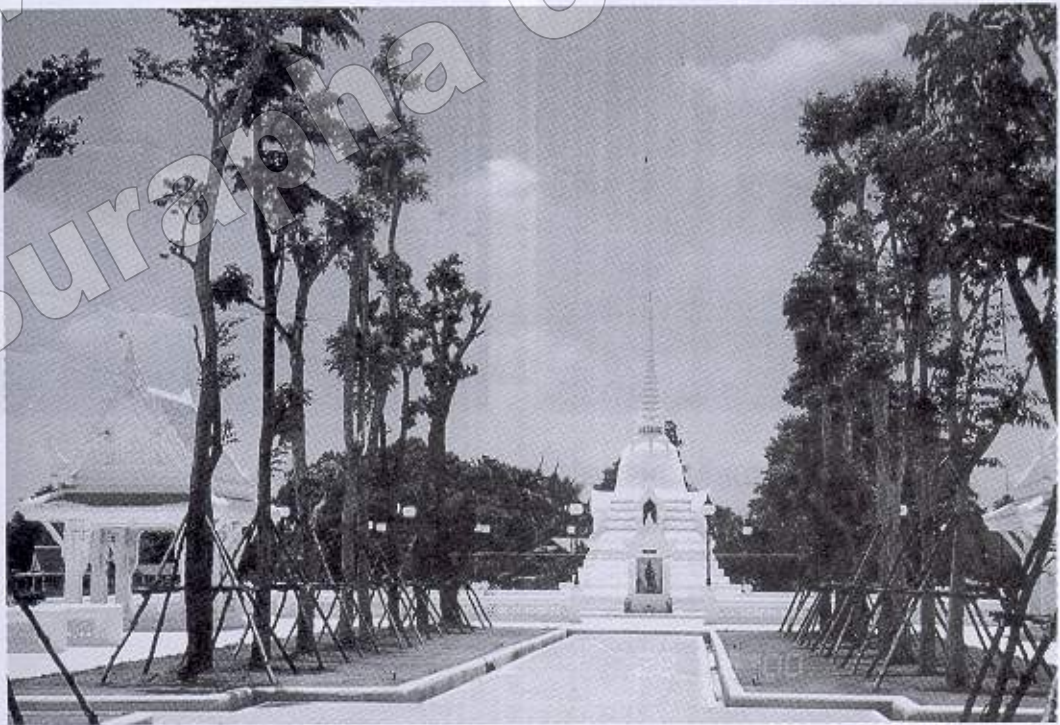
ภาพที่ ๕ อนุสรณ์สถานปากน้ำเจ้าโล้ อ. บางคล้า จ. ฉะเชิงเทรา