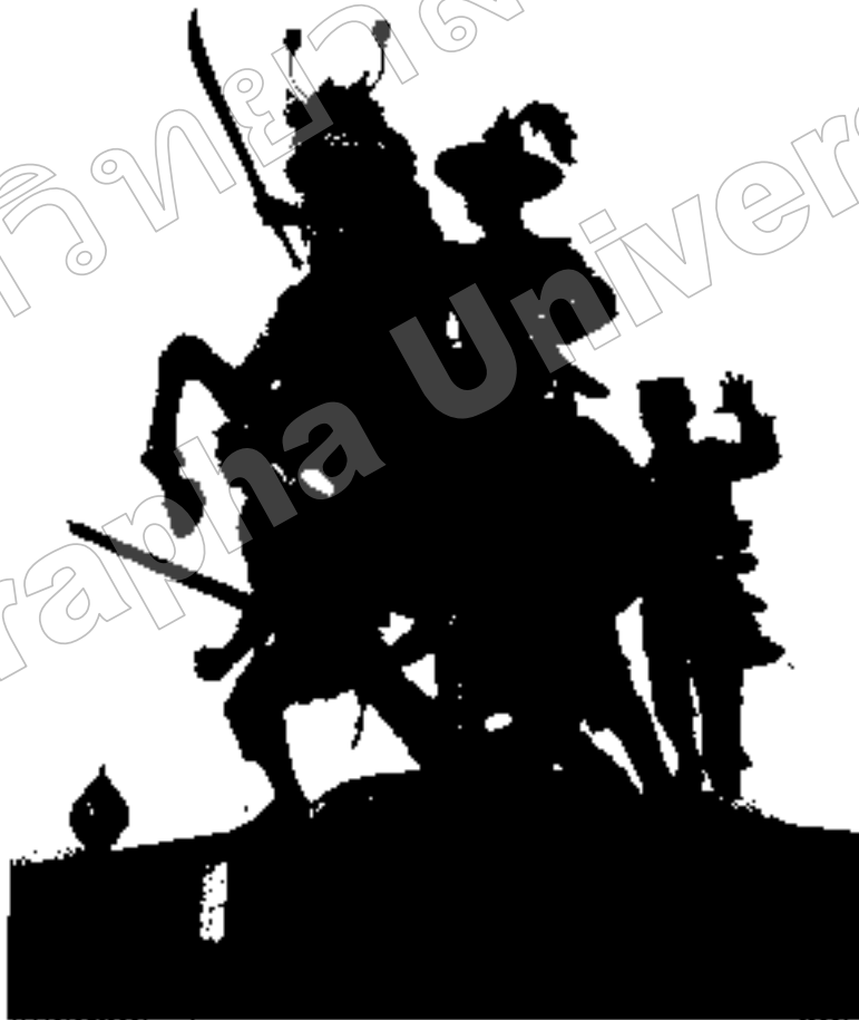
ภาพที่ ๑ พระบรมราชานุสาวรีย์สมเด็จพระเจ้าตากสินมหาราช จังหวัดฉะเชิงเทรา