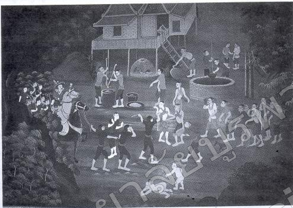
ภาพที่ ๑๐ เกลี้ยกล่อมขานนิกนคามชนบท (จิตรกรรมฝาผนังวิหารพระพุทธบาท วัดใหญ่อินทาราม อ. เมืองฯ จ. ชลบุรี)