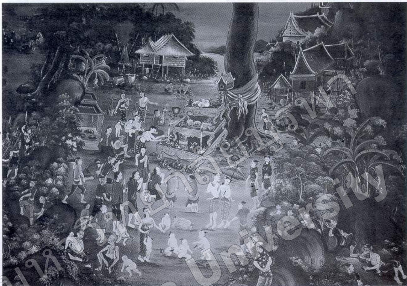
ภาพที่ ๑๓ ชาวบ้านตั้งศาลเพียงตา (จิตรกรรมฝาผนังวิหารพระพุทธบาท วัดใหญ่อินทาราม อ. เมืองฯ จ. ชลบุรี)