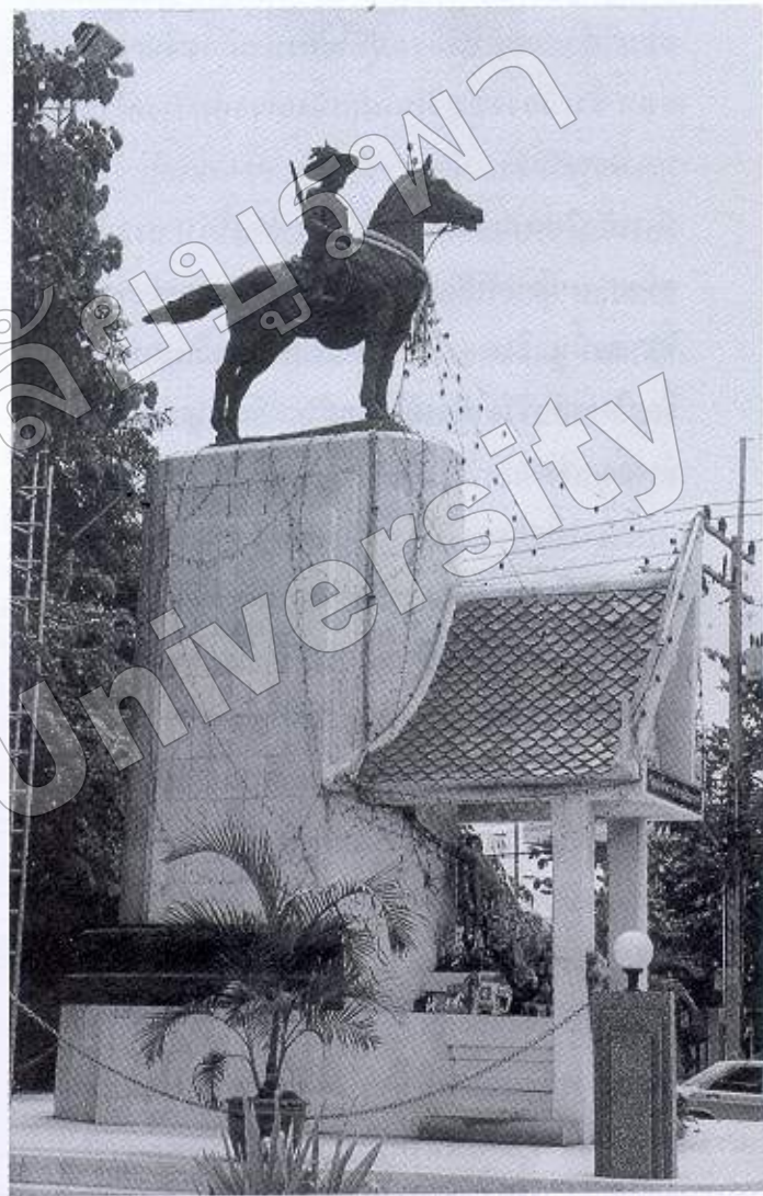
ภาพที่ ๗ พระบรมราชานุสาวรีย์สมเด็จพระเจ้าตากสิน มหาราช อ. บางคล้า