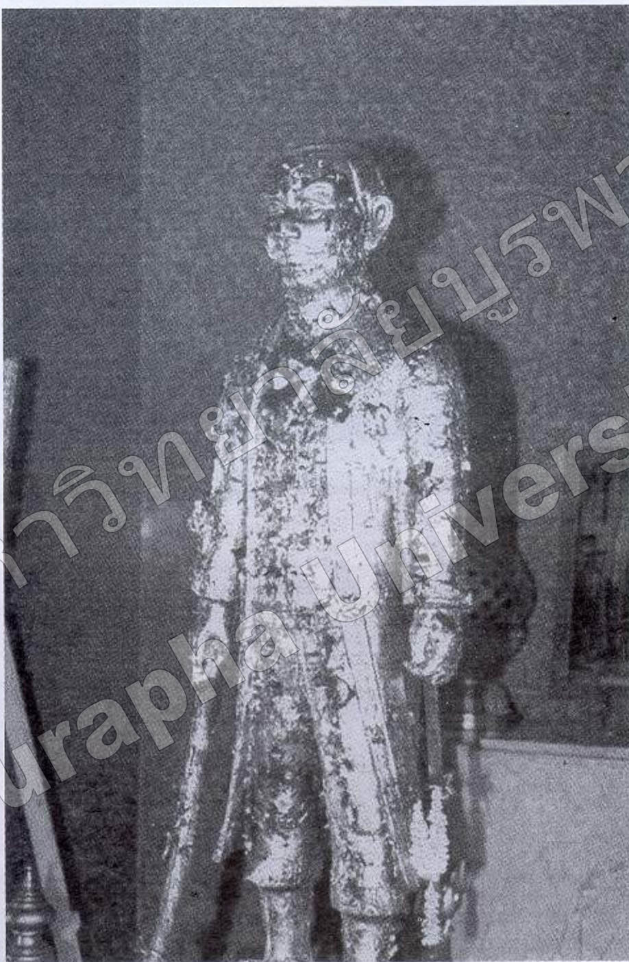
ภาพที่ ๘ พระบรมรูปสมเด็จพระเจ้าตากสินมหาราช ในศาลวัดถุ่มชัยชุมพล อ. เมืองฯ จ.ระยอง