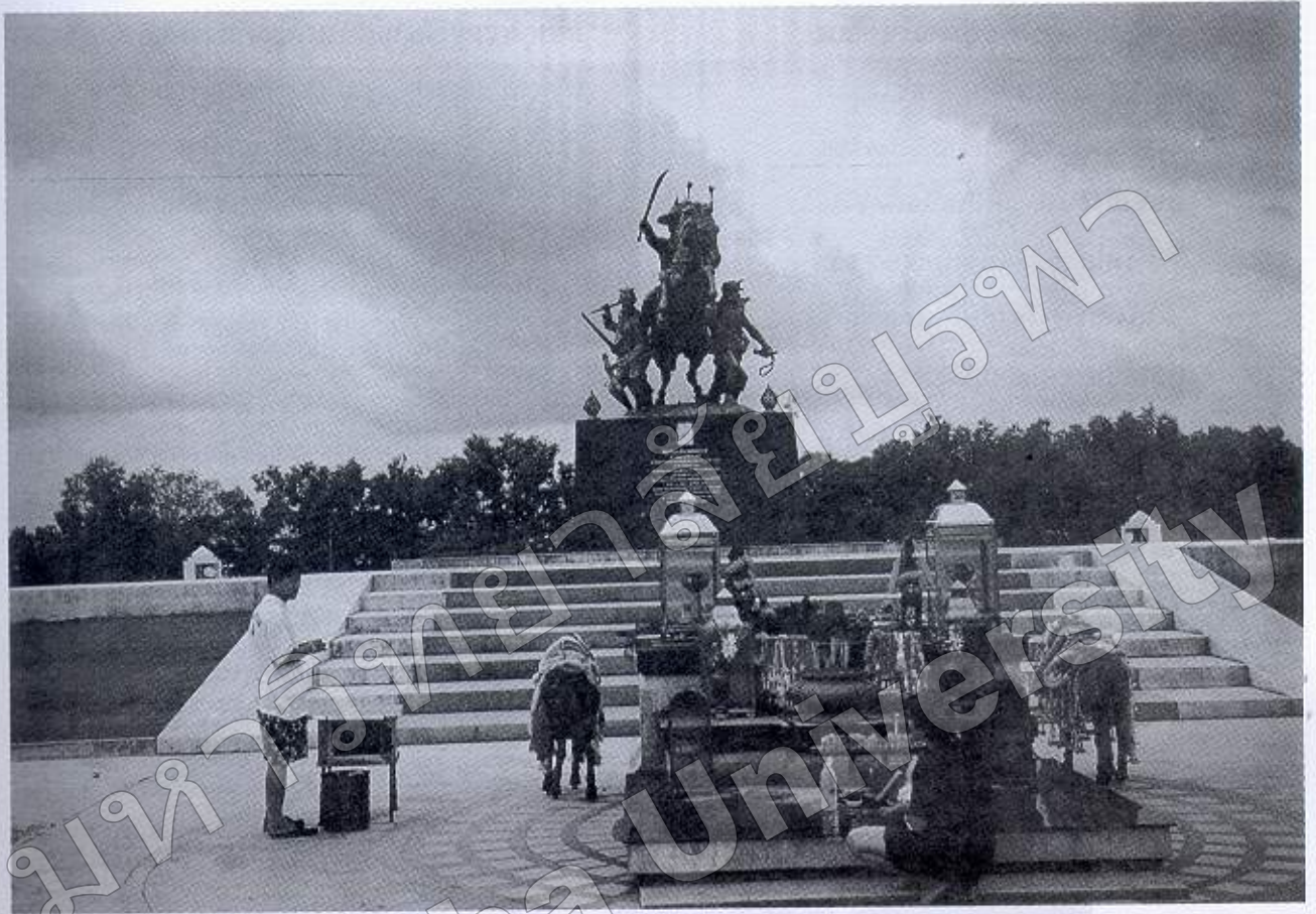
ภาพที่ ๑๕ อานุสรณสถานทุ่งศรีเมือง จ. จันทบุรี

๒. สังกตมาเชิญเสด็จเข้าเมืองจันทบูร พระยาจันทบูรเห็นกองทัพพระยากำแพงเพชร (พระเจ้าตากสินมหาราช) ตั้งค่ายอยู่ริมเมืองที่ตำบลวัดแก้ว แก่งทำเป็นไขสือในเหตุการณ์ข้างต้น จึงได้ส่งขุน พรหมธิบาลกับพระธำมรงค์ (พอน) เป็นหัวหน้ามา เชิญเข้าเมือง แต่พระยากำแพงเพชรไม่ได้ไว้วางใจใน สถานการณ์ดังกล่าว เพราะเห็นทหารเมืองจันทบูร