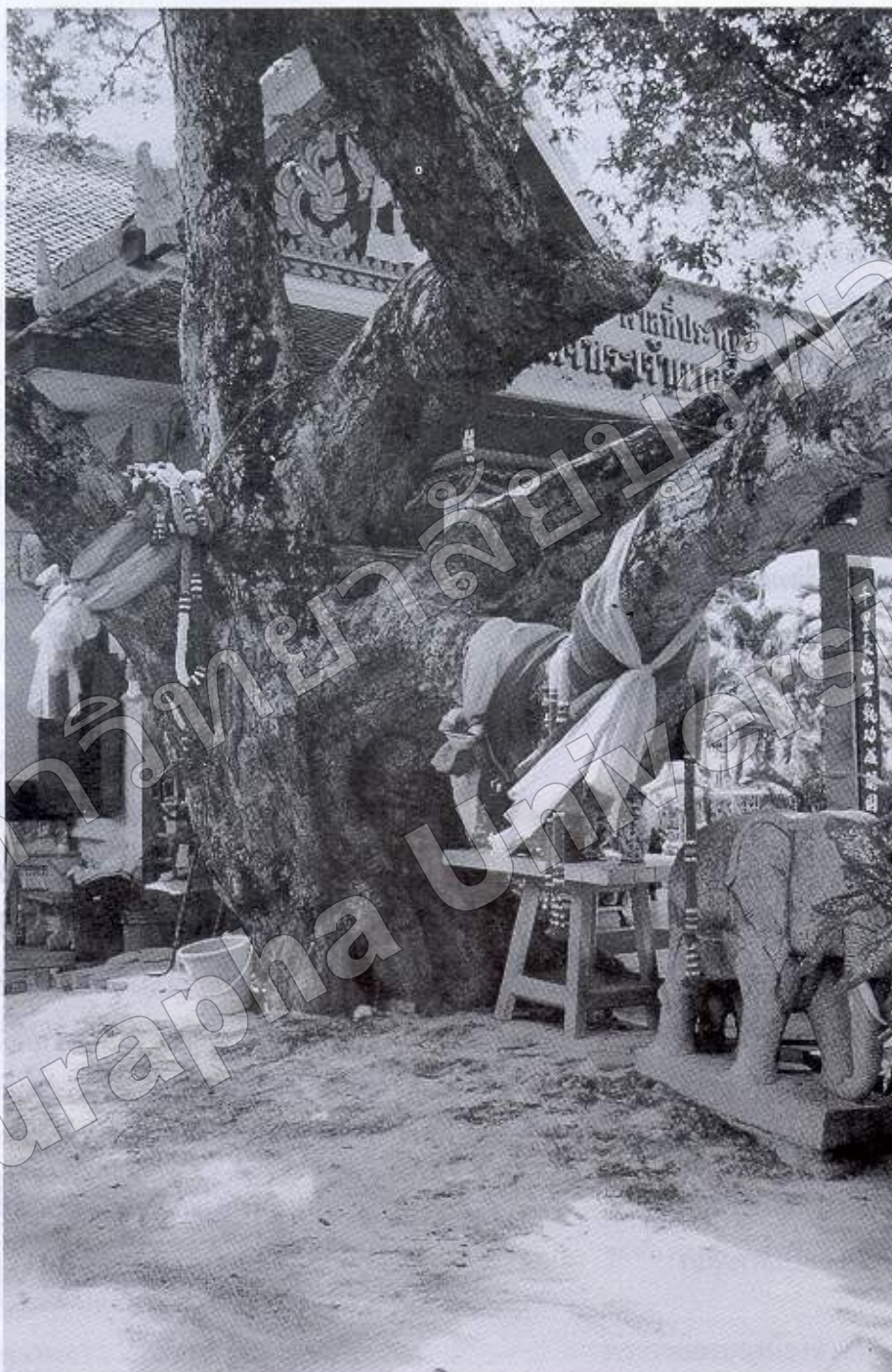
ภาพที่ ๘ ต้นสะตือผูกช้างสมเด็จพระเจ้าตากสินมหาราช ณ วัดกลุ่มชัยชุมพล อ. เมืองฯ จ.ระยอง