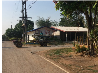
ภาพที่ 2 ชุมชนบ้านนาอีสาน ตำบลท่ากระดาน อำเภอสนมชัยเขต จังหวัดฉะเชิงเทรา

ชุมชนบ้านนาอีสานมีอาณาเขตติดต่อ ดังนี้ ทิศเหนือ มีพื้นที่ติดต่อกับ บ้านนายาว ตำบลท่ากระดาน อำเภอสนมชัยเขต จังหวัดฉะเชิงเทรา ทิศใต้ มีพื้นที่ติดต่อกับ ป่าชุมชนบ้านนาอีสาน ตำบลท่ากระดาน อำเภอสนมชัยเขต จังหวัดฉะเชิงเทรา ทิศตะวันออก มีพื้นที่ติดต่อกับบ้านโนนสมพร ตำบลพระเพลิง อำเภอเขาฉกรรจ์ จังหวัดสระแก้ว ทิศตะวันตก มีพื้นที่ติดต่อกับ ป่าชุมชนป่ารอยต่อ 5 จังหวัด ภาคตะวันออก