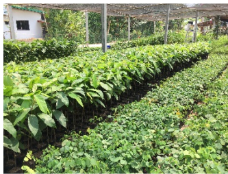
ภาพที่ 4 กลุ่มเพาะกล้าไม้บ้านนาอีสาน