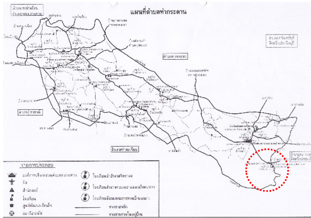
ภาพที่ 3 ตำแหน่งชุมชนบ้านนาอีสาน ตำบลท่ากระดาน อำเภอสนมชัยเขต จังหวัดฉะเชิงเทรา