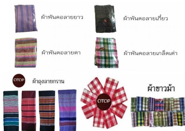
ภาพที่ 1 ผลิตภัณฑ์หลักของกลุ่มทอผ้าที่กระตุกไหล่หินตะวันตก หมู่ที่ 6

ลายขี้ไก่ ลายเกล็ดเต่า ลายสอง ลายก่านคอกวาย และลายจกไหล่หิน ดังภาพที่ 1 จัดจำหน่าย ณ สถานที่ตั้งของกลุ่มฯ และออกบูชงานแสดงสินค้าต่างๆ นอกจากนี้ยังรับทอผ้าตามคำสั่งซื้อของลูกค้า โดยการทำงานของกลุ่มเป็นรูปแบบดั้งเดิมและมีการดำเนินงานต่อเนื่องมาตั้งแต่ก่อตั้ง ทางกลุ่มจึงมีความต้องการพัฒนาทักษะในการะบวนการผลิตและกระบวนการอื่นๆ ที่เกี่ยวข้อง เพื่อเป็นการยกระดับผ้าทอไปสู่การเป็นสินค้าแฟชั่น