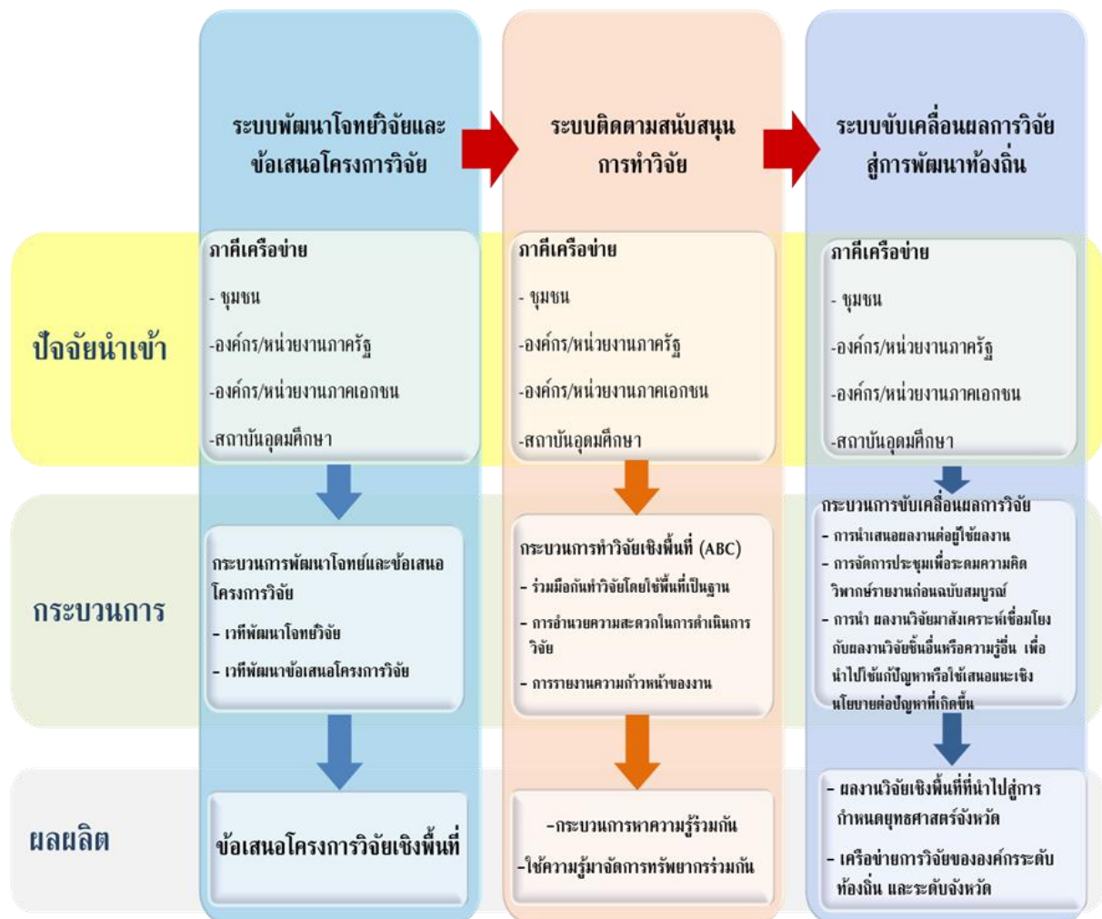
ภาพที่ 1 กรอบแนวคิดการวิจัย