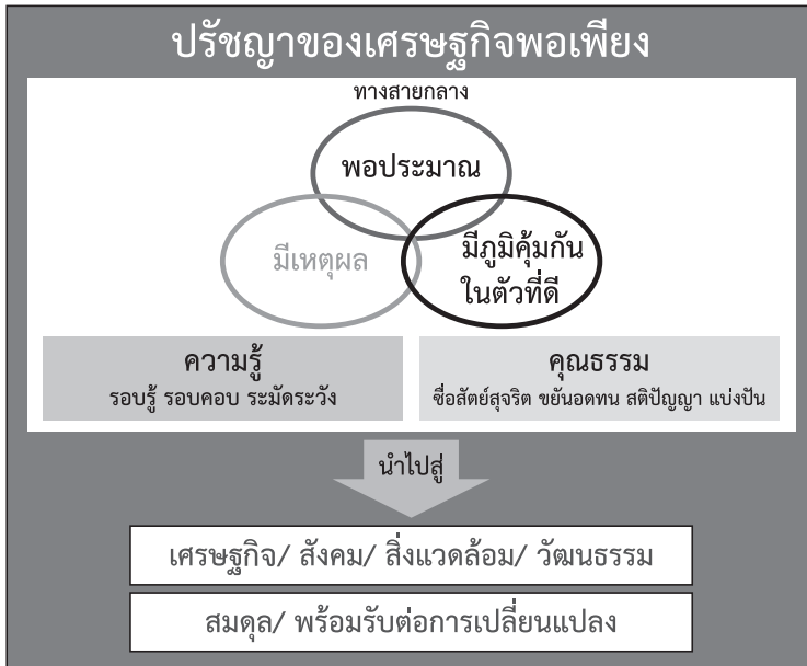
ภาพที่ 1 ปรัชญาเศรษฐกิจพอเพียง