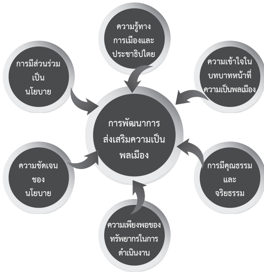
ภาพที่ 3 แสดงรูปแบบเพื่อพัฒนาการส่งเสริมความเป็นพลเมืองให้กับกรรมการศูนย์ส่งเสริมพัฒนาประชาธิปไตยตำบลในเขตภาคเหนือของประเทศไทย