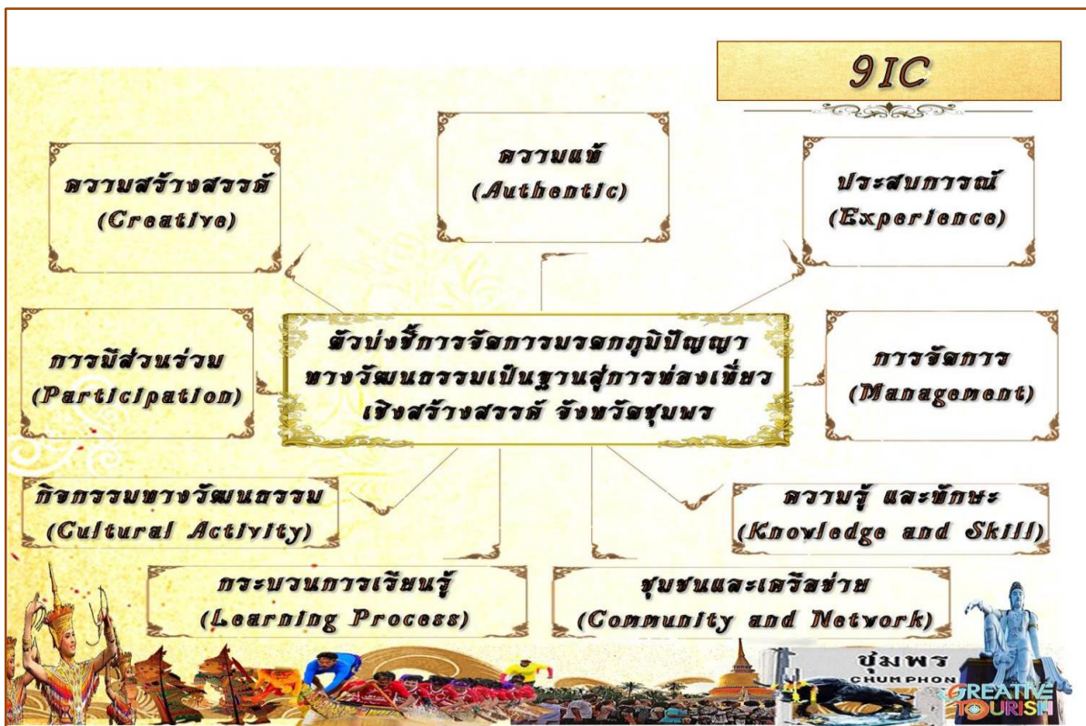
ภาพที่ 4 ตัวบ่งชี้การจัดการมรดกภูมิปัญญาทางวัฒนธรรมเป็นฐานสู่การท่องเที่ยวเชิงสร้างสรรค์ จังหวัดชุมพร (9IC)

หลักที่ 4 และองค์ประกอบหลักที่ 8 ในการพัฒนาตัวบ่งชี้การจัดการมรดกภูมิปัญญาทางวัฒนธรรมเป็นฐานสู่การท่องเที่ยวเชิงสร้างสรรค์ จังหวัดชุมพร มีโอกาสที่เป็นไปได้จริงในทุกประเด็น โดยค่ามัธยฐาน (Md) ที่ได้เกินกว่า 3.5 และพิสัยระหว่างควอไทล์ (Interquartile Range) \leq 1.5 ทุกประเด็น แต่มีข้อเสนอแนะให้องค์ประกอบหลักที่ 4 กระบวนการดำเนินการ (Process) รวมเข้ากับองค์ประกอบหลักที่ 6 การจัดการ (Management) และองค์ประกอบหลักที่ 8 วัฒนธรรม (Culture) รวมเข้ากับองค์ประกอบหลักที่ 11 กิจกรรมทางวัฒนธรรม (Cultural Activity) เนื่องจากเป็นองค์ประกอบที่มีลักษณะคล้ายกัน จึงสามารถสรุปได้ว่า องค์ประกอบที่เป็นตัวบ่งชี้การจัดการมรดกภูมิปัญญาทางวัฒนธรรมเป็นฐานสู่การท่องเที่ยวเชิงสร้างสรรค์ จังหวัดชุมพร ประกอบด้วย 9 องค์ประกอบ ผู้วิจัยได้สรุปรูปแบบการพัฒนา ตัวบ่งชี้การจัดการมรดกภูมิปัญญาทางวัฒนธรรมเป็นฐานสู่การท่องเที่ยวเชิงสร้างสรรค์ จังหวัดชุมพร (9IC) จากการสังเคราะห์เนื้อหา และการสรุปผลการวิจัย แสดงตามรูปภาพที่ 4 ดังนี้