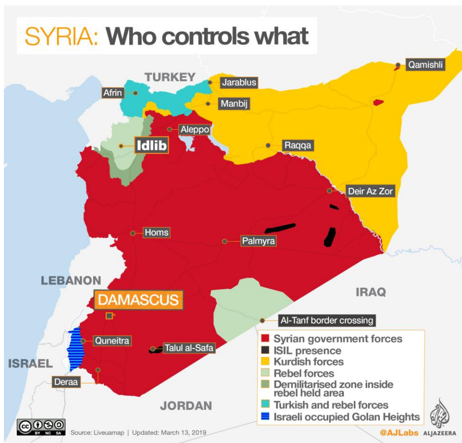
ภาพที่ 12 แผนที่ซีเรียแสดงการควบคุมในพื้นที่ของฝ่ายต่างๆ

นอกจากการดำเนินมหายุทธศาสตร์ของรัสเซียดังที่กล่าวมาแล้วข้างต้น ในสงครามกลางเมืองซีเรีย ยุทธศาสตร์ของประธานาธิบดี ปูติน ไม่ใช่แค่สนับสนุนพันธมิตรที่สำคัญซึ่งคือประธานาธิบดีอัสซาดของซีเรีย รัสเซียได้ใช้ความขัดแย้งในสงครามนี้ ที่จะหยุดอิทธิพลของกลุ่มพันธมิตรตะวันตกในภูมิภาค และผูกมิตรกับสมาชิกนาโต้ คือ ตุรกีอย่างใกล้ชิด จะเห็นได้ว่า รัสเซียไม่เคยละทิ้งยุทธศาสตร์สงครามเย็นในการเข้าไปเพิ่มความตึงเครียดระหว่างกลุ่มพันธมิตรนาโต้ด้วยกัน