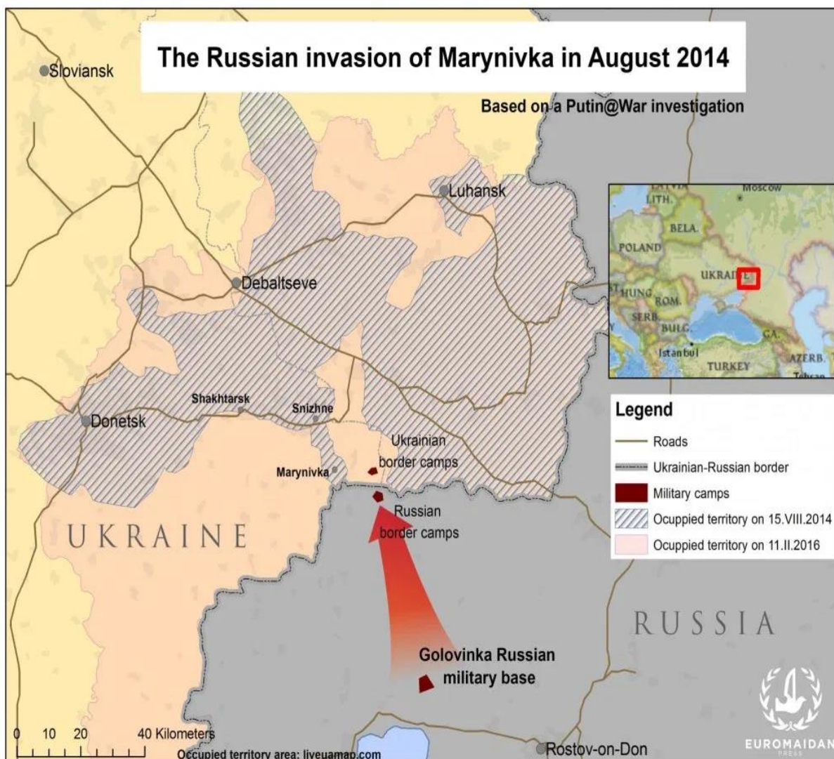
ภาพที่ 8 รัสเซียบุกกรุกเข้าเขตมารินนิฟก้า (Marynivka)

โอกาสให้สามารถเพิ่มอิทธิพลของตนเองเข้าไปในประเทศเหล่านั้น (Starr and Cornell, 2014, pp. 18-19) ดังภาพที่ 8 รัสเซียบุกกรุกเข้าเขตมารินนิฟก้า (Marynivka) เมื่อเดือนสิงหาคม ค.ศ. 2014 และภาพที่ 9 ปรากฏ ขบวนการปืนใหญ่ต่อต้านจรวดของรัสเซียในพื้นที่ Krasnodon ของยูเครน ซึ่งเป็นพื้นที่ควบคุมของกลุ่มแบ่งแยกดินแดนเชื้อสายรัสเซีย