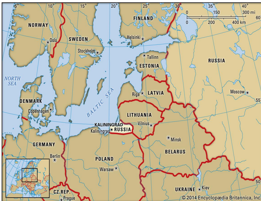
ภาพที่ 4 คาลินินกราด (Kaliningrad)

ความท้าทายที่สำคัญต่อมหายุทธศาสตร์ของรัสเซีย พบว่าอยู่ทางชายแดนตอนใต้ ตอนเหนือ และ ตะวันตกของรัสเซีย โดยเฉพาะทางตะวันตก เขตแดนที่ติดกับรัฐที่เป็นสมาชิกนาโต้ทั้งที่เคยเป็นพันธมิตรใน Warsaw Pact หรือเคยเป็นส่วนหนึ่งของสหภาพโซเวียต รัฐเหล่านี้รวมถึง โปแลนด์ที่ชายแดนตอนเหนือและ ลิทัวเนียที่ชายแดนตอนใต้ติดกับคาลินินกราดของรัสเซียที่แทรกเข้ามาระหว่างรัฐทั้งสอง ดังนั้น จึงเป็น อุปสรรคการเข้าถึงส่วนที่เหลือของรัสเซีย คือ คาลินินกราด ทั้งทางบกและทางอากาศ ดังภาพที่ 4