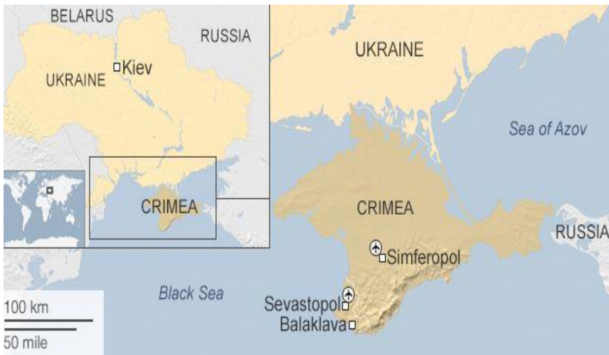
ภาพที่ 7 ฐานทัพเรือที่เซวาสโตโพล ที่ตั้งของกองเรือทะเลดำ

ด้วยเหตุนี้ รัสเซียจึงได้ผนวกไครเมียและสนับสนุนกบฏในภาคตะวันออกของยูเครน ซึ่งสามารถมองได้ว่าเป็นส่วนหนึ่งในความพยายามที่จะรวมเข้ากับสหพันธรัฐรัสเซีย เพื่อดำรงไว้ซึ่งความลึกทางยุทธศาสตร์ ก่อนที่ฝ่ายตรงข้ามจะเข้าถึงมอสโก กล่าวอีกนัยหนึ่ง รัสเซียมีความมั่นใจว่า ฐานทัพเรือที่เซวาสโตโพลในไครเมียซึ่งเป็นที่ตั้งของกองเรือทะเลดำ (Russian Black Sea fleet) ภาพที่ 7 จะทำให้นาโต้ห่างไกลออกไป ก่อนที่จะเข้าถึงมอสโก (Tata, 2014, pp. 1-3)