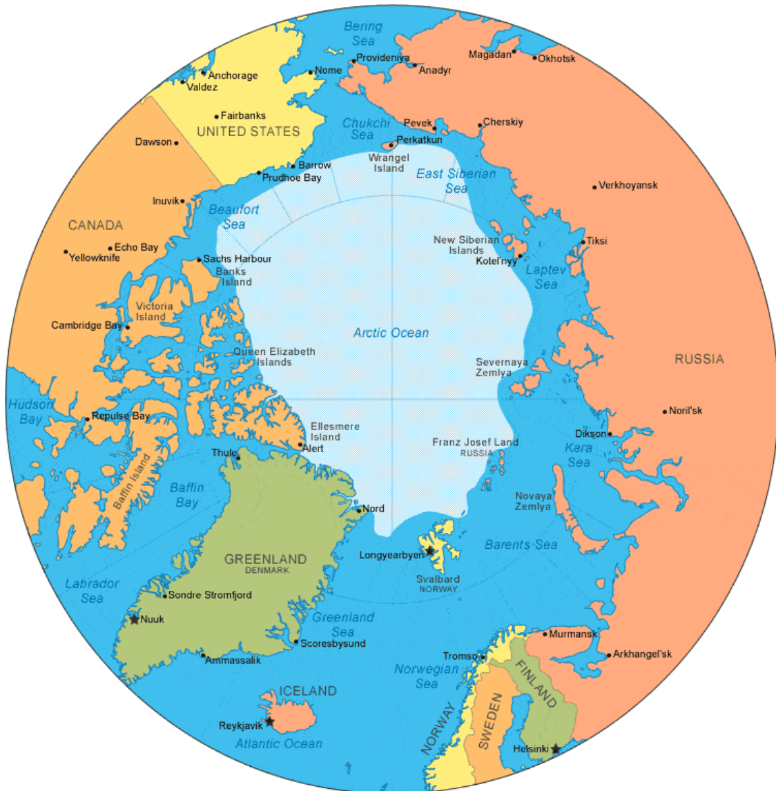
ภาพที่ 5 ทะเลแบเร็นตส์ ถึงช่องแคบเบริง

รัสเซียยังพบว่าตัวเองยังเผชิญหน้ากับสมาชิกนาโต้หลายประเทศในภูมิภาคมหาสมุทรอาร์กติก ที่สำคัญที่สุด คือ สหรัฐอเมริกา รัสเซียจึงประกาศการขยายการตั้งฐานทหารทางตอนเหนือนี้รวมถึงการตั้งกองบัญชาการทางทหารอาร์กติกใหม่ซึ่งรับผิดชอบความมั่นคงชายแดนจากทะเลแบเร็นตส์ ถึงช่องแคบเบริง ดังภาพที่ 5