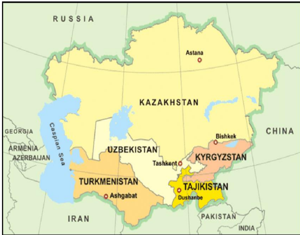
ภาพที่ 3 อาเซอร์ไบจาน คาซัคสถาน และเติร์กเมนิสถาน