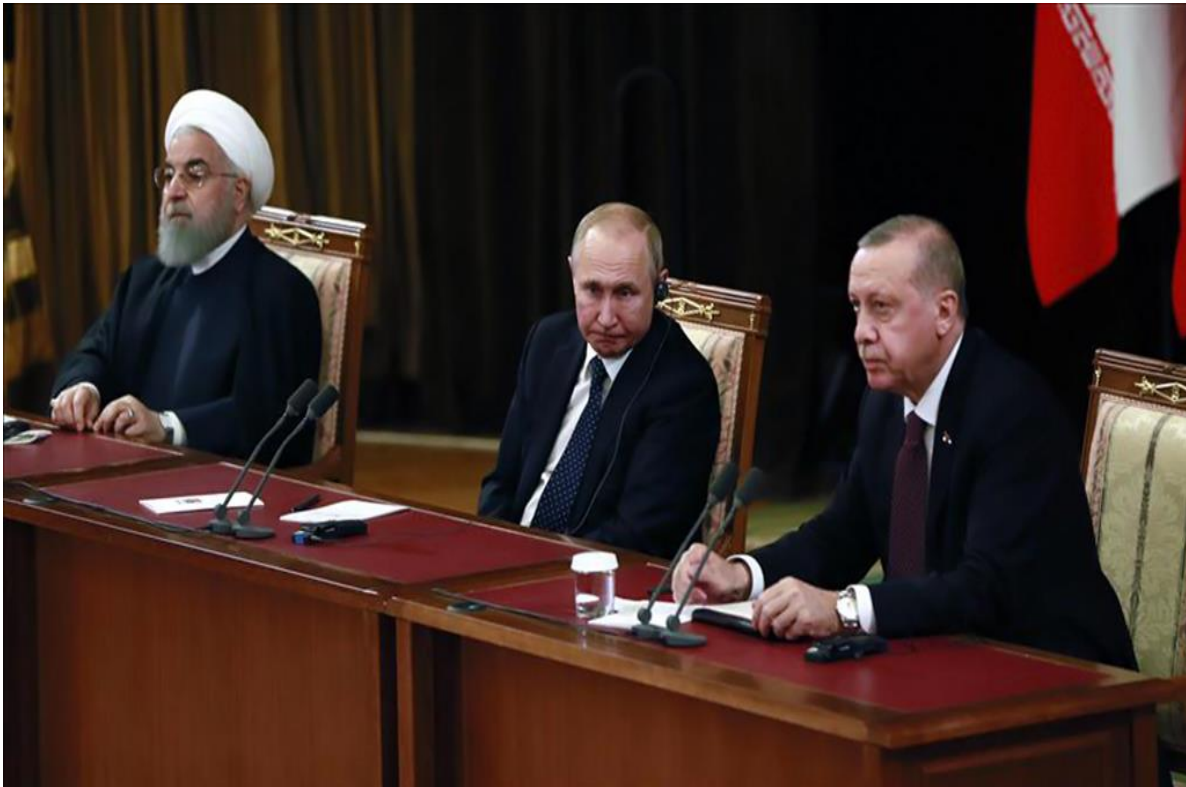
ภาพที่ 13 ประธานาธิบดีของอิหร่าน รัสเซีย และตุรกี ในการประชุมสุดยอดที่เมืองโซชีของรัสเซีย