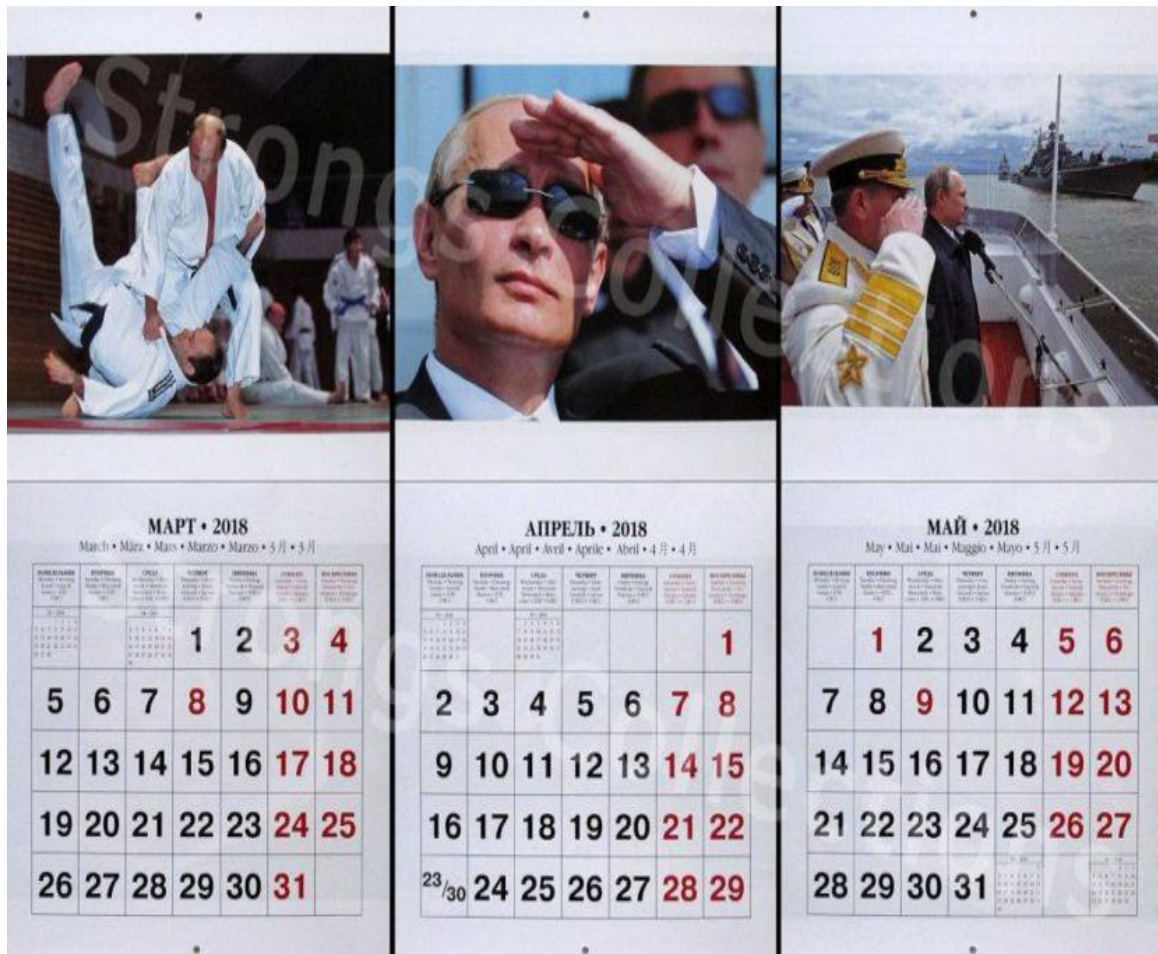
ภาพที่ 11 ประธานาธิบดี ปูติน ในปฏิทินปี 2018

ประธานาธิบดี ปูติน ได้ประยุกต์ใช้เครื่องมือต่างๆ เพื่อที่จะรวมสถานะของรัสเซีย ให้เป็นมหาอำนาจ เป็นลำดับความเร่งด่วนสูงสุด สูงกว่าการพัฒนาภายในประเทศ นอกจากนี้ ยังใช้สื่อรัสเซียเผยแพร่ความเป็นผู้นำของตนเอง ว่าเป็นผู้มีหลักการ มีความแข็งแรง และทันสมัย ไปยังผู้ฟังในสหภาพโซเวียตเดิม (Starr and Cornell, 2014, p. 63) ดังภาพที่ 11 ประธานาธิบดี ปูติน ในปฏิทิน ปี 2018