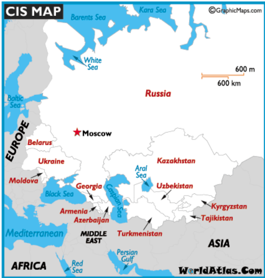
ภาพที่ 6 มอสโกพยายามขยายอิทธิพลให้ครอบคลุมถึง เบลารุส ยูเครน จอร์เจียและอาร์มีเนีย ที่มา: Worldatlas, 2019