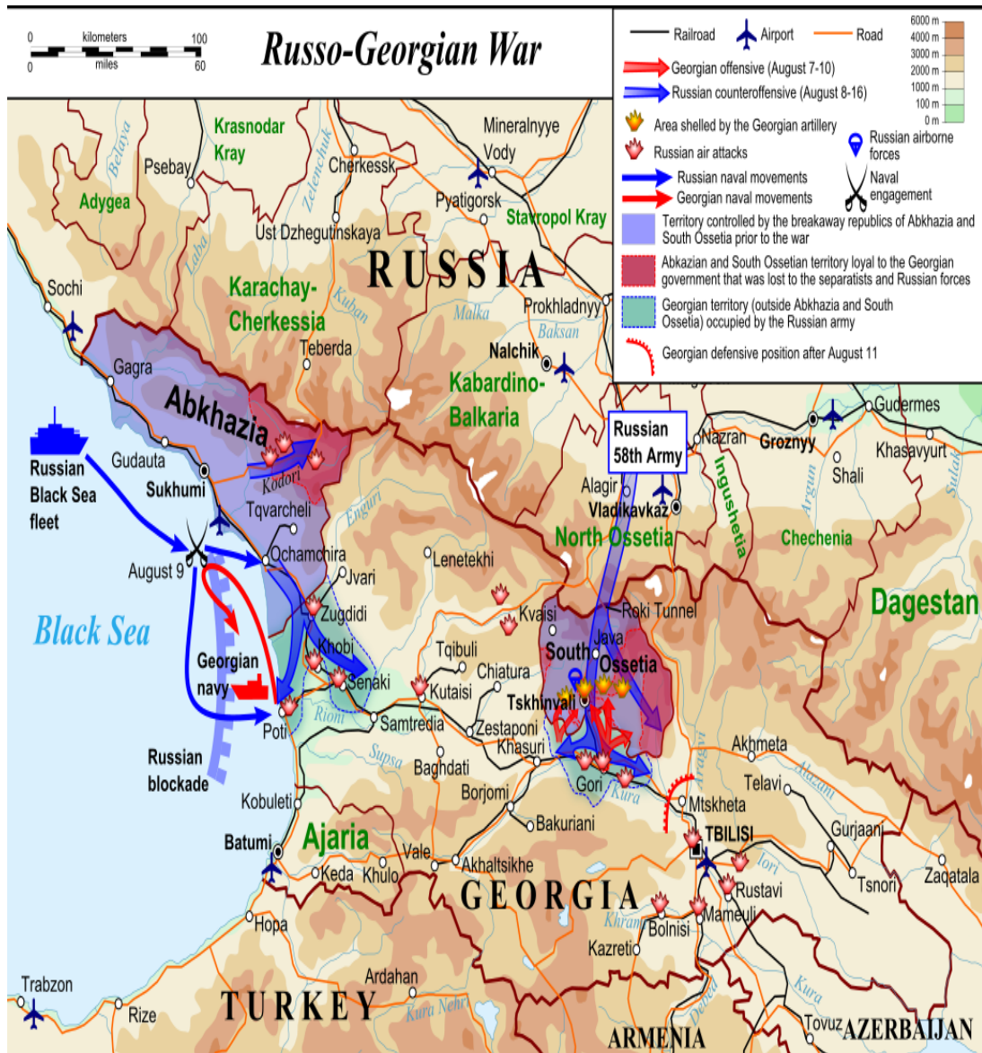
ภาพที่ 10: สงครามระหว่างรัสเซียกับจอร์เจีย และฐานทัพรัสเซียยังคงตั้งอยู่ใน Abkhazia และ South Ossetia

ซีเชียใต้ (South Ossetia) ร้อยละ 40 จากที่ถือครองอยู่เดิม พื้นที่ประมาณร้อยละ 20 ของจอร์เจียไม่อยู่ภายใต้การควบคุมของรัฐบาลจอร์เจียอีกต่อไป (Wikipedia, 2019b) ซึ่งเป็นไปตามความเชื่อของประธานาธิบดีปูติน ที่ต้องการให้รัสเซียคงความเป็นมหาอำนาจ ด้วยการรวบรวมดินแดนที่เคยเป็นสหภาพโซเวียตเดิมดังที่กล่าวมาแล้วข้างต้น