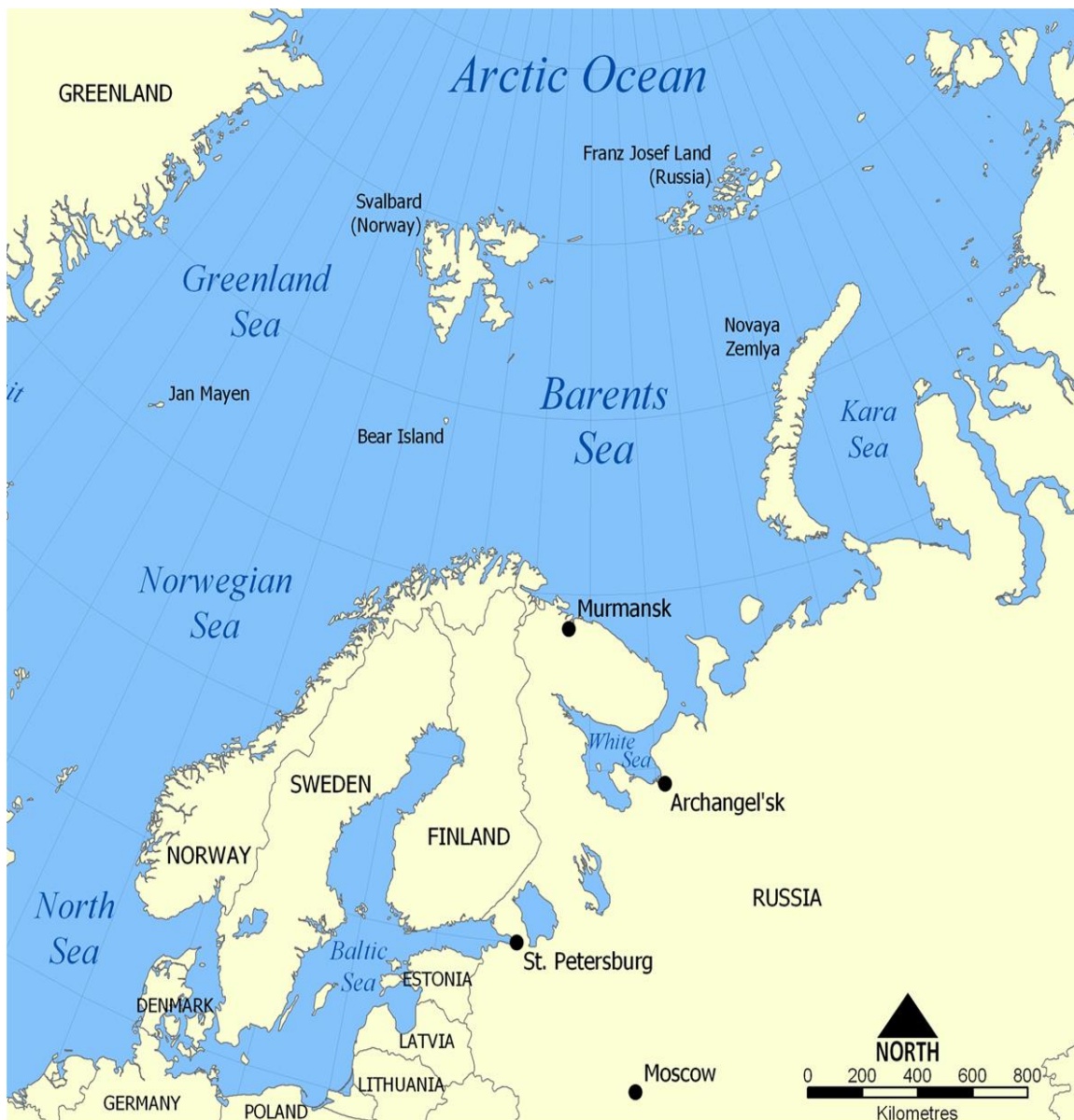
ภาพที่ 2 ทะเลบอลติก และทะเลแบเร็นตส์

จากภาพที่ 1 ในช่วงแรกของมหายุทธศาสตร์เชิงรุก รัสเซียให้ความสำคัญกับภูมิภาคนอร์ดิกบอลติก (Nordic-Baltic) โดยที่ให้อิทธิพลทะเลบอลติกเป็นพื้นที่กันชนทางเหนือของกลุ่มประเทศใน NATO (North Atlantic Treaty Organization) และระบบป้องกันภัยทางอากาศจะต้องสามารถตั้งอยู่ที่ชายทะเลบอลติก รวมทั้งจะต้องมีจุดเติมน้ำมันที่ใกล้กับทะเลแบเร็นตส์ (Barents) (ดูภาพที่ 2) ให้กับเครื่องบินทิ้งระเบิดทางยุทธศาสตร์ ก่อนที่จะบินตรงไปที่สหรัฐอเมริกา (Heikka, 2000, p. 9)