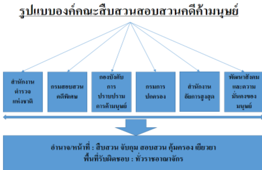
ภาพที่ 2 แผนภูมิ รูปแบบองค์คณะสืบสวนสอบสวนคดีค้ามนุษย์