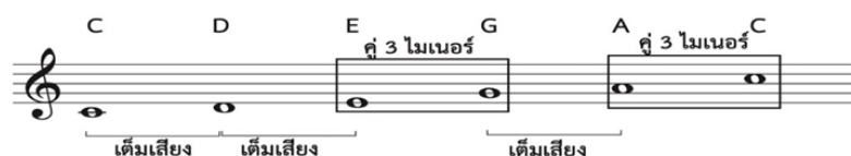
ภาพที่ 1 ภาพโครงสร้างบันไดเสียงเพนทาโทนิค

บันไดเสียงเพนทาโทนิคเป็นบันไดเสียงที่แพร่หลายเป็นอย่างมากในหลายวัฒนธรรมทั้งในวัฒนธรรมดนตรีตะวันตกและวัฒนธรรมดนตรีของเอเชียในหลายประเทศ เช่น จีน ญี่ปุ่น ไทย เป็นต้น บันไดเสียงเพนทาโทนิค หรือ บันไดเสียงห้าเสียง คำว่า “Penta” มาจากภาษากรีกแปลว่า ห้า หมายถึง บันไดเสียงที่ประกอบด้วยโน้ต 5 ตัวในระดับเสียงต่างกัันมีโครงสร้างที่ประกอบด้วยขั้นคู่เต็มเสียงจำนวน 3 คู่ ตามด้วยคู่ 3 ไมเนอร์อีกจำนวน 2 คู่ (ณัชชา พันธุ์เจริญ, 2552)