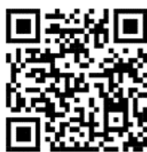
ภาพที่ 4 คิวอาร์โค้ดเพื่อนำไปสู่ตัวอย่างไฟล์สกอ์เพลง The Glamour of Chonburi

ผู้วิจัยได้จัดทำไฟล์สกอ์เพลงสำหรับดูประกอบอรรถาธิบายบทประพันธ์ตามคิวอาร์โค้ดดังนี้