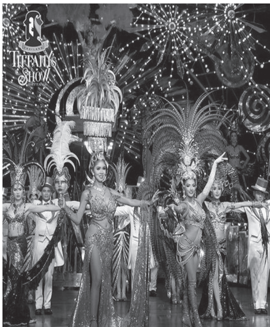
ภาพที่ 4 การแสดงของทิฟฟานีโชว์ พัทยา