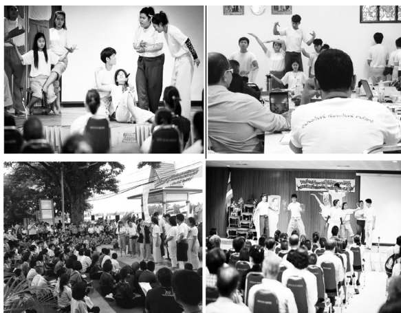
ภาพที่ 3 การถ่ายทอดความรู้สึก ความคิดผ่านการแสดงละครและกิจกรรมหลังละคร

นอกจากเยาวชนจะได้เรียนรู้มุมมองการใช้ชีวิตแบบใหม่ผ่านละครร่วมสร้าง โดยพัฒนาบทละครสร้างละครและจัดแสดงในชุมชนร่วมกัน เยาวชนได้ลงมือปฏิบัติการทางสังคมในฐานะพลเมือง ผ่านการจัดแสดงละคร โดยหลังแสดงละครเกิดวสนทนากับคนในชุมชน เกิดแลกเปลี่ยนแนวทางการดูแลรักษาและแก้ไขสถานการณ์ปัญหาของแม่น้ำบางปะกง นำพาไปสู่การพูดคุยและสร้างปฏิบัติการเพื่อดูแลแม่น้ำบางปะกงให้กับคนในพื้นที่ได้ดี ละครจึงยกระดับเป็นเครื่องมือสื่อสารสู่สังคมกลายเป็นละครณรงค์เพื่อสร้างความเข้าใจเรื่องการดูแลรักษาแม่น้ำบางปะกงอย่างมีส่วนร่วม ตามภาพที่ 4