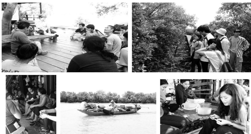
ภาพที่ 1 การฟังเรื่องเล่าริมน้ำบางปะกง และเรียนรู้วิถีวัฒนธรรมบางปะกง

หลังจากเยาวชนลงพื้นที่ผู้เขียนจัดกระบวนการสะท้อนตนเอง (Self-Reflection) เป็นระยะๆ เครื่องมือการเก็บข้อมูลประกอบไปด้วยสมุดจดบันทึก รูปภาพ และภาพถ่ายบันทึกสิ่งที่เกิดขึ้น พบว่าจากกิจกรรมนี้ทำให้เยาวชนได้เรียนรู้ชีวิตผู้อื่น ได้รับฟังเรื่องราว ได้รับรู้ความรู้สึกของคนในชุมชนผ่านเรื่องเล่าอย่างใจเปิดรับ ได้เรียนรู้วิถีการมองโลกแบบอื่นๆ เรียนรู้ความสัมพันธ์ระหว่างคนกับธรรมชาติ ทั้งในมุมมองประวัติศาสตร์ ที่มา รากเหง้าของพื้นที่ เรียนรู้มุมมองการพัฒนาเชิงพื้นที่ระหว่างชาวบ้านกับนักพัฒนาในพื้นที่ รวมทั้งการรับฟังปัญหาเกี่ยวกับการใช้ทรัพยากรธรรมชาติโดยขาดการมีส่วนร่วม