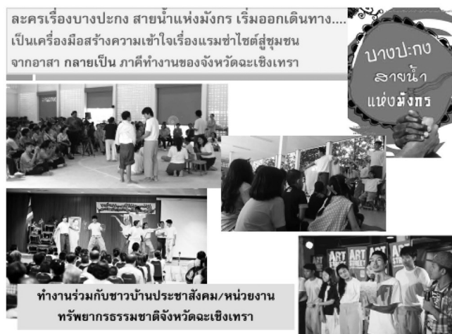
ภาพที่ 4 การจัดแสดงละครในชุมชน ปฏิบัติการทางสังคมในฐานะพลเมือง