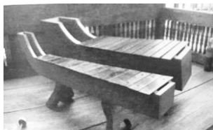
ที่มา : เพลงระบำ