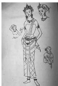
ภาพที่ 16 ภาพร่างเครื่องแต่งกายระเบียบวิธี