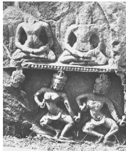
ภาพที่ 6 นางพื่อนรำ ทับหลังปราสาทหินพิมาย