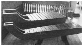
ที่มา : เพลงระบำ