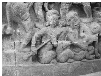
ที่มา : เพลงระเบ้า