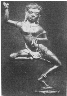
ภาพที่ 5 รูปหล่อสำริดโยคินี ศิลปะลพบุรี

เกิดขึ้นจากแนวความคิดของนายธนิต อยู่โพธิ์ (อดีตอธิบดีกรมศิลปากร) เช่นเดียวกับระบำทวารวดีประดิษฐ์ขึ้น โดยอาศัยหลักฐานจากโบราณวัตถุ และภาพจำหลักตามโบราณสถาน ซึ่งสร้างขึ้นตามแบบศิลปะของขอม ที่อยู่ในประเทศกัมพูชา และประเทศไทย อาทิ พระปรางค์สามยอดในจังหวัดลพบุรี ทับหลังประตูระเบียงตะวันตกของปราสาทหินพิมายในจังหวัดนครราชสีมา ปราสาทหินพนมรุ้งในจังหวัดบุรีรัมย์ เป็นต้น