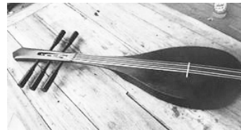
ที่มา : เพลงระบำ

การสร้างสร้งงานแสดงนาฏศิลป์รูปแบบระบำจากหลักฐานทางประวัติศาสตร์ ที่มาจากการผสมผสานศิลปะโบราณวัตถุ โบราณสถาน ตำรา ให้สามารถสื่อสารเรื่องราว บรรยากาศ และเอกลักษณ์ของอาณาจักรต่างๆ ในยุคโบราณผ่านท่วงทีลีลาทางด้านนาฏศิลป์ จัดว่าเป็นการบูรณาการศาสตร์และศิลป์ทางด้านทัศนศิลป์ ดุริยางคศิลป์ และนาฏศิลป์เข้าด้วยกันอย่างลงตัว เพื่อให้ผู้ชมเข้าใจเรื่องราวโดยใช้ประสบการณ์จากภูมิหลังของตน ให้เข้ากับข้อมูลทางประวัติศาสตร์และโบราณคดี เมื่อผู้ชมเกิดความเข้าใจในการแสดงย่อมเกิดการรับรู้และมีอารมณ์ร่วมไปกับสุนทรีย์ภาพที่บังเกิดขึ้นจากการชมระบำที่สร้างขึ้นมาจากหลักฐานทางประวัติศาสตร์ องค์ประกอบสำคัญในการสร้างงาน คือ ข้อมูลหลักฐานทางประวัติศาสตร์ การออกแบบท่ารำ การออกแบบเครื่องแต่งกายและการออกแบบดนตรี อย่างเช่นระบำโบราณคดี ทั้ง 5 สมัยเป็นจุดเริ่มต้นสำคัญที่ส่งอิทธิพลต่อการสร้างสร้งค์ระบำที่สร้างขึ้นตามหลักฐานประวัติศาสตร์ในชั้นหลังต่อมา เช่น ระบำศรีชัยสิงห์ ระบำเทพพนมรุ่ง ระบำเทวีศรีสัชนาลัย ฯลฯ