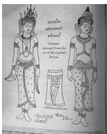
ภาพที่ 18 ภาพร่างเครื่องแต่งกายระเบ้าลพบุรี