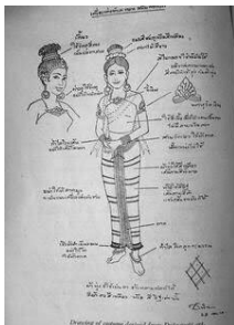
ภาพที่ 14 ภาพร่างเครื่องแต่งกายระบำทวารวดี