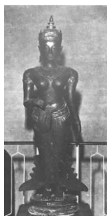
ภาพที่ 7 เทวรูป พระอุม่าสำริด สมัยสุโขทัย