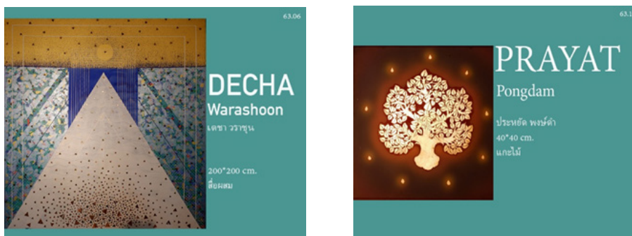
ภาพที่ 4 ตัวอย่างการออกแบบบัตรทะเบียนวัตถุ