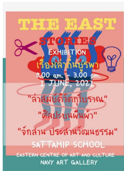
ภาพที่ 11 ป้ายนิเทศน์นิทรรศการ The East stories เรื่องเล่าถิ่นบูรพา