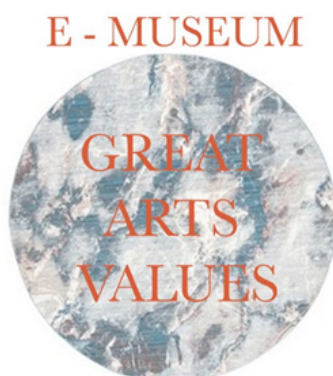
ภาพที่ 5 โลโก้เพจ E-Museum of Great Arts Values