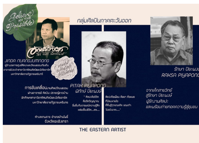
ภาพที่ 9 แผ่นพับนิทรรศการ Eastern artist : Renowned artworks