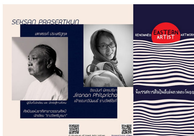
ภาพที่ 10 แผ่นพับนิทรรศการ Eastern artist : Renowned artworks