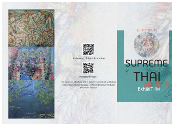
ภาพที่ 7 แผ่นพับนิทรรศการ Supreme of Thai artists