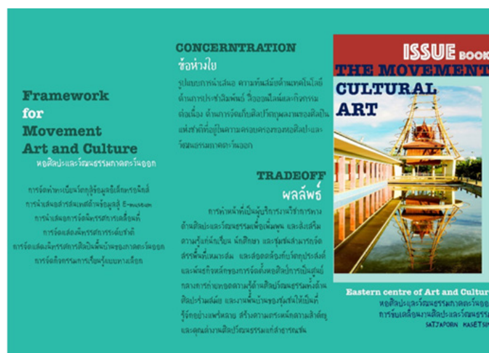
ภาพที่ 1 Issue Book การขับเคลื่อนงานของหอศิลปะและวัฒนธรรมภาคตะวันออก