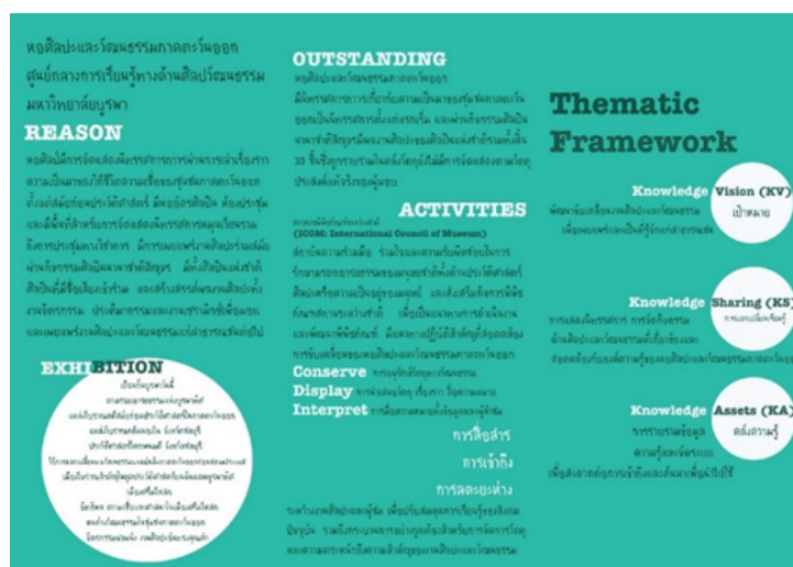
ภาพที่ 2 Issue Book การขับเคลื่อนงานของหอศิลปะและวัฒนธรรมภาคตะวันออก