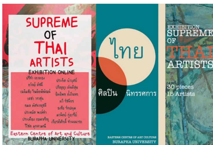
ภาพที่ 6 ป้ายนิเทศน์นิทรรศการ Supreme of Thai artists

การจัดแสดงนิทรรศการระดับชาติ จากการรวบรวมและจัดทำทะเบียนวัตถุผลงานศิลปินแห่งชาติทั้ง 30 ชิ้นของ หอศิลป์และวัฒนธรรมภาคตะวันออก นำมาพัฒนาและจัดแสดงนิทรรศการระดับชาติ Supreme of Thai artists รวบรวม ประวัติ ผลงาน แนวคิดที่ถ่ายทอดผ่านผลงานศิลป์ และเผยแพร่ผ่านเพจ https://www.facebook.com (E-Museum of Great Arts Values)