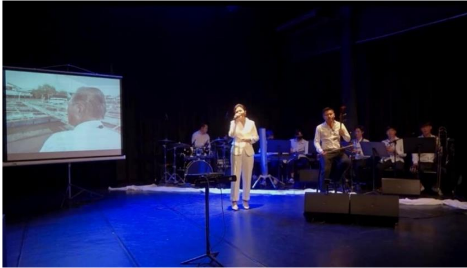
ภาพที่ 4 ช่วงการแสดงที่ 4 กระชังปลาของคุณตา

ช่วงการแสดงที่ 5 การยุติเรื่องราวหรือจุดจบของเรื่อง ในช่วงการแสดงสุดท้ายนี้เป็นการสรุปเรื่องราวในการแสดง การตีความเนื้อเรื่อง มีการกล่าวสรุปถึงการแสดงทั้งหมด วัตถุประสงค์ความตั้งใจของงานการแสดงขึ้นนี้เพื่อทิ้งท้ายและย้ำถึงความตั้งใจของผู้วิจัยในการสร้างสรรค์การแสดง และปิดการแสดงด้วยเสียงร้องของคุณตาในบทเพลง บางปะกง เพลงเดียวกับเพลงเปิดการแสดงในช่วงการแสดงที่ 1 เพื่อทิ้งท้ายเรื่องของการแสดง บางปะกงแหล่งชีวิต : กระชังปลาของคุณตา