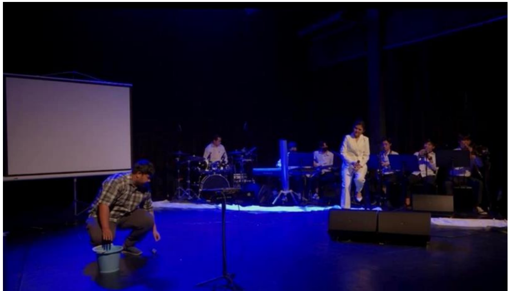
ภาพที่ 3 ช่วงการแสดงที่ 3 เล่าเรื่องโดยคนในชุมชน

ช่วงการแสดงที่ 3 ความยุ่งยาก เป็นการลงลึกถึงปัญหาที่เกิดขึ้นจากเหตุการณ์กระตุ้น การตีความเนื้อเรื่อง มีการเปิดให้คนในชุมชนร่วมส่งเสียง แสดงความคิดเห็นถึง ปัญหา การเปลี่ยนแปลงที่เกิดขึ้น เพื่อตอบโจทย์การแสดงเพื่อชุมชน มีการเล่าเรื่องในอดีตของผู้วิจัยที่มีต่อ แม่น้ำบางปะกงและครอบครัว และมีการใช้บทเพลง เรือนแพ เพื่อโยงถึงความสุขที่ได้อาศัยอยู่ริมแม่น้ำ ได้อยู่กับครอบครัว ได้เห็นคุณค่าให้อาหารปลา