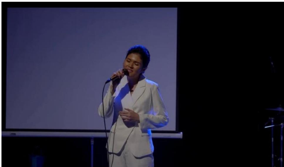
ภาพที่ 5 ช่วงการแสดงที่ 5 บทสรุปในการแสดง

ช่วงการแสดงที่ 5 การยุติเรื่องราวหรือจุดจบของเรื่อง ในช่วงการแสดงสุดท้ายนี้เป็นการสรุปเรื่องราวในการแสดง การตีความเนื้อเรื่อง มีการกล่าวสรุปถึงการแสดงทั้งหมด วัตถุประสงค์ความตั้งใจของงานการแสดงขึ้นนี้เพื่อทิ้งท้ายและย้ำถึงความตั้งใจของผู้วิจัยในการสร้างสรรค์การแสดง และปิดการแสดงด้วยเสียงร้องของคุณตาในบทเพลง บางปะกง เพลงเดียวกับเพลงเปิดการแสดงในช่วงการแสดงที่ 1 เพื่อทิ้งท้ายเรื่องของการแสดง บางปะกงแหล่งชีวิต : กระชังปลาของคุณตา