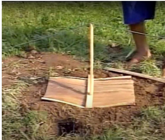
ภาพที่ 4 การนำไม้มาวางบนหลุมและคล้องด้วยเชือก