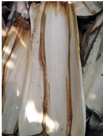
ภาพที่ 2 กาบหมาก

กล่าวว่า “กลองขุมดินของพ่อครูคำ กาไว้นั้น เป็นการนำมาดัดแปลงจากเดิม ชื่อว่า กลองกาบหมาก แต่เสียงที่ออกมาจะมีลักษณะคล้ายกับของเดิม ซึ่งกลองขุมดินแต่เดิมนั้นใช้มือหรือไม้ตีไปที่ปากหลุมให้เกิดเสียงผ่านทางปล่องลม” จากข้อมูลดังกล่าว ผู้เขียนได้ทำการค้นคว้าตัวอย่างการตีกลองกาบหมาก (หรือกลองดิน) ของพ่อครูคำ กาไว้น โดยค้นพบจากเว็บไซต์ You Tube ดังนี้