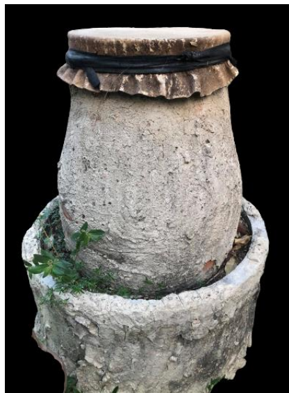
ภาพที่ 1 กลองขุมดิน

ปากหลุมให้มีเสียงดังกังวาน หากศึกษาประวัติของกลองขุมดินที่เป็นลายลักษณ์อักษรนั้น ไม่สามารถปรากฏหลักฐานทางเอกสารในปัจจุบัน อาจกล่าวได้ว่ายังไม่เป็นที่สนใจแก่นักวิชาการหรือผู้ที่สนใจศึกษา สำหรับเรื่องราวของกลองขุมดินเป็นสิ่งที่อาจถูกมองข้ามไปตามค่านิยมที่เกิดขึ้นใหม่ในปัจจุบัน แต่เป็นเครื่องดนตรีที่เกิดจากภูมิปัญญาของคนโบราณที่ยังคงมีการสืบทอดอยู่ และมีการพัฒนาขึ้นใหม่ไปตามแนวคิดของศิลปิน ทั้งนี้อาจกล่าวได้ว่า กลองขุมดิน เป็นสิ่งที่ควรอนุรักษ์ไว้แก่การศึกษา เพราะเป็นสิ่งที่เกิดขึ้นจากภูมิปัญญาของมนุษย์สมัยก่อนกับเรื่องราวของความเชื่อ และยังคงสืบทอดให้คงอยู่มาถึงปัจจุบัน โดยผู้เขียนจะนำเสนอเรื่องราวของกลองขุมดินและการบรรเลงในเรื่องของ คติธรรมความเชื่อต่อไป