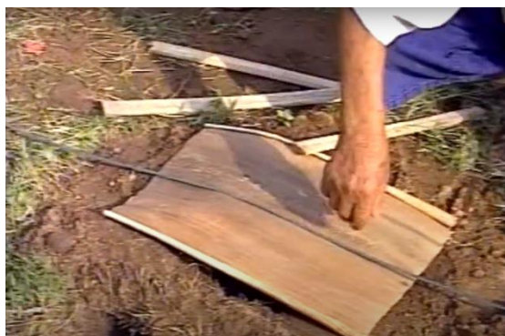
ภาพที่ 3 การประดิษฐ์กลองกาบหมาก

หมายเหตุ : จาก www.nanagarden.com/product/308695