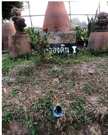
ภาพที่ 9 ปล่องเสียงของกลองชุมดิน

จากลักษณะกลองชุมดินข้างต้น รูปแบบแรกจะใช้หนังมาหุ้มไว้ที่ปากกลอง ซึ่งหากมองก็จะเห็นด้วยว่ามีลักษณะคล้ายกลองที่มีอยู่ทั่วไป ส่วนรูปแบบที่ 2 จะเป็นลักษณะกลองคว่ำหน้าลงใช้ ส่วนวิธีการตีก็สามารถใช้ได้ทั้งมือ และไม้ตีสลับกันตามเสียงต่าง ๆ โดยพื้นดินยังคงแบบเดิมกลองดิน คือ จะขุดหลุมไว้ 2 จุด ได้แก่ จุดที่เป็นบริเวณที่ใช้มือตี คือปากหลุม ส่วนที่ 2 คือบริเวณที่เป็น ปล่องเสียง เพื่อให้เสียงผ่านออกมา จะอยู่บริเวณปลายหลุม ทั้งสองหลุมจะมีลักษณะคล้ายตัว L มีระยะห่างกันประมาณ 2 เมตร ซึ่งเสียงที่ผ่านออกมาก็มีลักษณะเหมือนของเดิมเช่นกัน ดังตัวอย่างรูปภาพนี้