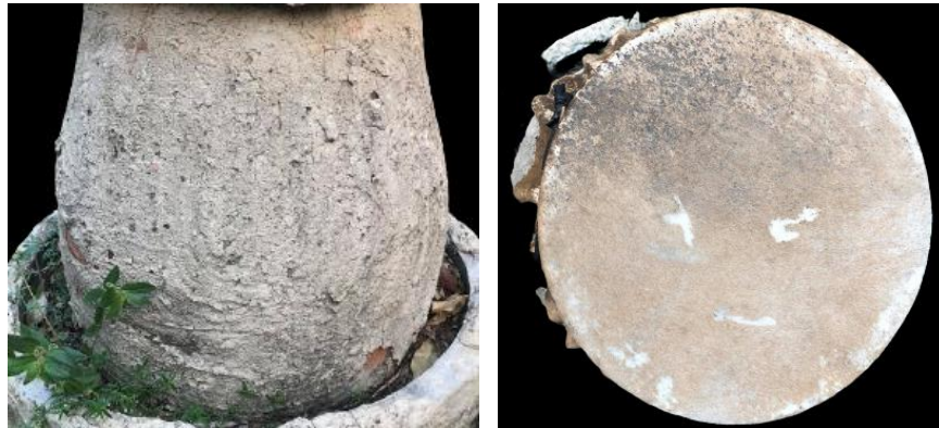
ภาพที่ 7 กลองขุมดินจากการปั้นของพ่อครูมงคล เสียงซารี แบบที่ 1