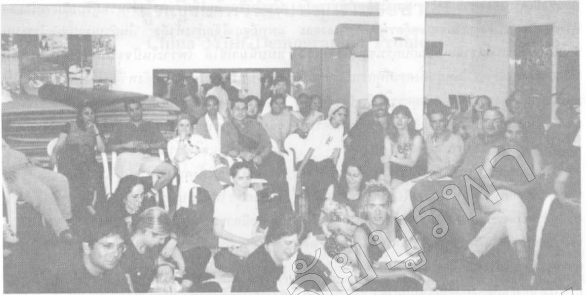
ห้องสอน (CLASS) การเตรียมคลอดสำหรับหญิงตั้งครรภ์และครอบครัว