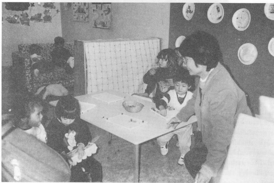
รูปที่ 3 เด็กเล่นตามจิตนาการ

กิจกรรมที่เตรียมไว้ให้เด็กแต่ละวัยจะมีการวางแผน โดยเน้นการกระตุ้นพัฒนาการตามวัย และศักยภาพของเด็กแต่ละคน และปล่อยอิสระให้เด็กเล่นตามจินตนาการ นอกจากนั้นยังส่งเสริมและสนับสนุน