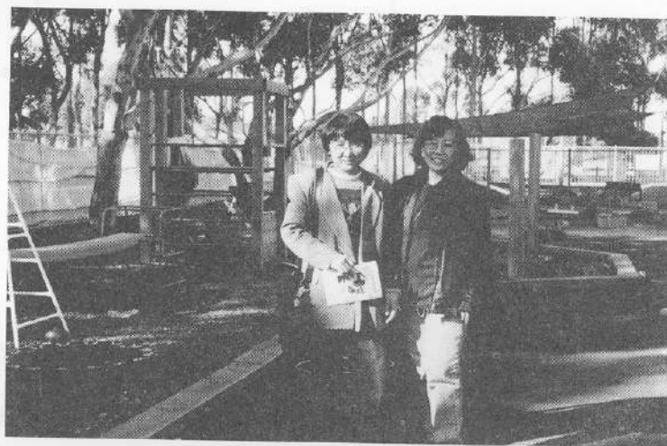
รูปที่ 6 สนามเด็กเล่นนอกอาคาร

ไปเล่นกลางแจ้งนอกอาคารในช่วงเดือนตุลาคม-เมษายน จะต้องสวมหมวกที่ปิดคอและใบหู พร้อมทาครีม กันแดด SPF 15 นานอย่างน้อย 15 นาที ก่อนออกไป เล่นกลางแจ้ง