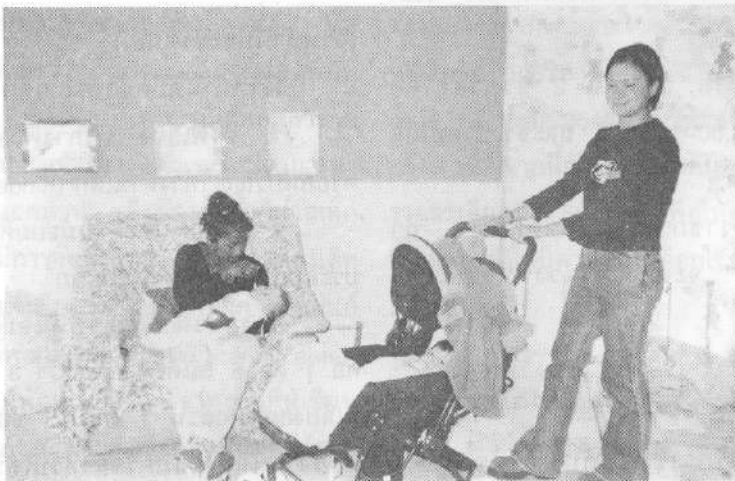
รูปที่ 1 มารดามีส่วนในการให้อาหารเด็ก

พัฒนาการเด็กแต่ละวัย และสภาพของร่างกาย เช่น เด็กอายุ 4-5 ปี มีอ่างน้ำสำหรับเล่นของเล่นในน้ำ และเด็กใส่ผ้าอย่างกันเปื้อน มีการเล่นระบายสี มีตัวต่อพลาสติก และมีโซฟาให้เด็กเล่นปีนป่าย เป็นต้น ส่วนห้องเด็กอายุต่ำกว่า 1 ปี ก่อนนอนเจ้าหน้าที่จะเปิดเพลงเบา ๆ กล่อมเด็กทุกครั้ง แต่ละห้องบิดามารดาสามารถเข้าเยี่ยมเด็กและมีส่วนร่วมในการให้นมหรือให้อาหารเด็ก นอกจากนั้นภายนอกอาคารเป็นสนามหญ้ากว้าง แบ่งเป็น 2 ส่วน มีเครื่องเล่นสำหรับเด็กได้เล่นในช่วงเช้า (11.00 น.) และช่วงบ่าย (16.30 น.)