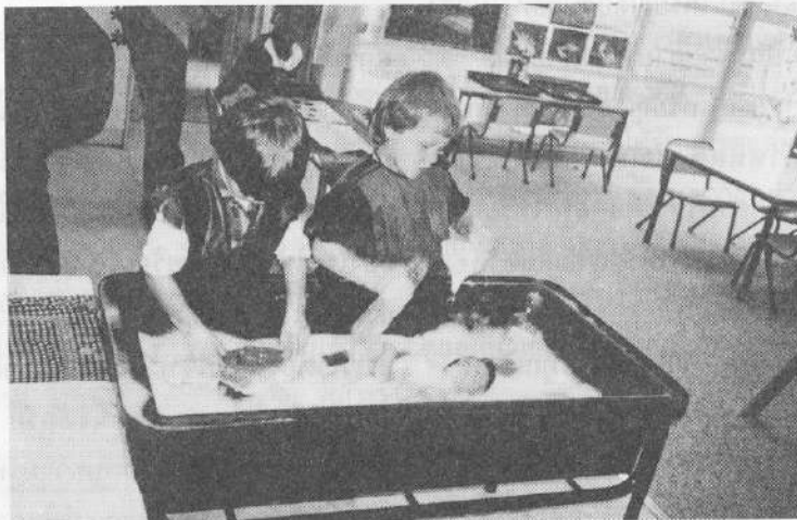
รูปที่ 2 เด็กเล่นอย่างอิสระ