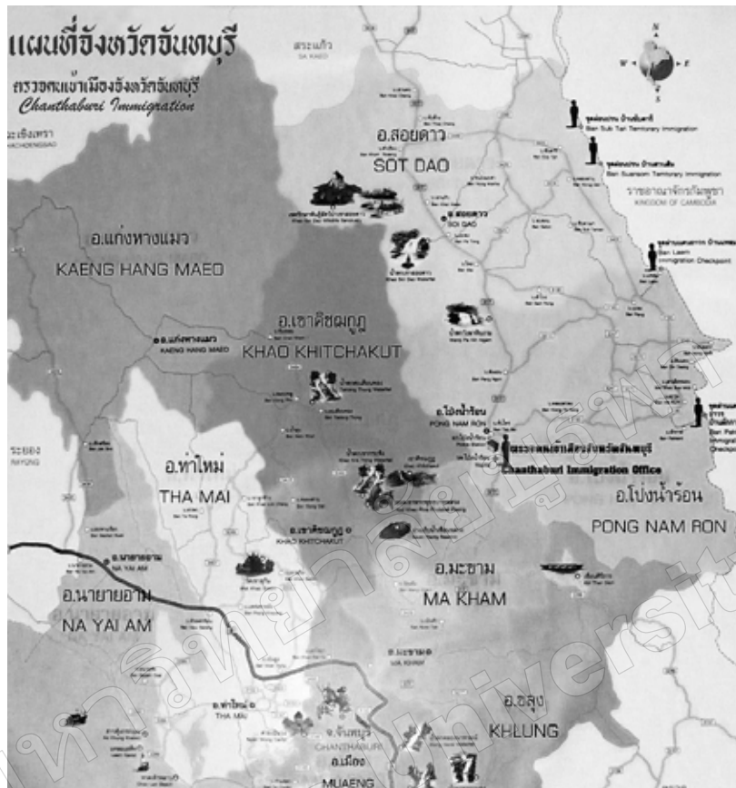
ภาพที่ 1 แผนที่แสดงจุดผ่านแดนถาวรและจุดผ่อนปรนการค้าไทย-กัมพูชา ด้านจังหวัดจันทบุรี