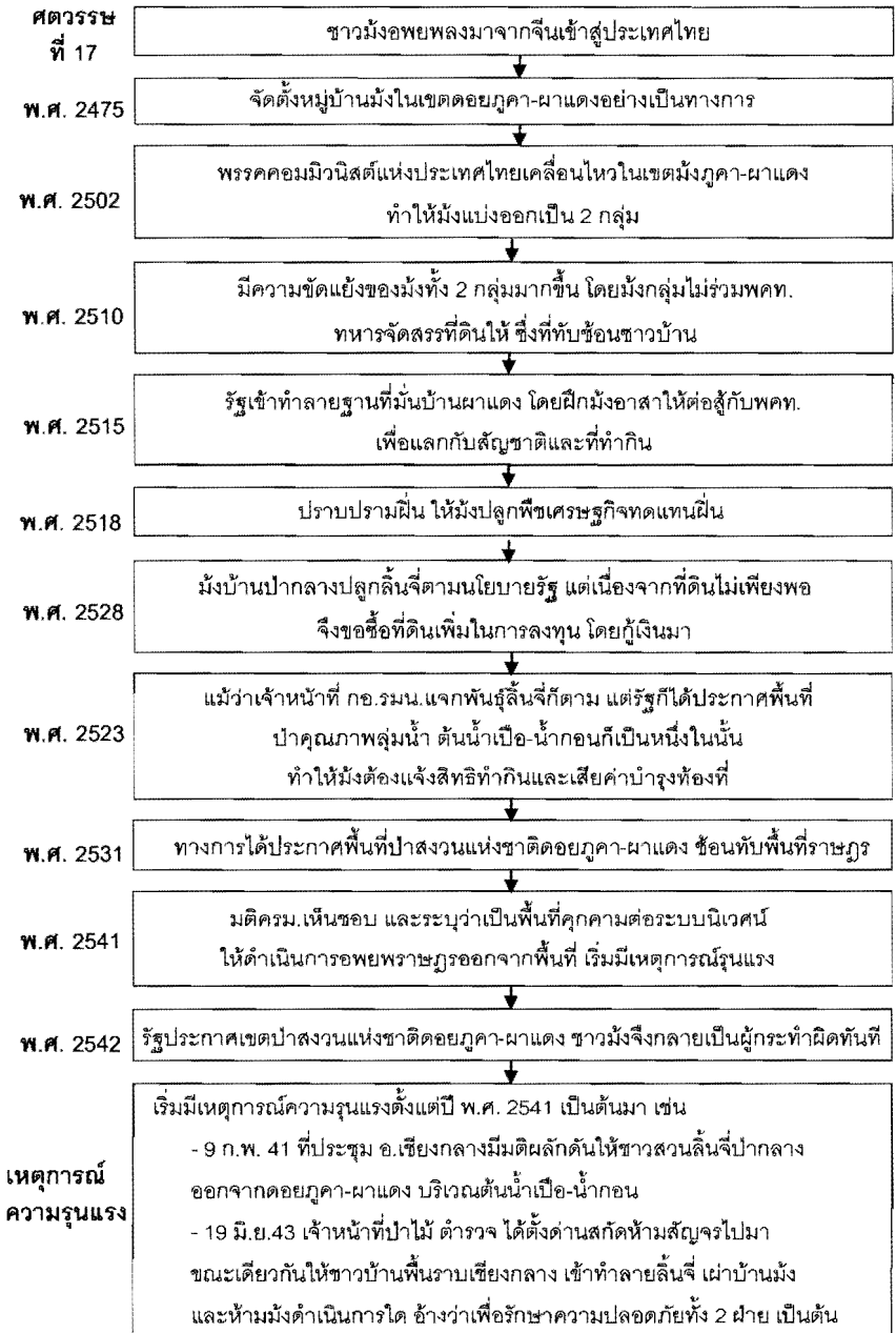
ภาพที่ 3 แผนภาพลำดับเหตุการณ์ความขัดแย้งการใช้พื้นที่ต้นน้ำของชาวมังปากกลาง