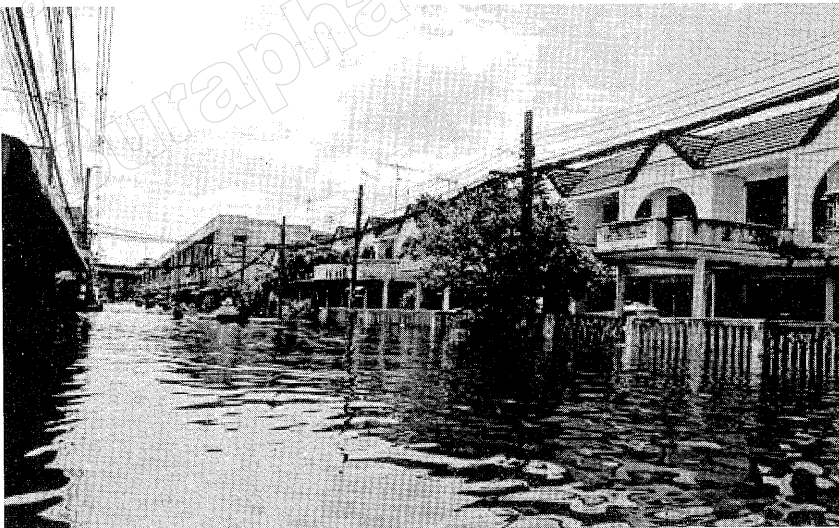
ภาพที่ 1 น้ำท่วมภายในชุมชนอยู่เจริญ เมื่อปี พ.ศ. 2554

เกิดภาวะน้ำท่วม มีหลายชุมชนที่มีการจัดการที่นำมาซึ่งปัญหาที่ส่งผลกระทบต่อประชาชนในชุมชน เช่น การรับบริจาคอาหารจากภายนอกชุมชนมีการกระจายไม่ทั่วถึงครอบคลุมชุมชน บางครัวเรือนมีการรับบริจาคอย่างเหลือเฟือ แต่บางครัวเรือนไม่เคยได้รับสิ่งของช่วยเหลือเลยชุมชนอยู่เจริญ เขตดอนเมือง กรุงเทพมหานคร นับเป็นเขตที่ประสบอุทกภัยที่ประกาศให้เป็นพื้นที่อพยพ แต่จากการที่ผู้วิจัยได้ติดตามข่าวสารโดยเฉพาะจากสื่อโทรทัศน์พบว่า ชุมชนอยู่เจริญ นับเป็นชุมชนที่สามารถบริหารจัดการชุมชนที่เป็นระบบ โดยอาศัยการมีส่วนร่วมของสมาชิกในชุมชน จนเป็นชุมชนต้นแบบ “อยู่เจริญโมเดล” ที่ต่อสู้อุทกภัยน้ำท่วม แม้ว่าในระยะแรก ๆ จะช่วยกันป้องกันน้ำท่วมชุมชนของตนเองได้ แต่ในที่สุดก็ไม่สามารถเอาชนะปริมาณน้ำที่มากได้ชุมชนจึงประสบกับอุทกภัย แต่พบว่าแม้ชุมชนจะประสบกับอุทกภัยที่เกิดขึ้น ชุมชนได้มีการบริหารจัดการที่สมาชิกในชุมชนมีส่วนร่วมเพื่อให้วิกฤตดังกล่าวผ่านพ้นไปด้วยดี