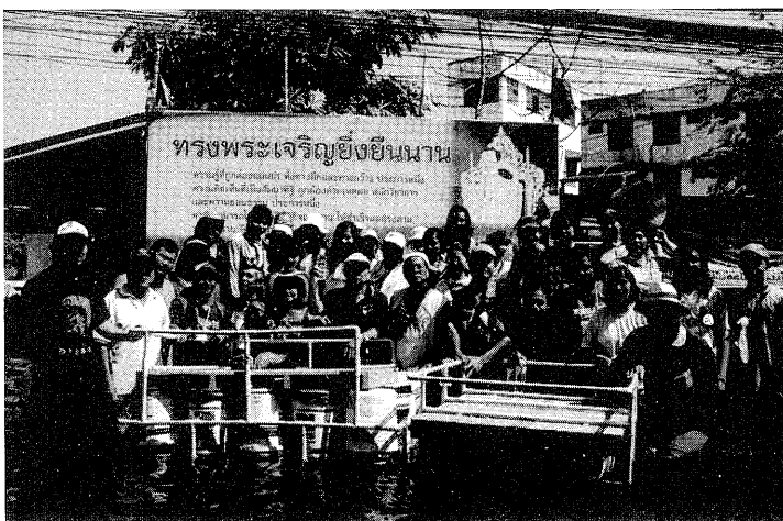
ภาพที่ 3 พลังของคนในชุมชนเพื่อการช่วยเหลือในภาวะวิกฤตน้ำท่วมเมื่อปี พ.ศ.2554

นอกจากนี้ ประธานชุมชนยังอาศัยความเป็น เมืองหรือกรุงเทพมหานครที่เป็นศูนย์รวมของหน่วยงาน ต่าง ๆ แม้จะไม่ใช่หน่วยงานที่จะจัดสรรงบประมาณให้ กับชุมชนโดยตรง แต่ก็มี การเสนอโครงการและขอ งบประมาณจากหน่วยงานที่เกี่ยวข้อง เช่น กิจกรรมการ ต่อต้านยาเสพติด ของบสนับสนุนจากสำนักงานส่งเสริม คุณภาพ (สสส.) และกองปราบปรามยาเสพติด สำนักงาน ตำรวจแห่งชาติ และของบประมาณสนับสนุนในกิจกรรม อื่นๆ จากหน่วยงานต่างๆ ที่เกี่ยวข้องกับกิจกรรม โดย เฉลี่ยได้งบประมาณที่เป็นรูปแบบต่างๆ ทั้งที่เป็นเงินและ อุปกรณ์รวมเฉลี่ยปีละประมาณ 5 แสนบาท