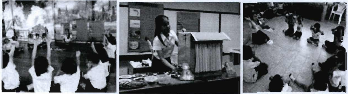
ภาพที่ 9 - 11 ตัวอย่างกิจกรรมการสนทนา การเล่านิทาน การร้องเพลงและการเคลื่อนไหว

รูปภาพต่อไปนี้สะท้อนการพัฒนาทักษะการจัดประสบการณ์ที่นิสิตสามารถออกแบบกิจกรรมที่เน้นผู้เรียนเป็นสำคัญอย่างหลากหลาย เหมาะสมกับวัตถุประสงค์การสอน เช่น การสนทนา การเล่านิทาน การร้องเพลง การเคลื่อนไหว การอ่านและการเขียน การทดลอง การลงมือกระทำจริง การใช้ประสาทสัมผัสทั้งห้าในการเรียนรู้ ผ่านการมอง ฟัง สัมผัส ดมกลิ่น และชิมรส บทบาทสมมติ การประกอบอาหาร การเรียนรู้ผ่านการใช้สื่อของจริง ซึ่งส่งเสริมให้เด็กมีส่วนร่วมในกิจกรรมการเรียนรู้อย่างสูงสุด ดังตัวอย่างต่อไปนี้