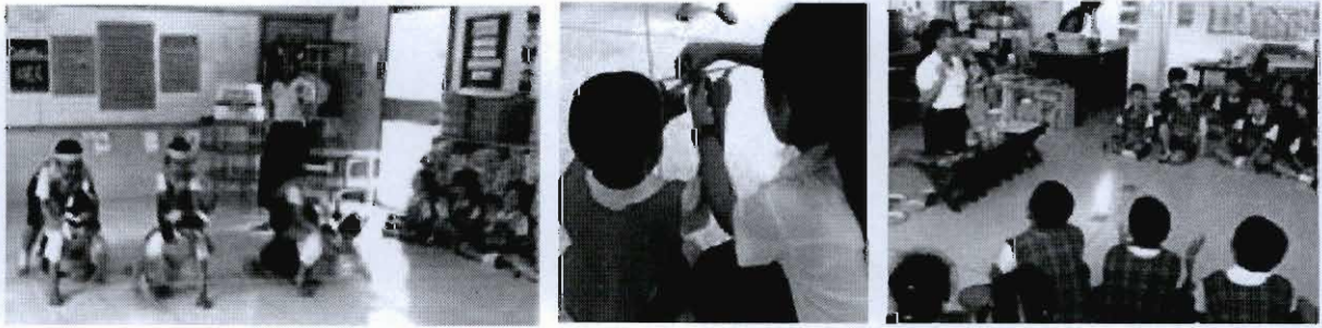
ภาพที่ 12 - 14 ตัวอย่างกิจกรรมบทบาทสมมติ การลงมือกระทำจริง และการทดลอง