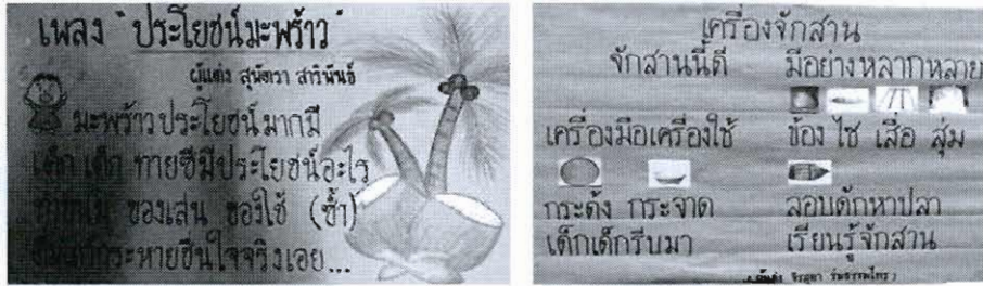
ภาพที่ 1 และ 2 ตัวอย่างเพลงจากหน่วยมะพร้าวพาเพลิน และคำคล้องจองจากหน่วยจักสานพนัส