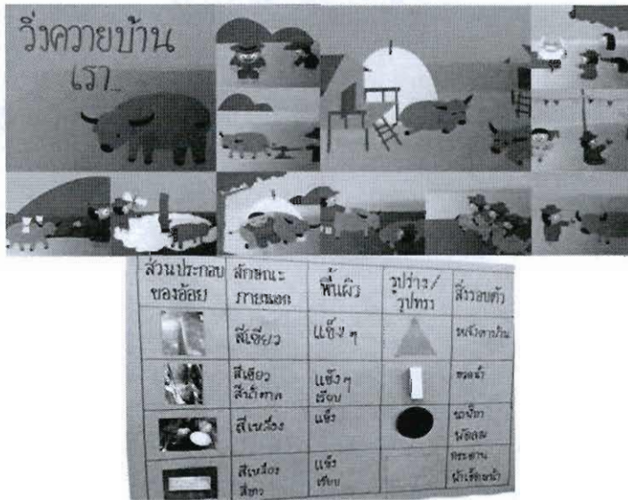
ภาพที่ 3 และ 4 ตัวอย่างนิทานจากหน่วยประเพณีวิ่งควาย และแผนผังสรุปข้อมูลจากหน่วยอ้อยหวาน