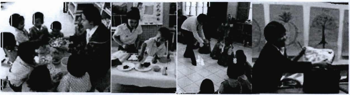
ภาพที่ 15 - 18 ตัวอย่างกิจกรรมการประกอบอาหารและการเรียนรู้ผ่านประสาทสัมผัสทั้งห้าผ่านการใช้สื่อของจริง