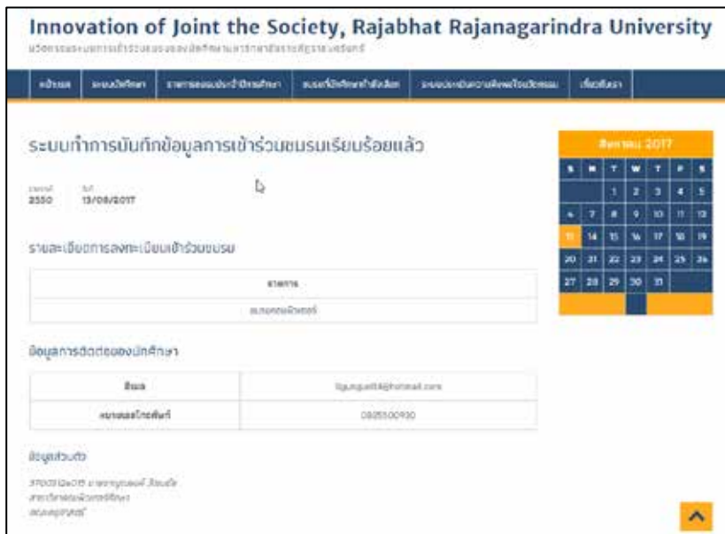
ภาพที่ 3 ภาพหน้าเว็บไซต์ของการบันทึกข้อมูลการเข้าร่วมชมรมเสร็จเรียบร้อยแล้ว