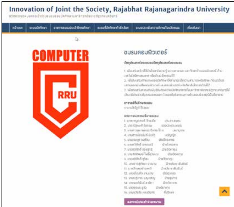
ภาพที่ 2 ภาพหน้าเว็บไซต์ข้อมูลรายละเอียดของชมรมและการลงทะเบียนเข้าร่วมชมรม