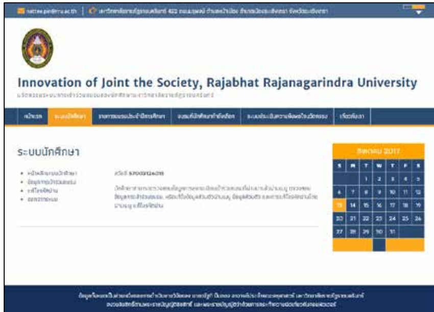
ภาพที่ 4 ภาพหน้าเว็บไซต์ของระบบนักศึกษา