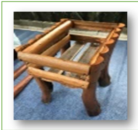
ภาพที่ 2 ผลิตภัณฑ์กระถางต้นไม้ตาลโตนด

ปัญญาที่มีอยู่ในท้องถิ่นเกิดจากตาลโตนดมาแปรรูปให้เกิดประโยชน์ ไม่ว่าจะทำน้ำตาลสด ขนตาล น้ำตาลปึก เป็นต้น แต่ในเมื่อการใช้ประโยชน์จากต้นตาลโตนดไม่ได้ตลอดอายุของต้น ไม่นานต้นก็แก่เต็มที่ ต้นตาย และลำต้น กาบใบ ที่แห้งจากบนต้นหรือหล่นลงมา คนในชุมชนสามารถมาประยุกต์ในการใช้ประโยชน์จากต้นตาลโตนดที่ต้นแก่เหล่านั้น อาทิ เช่น การแปรรูปเป็นเฟอร์นิเจอร์ที่หลากหลาย สำหรับในการวิจัยครั้งนี้ ได้ประเด็นการใช้ประโยชน์จากต้นตาลโตนดมาแปรรูปเป็นผลิตภัณฑ์สร้างสรรค์ได้ผลิตภัณฑ์ที่เหมาะสมในการถ่ายทอดภูมิปัญญา 2 ผลิตภัณฑ์ ได้แก่ 1. ผลิตภัณฑ์กระถางต้นไม้ตาลโตนด 2. ไม้ตาลคลายเส้น ดังแสดงภาพที่ 2-3