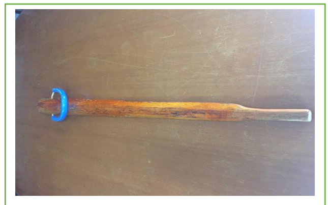
ภาพที่ 3 ผลิตภัณฑ์ไม้ตาลคลายเส้น