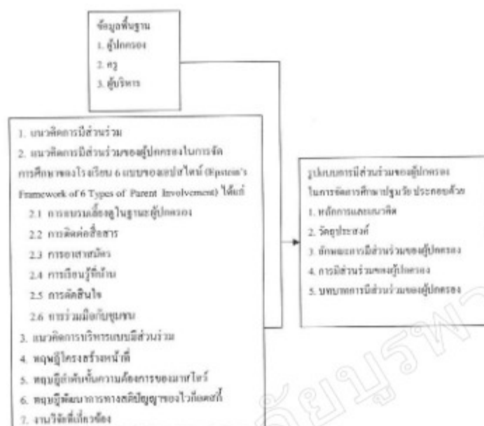
ภาพที่ 1 กรอบแนวคิดในการวิจัย