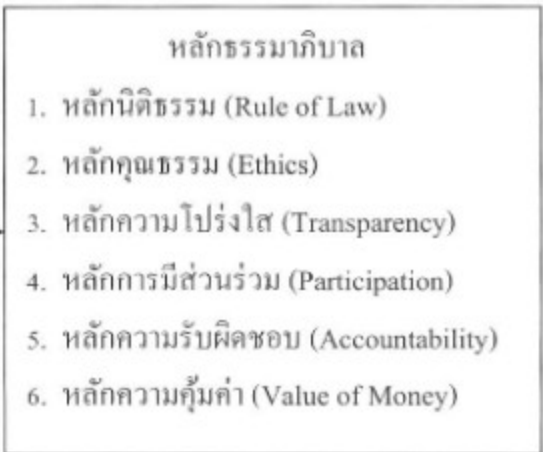
ภาพกรอบแนวคิดในการวิจัย